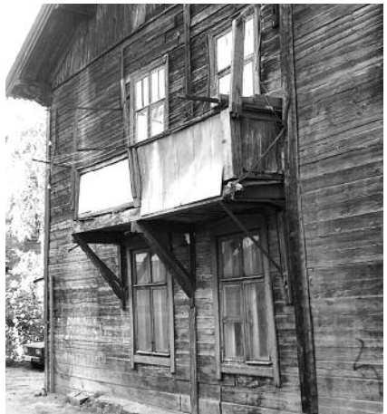
● НА ФОТО: ДОМ ПО УЛ. СЕРАФИМОВИЧА, 18