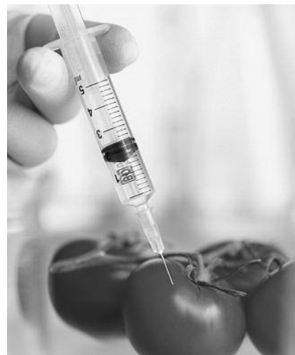
● НА ФОТО: ПОТРЕБИТЕЛИ НЕ ЗНАЮТ, ИСПОЛЬЗУЕТСЯ ЛИ В ПРОДУКТЕ ГМО

На инициативу Онищенко уже отозвались пользователи интернет. По их мнению, в заявлении главного санврача прослеживается лоббирование интересов Monsanto Company — транснациональной компании, мирового лидера биотехнологии растений. Нужно понимать, что в результате переопыления «соседних полей», сорт с повышенной выживаемостью (то есть ГМО) вытесняет сорт «классический». А в необыкновенно урожайный ГМО-сорт может быть внедрен ген-терминатор, который, например, через 3 года полностью изменит характер расте-