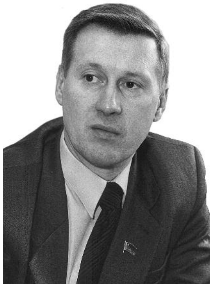
● НА ФОТО: АНАТОЛИЙ ЛОКОТЬ

Налицо несогласованность действий между губернатором Новосибирской области и областным партийным отделением «Единой России», которая устами первых лиц — секретаря политсовета регионального отделения партии Александра