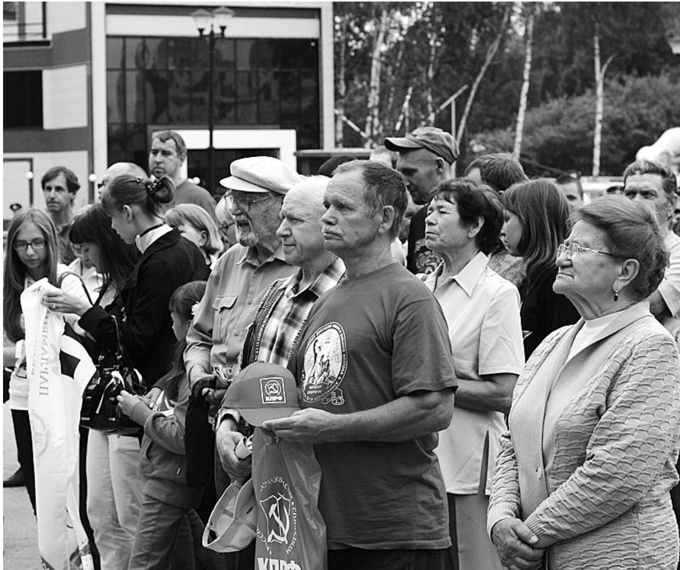
● НА ФОТО: МИНУТА МОЛЧАНИЯ ПО КОНСТИТУЦИИ РОССИЙСКОЙ ФЕДЕРАЦИИ. ПЛОЩАДЬ ПЕРЕД ГПНТБ. 12 ИЮНЯ 2012 ГОДА