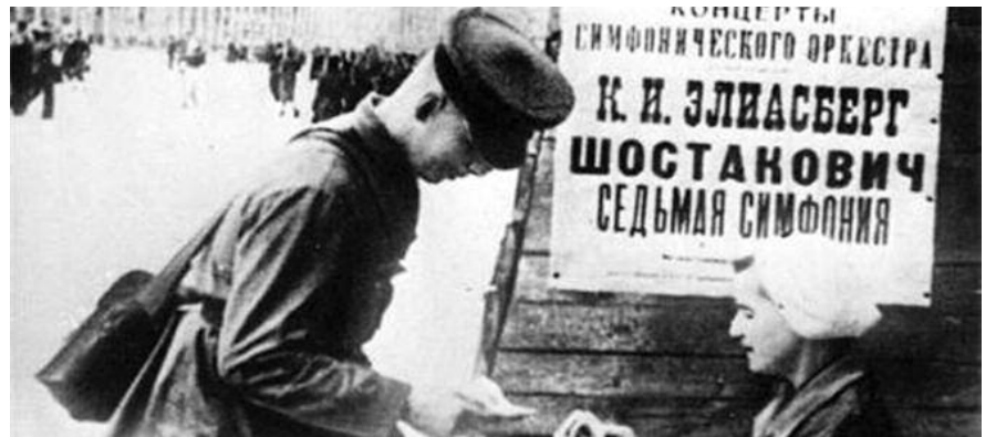
● НА ФОТО: ПРОДАЖА БИЛЕТОВ НА ПРЕМЬЕРУ СЕДЬМОЙ СИМФОНИИ ШОСТАКОВИЧА. 1942 ГОД

отверженности, достойной настоящего советского патриотизма, чтобы обеспечить победу над врагом. Наше дело правое. Враг будет разбит. Победа будет за нами».