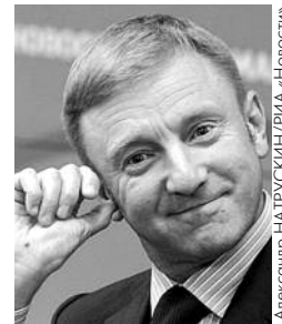
● НА ФОТО: НОВЫЙ ХУЖЕ СТАРОГО?

Дмитрий ЛИВАНОВ , возглавивший Министерство образования, видимо, решил переключить своего предшественника Фурсенко , приступив к кардинальному реформированию учебной программы. Новый образовательный стандарт для 10-11 классов исключает из обязательной программы естественнонаучные дисциплины.