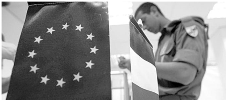
● НА ФОТО: ЛЕВЫЕ ПАРТИИ ВО ГЛАВЕ С СОЦИАЛИСТАМИ НАБРАЛИ 46,3% ГОЛОСОВ

В ходе двух туров голосования избирателям предстоит выбрать 577 депутатов из 6 тысяч 600 кандидатов. В среднем на один