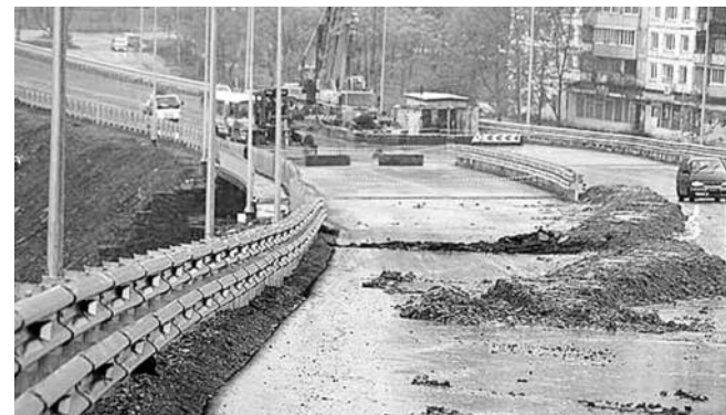
● НА ФОТО: ТРАССА СЕДАНКА-ПАТРОКЛ ДАЛА ТРЕЩИНУ