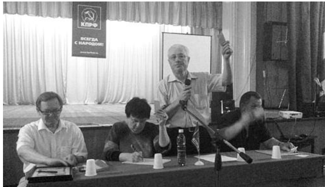
● НА ФОТО: ИДЕТ ГОЛОСОВАНИЕ. КОНФЕРЕНЦИЯ ДЗЕРЖИНСКОГО РК

— Объемы подписки, к сожалению, снизились. Принятые недавно коммунисты еще не включились в работу. По норме каждый коммунист должен подписать на партийную газету по 4 человека. Секретарям первичных отделений необходимо научить этой работе вступивших в партию.