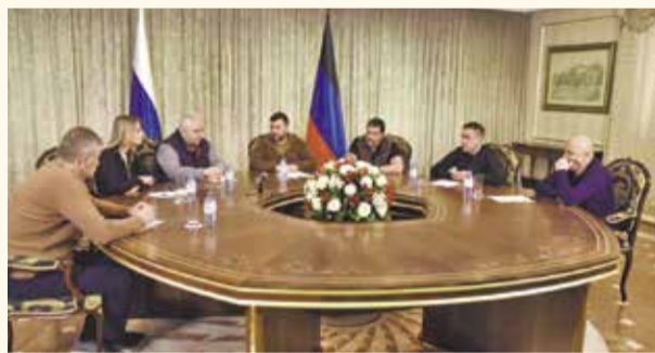
НА ФОТО: КОММУНИСТЫ С ГЛАВОЙ ДНР ДЕНИСОМ ПУШИЛИНЫМ