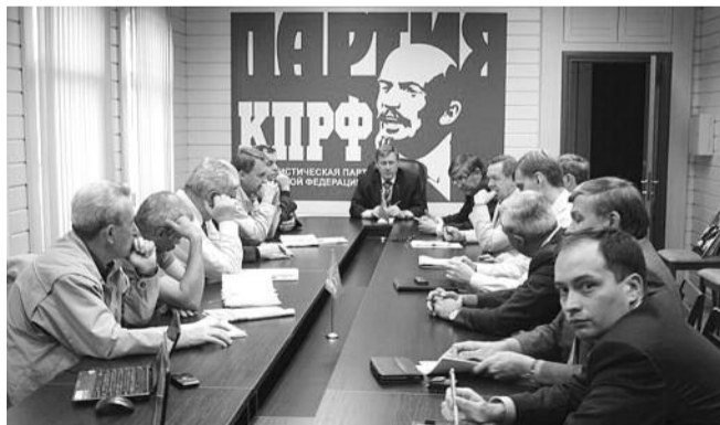
● НА ФОТО: СОВЕЩАНИЕ ДЕПУТАТОВ-КОММУНИСТОВ В ОК КПРФ

— Для нас важно, чтобы депутаты фракций КПРФ вели постоянную работу на своих округах, — отметил Анатолий Локоть. — Это работа не должна останавливаться и во время избирательной кампании, наоборот, она должна активизироваться.