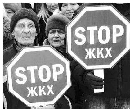
● НА ФОТО: СТОП, ТАРИФЫ

выросли в два раза. Динамика роста цен на эти услуги опережает рост доходов населения. При этом кризисная волна в мировой экономике накатывается с новой силой. Не избежать удара и Российской Федерации, а это значит, что продолжится падение реальных доходов населения, в этих условиях повышение цен и тарифов вызывает справедливое возмущение граждан.