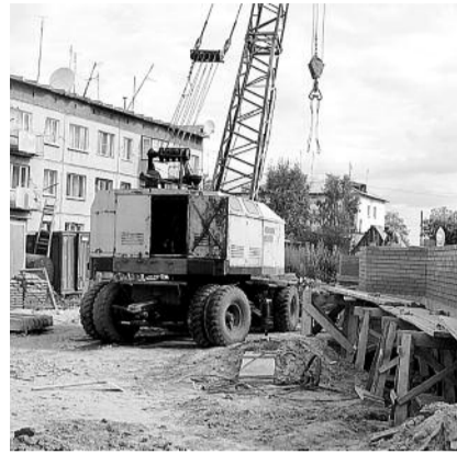
● НА ФОТО: А ИЗ НАШЕГО ОКНА СТРОЙПЛОЩАДКА ВИДНА

Участок земли перед домом №9а местные жители в свое время получили в пользование под огороды. Им тогда объяснили, что под строительство эта земля не годится — по СНиПам не проходит, и слишком от железной дороги близко. Да и по форме участок неудачный — параллельно уже