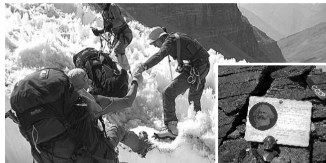
● НА ФОТО: АЛЬПИНИСТЫ УСТАНОВИЛИ БЮСТ МАРКСА НА ВЕРШИНЕ

В Академгородок вернулась команда горных туристов Новосибирского государственного университета. Как и два года назад, она вновь побывала на высшей точке Шахдарьинского хребта (пик Маркса, 6726 м, Юго-Западный Памир). В 2009 году спортсмены, впервые совершив восхождение на пик, установили мемориальную табличку в честь выдающегося философа и мыслителя Карла МАРКСА .