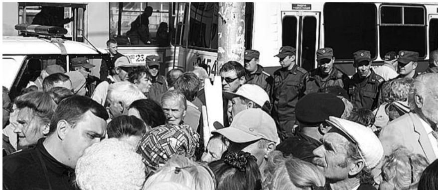
● НА ФОТО: ПОЛИЦЕЙСКИЕ СИЛОЙ НЕ ДАЛИ ПЕНСИОНЕРАМ ЗАВЕРШИТЬ ШЕСТВИЕ

За последние годы ежегодно в России и в Новосибирской области повышались тарифы на электроэнергию, горячую и холодную воду, отопление, постоянно растет плата за содержание жилья. Это стало уже привычным явлением для нашего региона. В Новосибирской области за последние пять лет тарифы на коммунальные услуги