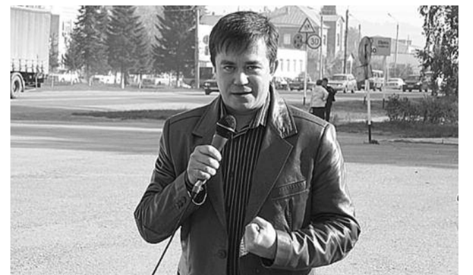
● НА ФОТО: ВЫСТУПАЕТ ДЕПУТАТ ЗАКСОБРАНИЯ АНДРЕЙ ЖИРНОВ