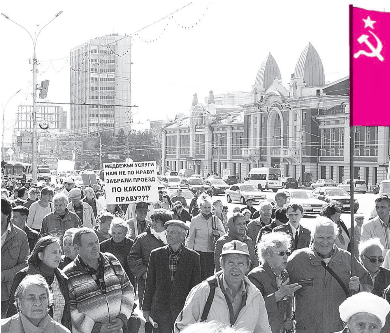
● НА ФОТО: ОЧЕРЕДНАЯ АКЦИЯ ПРОТЕСТА СОСТОЯЛАСЬ 15 СЕНТЯБРЯ