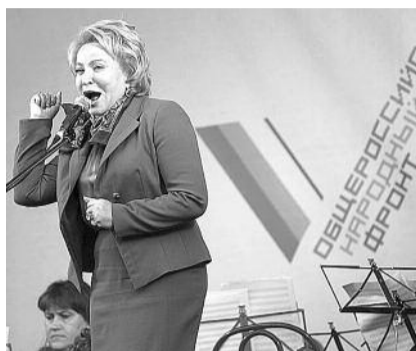
■ НА ФОТО: СПИКЕР СОВФЕДА МАТВИЕНКО

словам, «если сенаторы и далее будут работать под угрозой дамоклова меча увольнения из-за колебаний региональной конъюнктуры, то нам сложно будет сохранить нынешний профессиональный состав и обеспечить надлежащее качество исполнения конституционных полномочий».