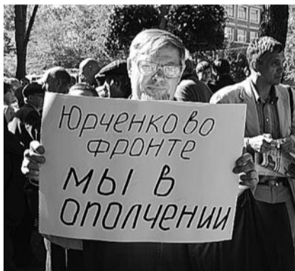
● НА ФОТО: КАЖДОМУ СВОЕ

В 12:00 около 300 новосибирцев собрались перед зданием администрации Новосибирской области, где состоялся митинг. Протестующие требовали вернуть безлимитный проезд пенсионерам. На митинге выступила секретарь Центрального райко-