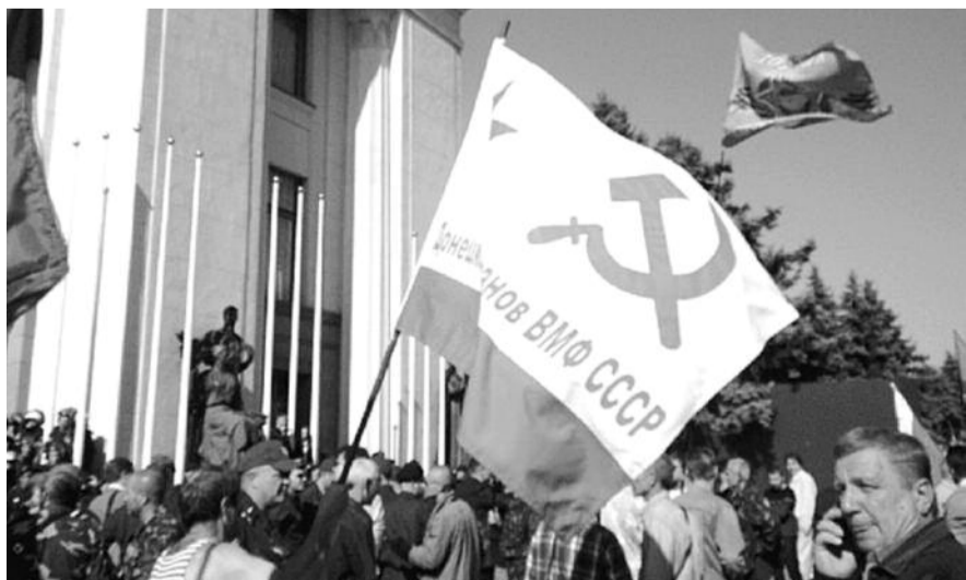
■ НА ФОТО: УКРАИНСКИЕ «АФГАНЦЫ» ВЗЯЛИ ВЕРХОВНУЮ РАДУ ШТУРМОМ

По материалу агентства «СВОБОДНАЯ ПРЕССА»