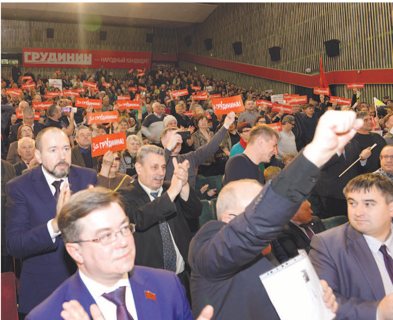
НА ФОТО: БОЛЕЕ ДВУХСОТ ТЫСЯЧ НОВОСИБИРЦЕВ ОТДАЛИ 18 МАРТА СВОЙ ГОЛОС ЗА ПАВЛА ГРУДИНИНА