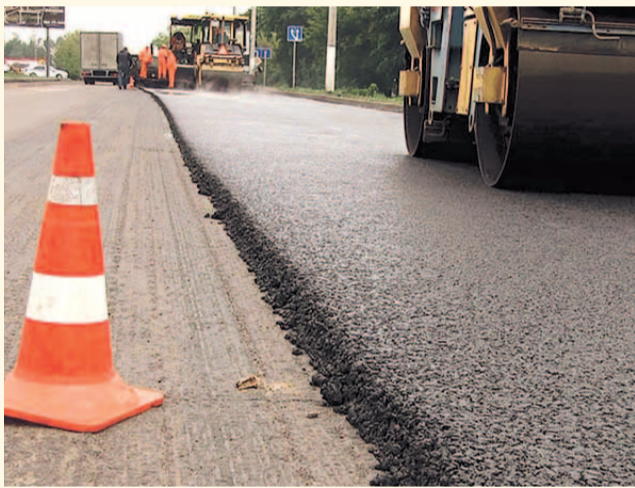
НА ФОТО: ГОРОДСКИЕ ДОРОГИ ОБНОВЯТ