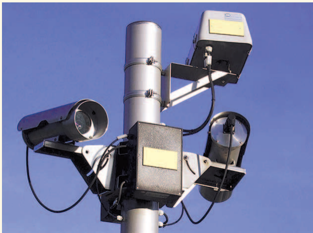
НА ФОТО: НОВОСИБИРЦЫ ЧУВСТВУЮТ СЕБЯ В БЕЗОПАСНОСТИ