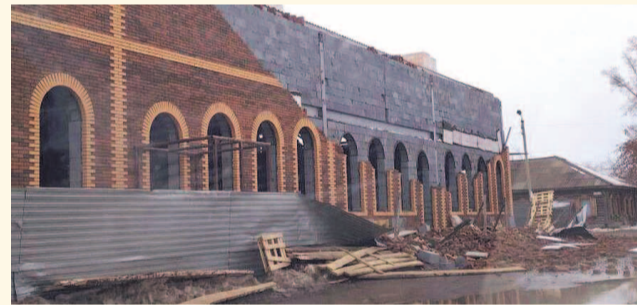
НА ФОТО: ОБРУШИВШАЯСЯ СТЕНА БУДУЩЕГО ЗАГСА