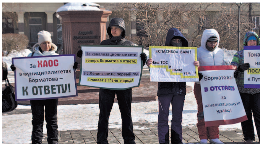
НА ФОТО: ОБЩЕСТВЕННИКИ И АКТИВИСТЫ ВЫРАЗИЛИ НЕДОВЕРИЕ ГЛАВЕ РАЙОНА

Жителей района активно поддерживают депутаты от оппозиции в Новосибирском районном Совете, в первую очередь от фракции КПРФ, уже неоднократно поднимавшие острые вопросы относительно истинного положения дел в районе.