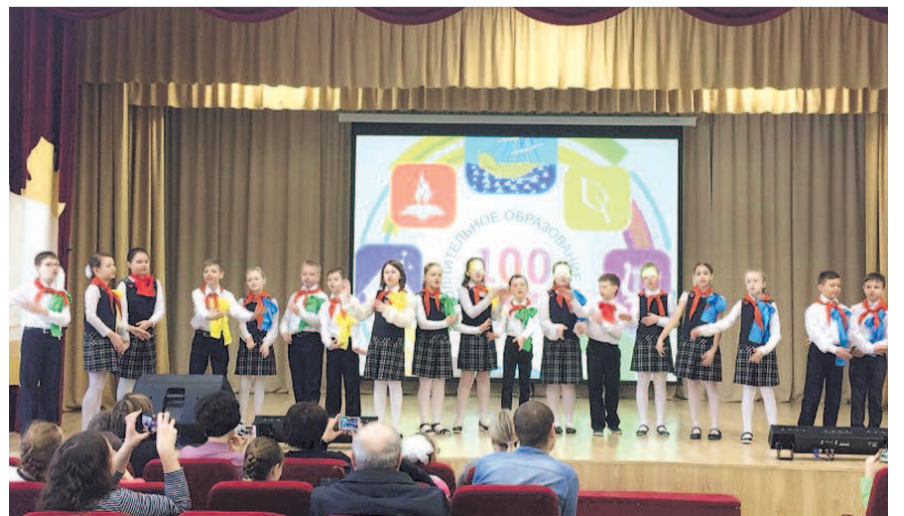
НА ФОТО: НА СЦЕНЕ — ПИОНЕРЫ, УЧАСТНИКИ КОНКУРСА