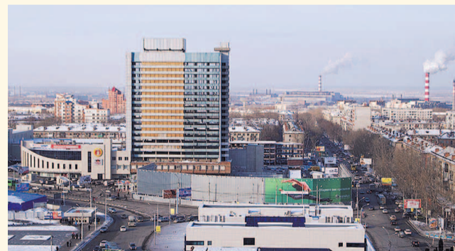
НА ФОТО: ИСТОРИЧЕСКИЙ ДОЛГОСТРОЙ

Закончить знаменитый долгострой на площади Маркса вызвался некий потенциальный инвестор.