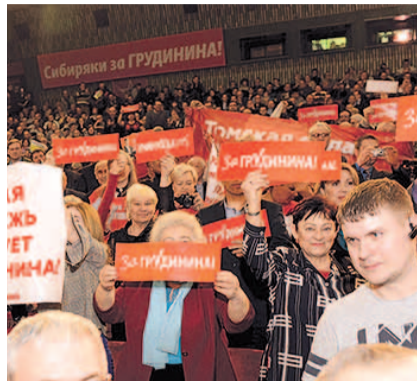
НА ФОТО: СИБИРЯКИ — ЗА ГРУДИНИНА!