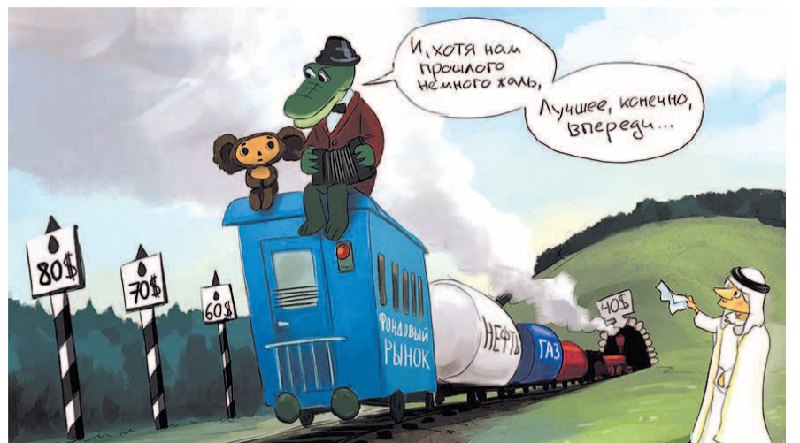
НА ФОТО: БУДУЩЕЕ — ЗА ЦИФРОВОЙ ЭКОНОМИКОЙ. НО ЧТО ЭТО БУДУТ ЗА ЦИФРЫ?

Все участковые комиссии Советского района получили Реестры избирателей, которые должны были быть исключенными из списков избирателей.