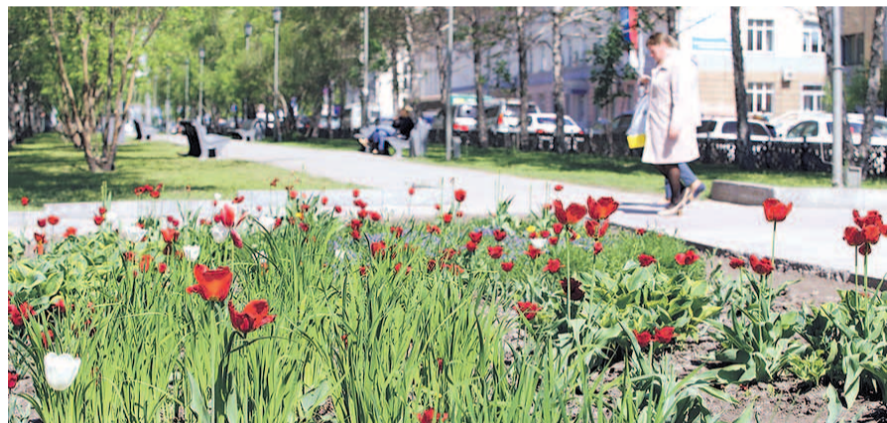
НА ФОТО: «ЗЕЛЕНЫЙ» ГОРОД — ПЕРСПЕКТИВА РАЗВИТИЯ НОВОСИБИРСКА