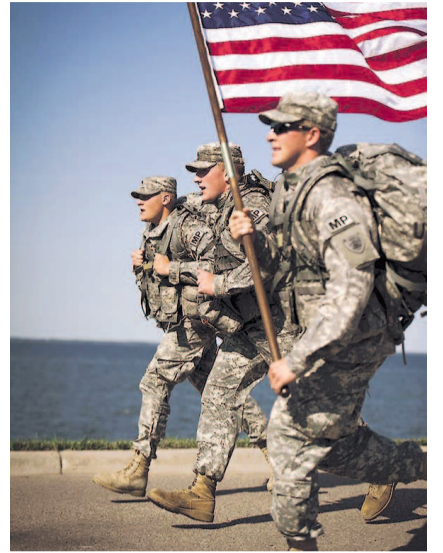
НА ФОТО: ПОСЛЫ ДЕМОКРАТИИ И МИРА ВО ВСЕМ МИРЕ

Однако так ли слепо и безоговорочно действовал Михаил Горбачев? Отнюдь. Скорее — безответственно и наивно. Гарантии о нерасширении НАТО на Восток советский генсек по-