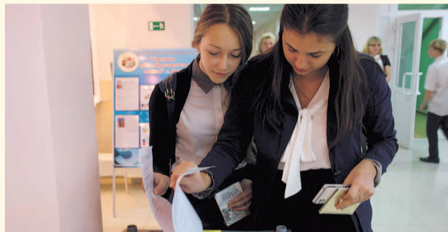
НА ФОТО: ГОЛОСУЮТ СТУДЕНТЫ