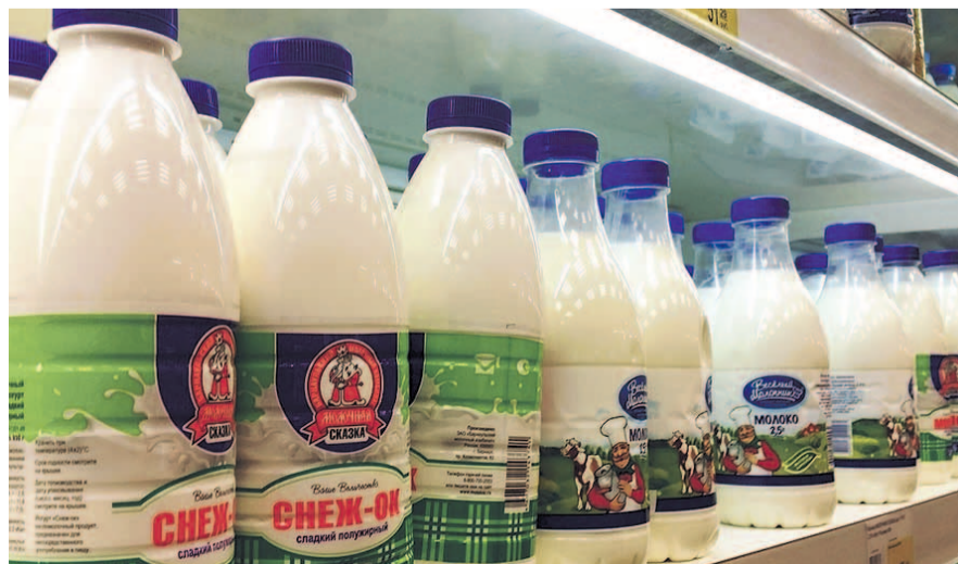
НА ФОТО: ДЕФИЦИТ МОЛОКА КОМПЕНСИРУЕТСЯ ИМПОРТОМ СЫРЬЯ