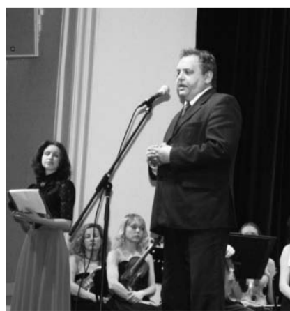
НА ФОТО: ПОЗДРАВЛЕНИЕ ВЕТЕРАНАМ