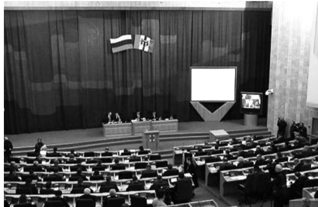
НА ФОТО: ИДЕТ РАБОТА СЕССИИ ЗАКСОБРАНИЯ

Пятнадцатипроцентный рубеж преодолел объем дефицита бюджета Новосибирской области. Депутаты стараются перераспределить средства так, чтобы не пострадали уже начавшиеся проекты и срезать там, где это возможно, без катастрофических последствий для региона. Поправки в главный финансовый документ региона будут внесены на ближайшей сессии, которая состоится в среду 7 мая.