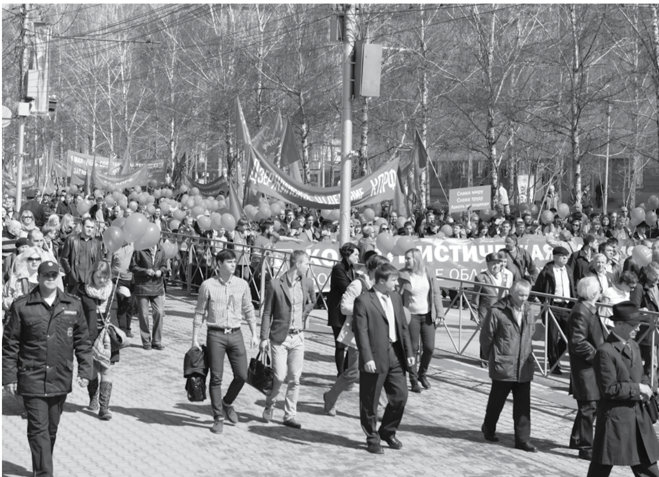
НА ФОТО: К ШЕСТВИЮ КРАСНОЗНАМЕННОЙ КОЛОННЫ ЧАСТО ПРИСОЕДИНЯЛИСЬ И СЛУЧАЙНЫЕ ПРОХОЖИЕ