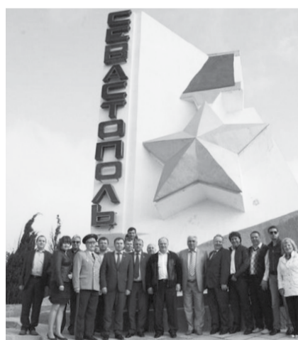
НА ФОТО: У СТЕЛЫ ГОРОДА-ГЕРОЯ

Коммунистов и всех честных людей не могут оставить равнодушными события, происходящие сегодня на Украине. Власть в братской республике захватила кровавая хунта, которая убивает собственный народ. Подтверждением этому стала одесская