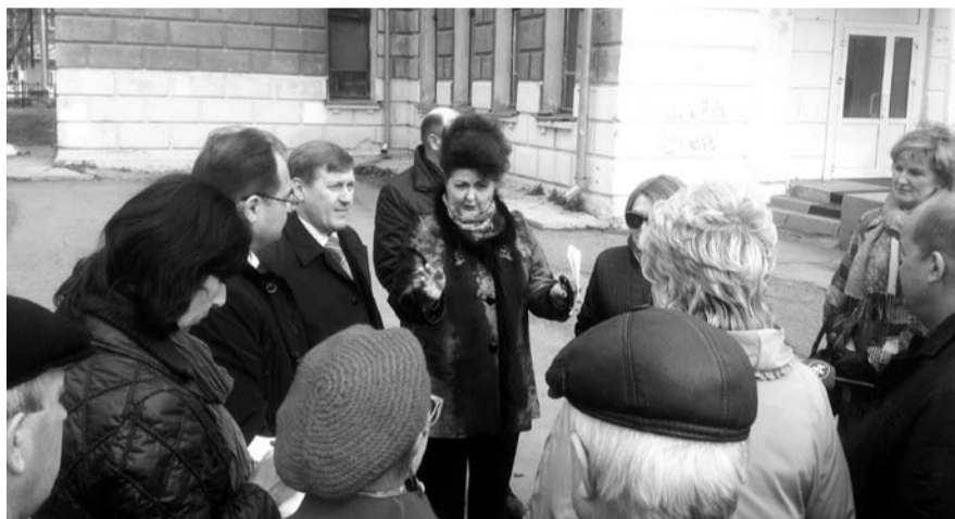
НА ФОТО: НА ВСТРЕЧЕ В ДЗЕРЖИНСКОМ РАЙОНЕ