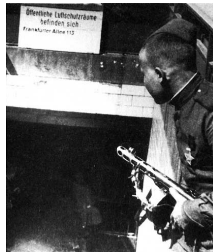
НА ФОТО: БОИ ШЛИ НА ЗЕМЛЕ И ПОД ЗЕМЛЕЙ

Ожесточенный бой в Берлине продолжался. Он шел на улицах и в переулках, в воздухе, на земле и под землей — в берлинском метро. Столица рейха была в огне. Город, где была задумана война, лежал перед Красной Армией. Город, который осенью 1941 года с часу на час ждал сообщения о взятии Москвы. А до этого ликовал по поводу падения многих европейских столиц.