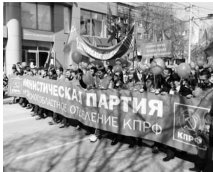
НА ФОТО: МОЛОДЕЖЬ В ПЕРВЫХ РЯДАХ

пенсий, стипендий, социальных пособий, рост потребительских цен на товары и услуги первой необходимости не позволяет значительно улучшить уровень жизни наших граждан. Поэтому Первомай еще не стал праздником труда. Федерация профсоюзов Новосибирской области, профсоюзы всей страны напоминают, что в Статье 7 действующей Конституции РФ содержится правовая норма о том, что «Россия — это социальное государство, политика которого направлена на создание условий, обеспечивающих достойную жизнь и свободное развитие человека». Однако и правительство страны, и правительство Новосибирской области еще слабо занимаются развитием экономики. Поэтому мы призываем все политические силы, органы государственной власти всех уровней, органы местного самоуправления прекратить врать, вести пустые разговоры — давайте работать, давайте вернем уважение к труду. Мы за достойный труд, справедливую заработную плату, стабильную занятость!