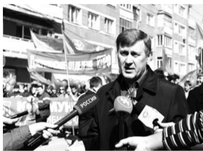
НА ФОТО: МЭР — ВПЕРЕДИ КОЛОННЫ