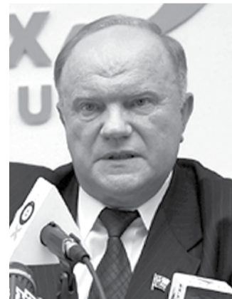
Председатель ЦК КПРФ Геннадий ЗЮГАНОВ

С Праздником Вас, дорогие товарищи! С Днем Победы!