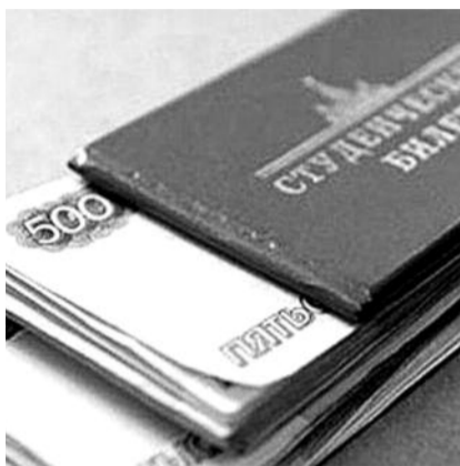
■ НА ФОТО: ОБРАЗОВАНИЕ КАК СФЕРА УСЛУГ

Запланировано сокращение бюджетных мест для студентов вузов, сокращаются