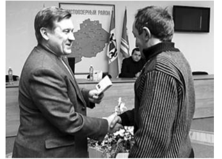
● НА ФОТО: ПАРТИЙНЫЕ РЯДЫ РАСТУТ!

В Татарске депутаты-коммунисты сделали его жителям приятный подарок в виде оргтехники для местной библиотеки, чтобы облегчить работу с читателями, которых здесь немало.