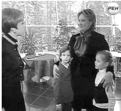
■ НА ФОТО: КАДР ИЗ ИНТЕРВЬЮ НА «РЕН-ТВ»

Экс-министр сельского хозяйства Елена СКРЫННИК в очередной раз ответила на обвинения создателей фильма «Власть имущие» в хищении 39 млрд. рублей в корпорации «Росагролизинг». В интервью каналу РЕН-ТВ Скрынник не сдерживая слез, заявила, что не покинет Россию, ответит на все вопросы следствия, хотя уже сейчас с трудом отвечает на вопросы собственных детей.