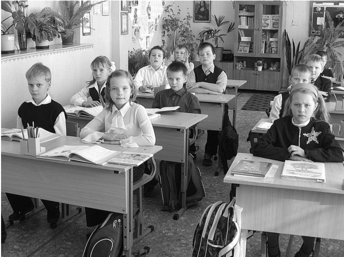
● НА ФОТО: ЗАКОН «ОБ ОБРАЗОВАНИИ» В ТАКОМ ВИДЕ ДАЕТ ВОЗМОЖНОСТЬ СДЕЛАТЬ СРЕДНЕЕ ОБРАЗОВАНИЕ В РОССИИ ПОЛНОСТЬЮ ПЛАТНЫМ