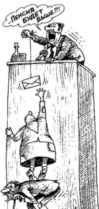
● НА РИС.: ДО ОБЕЩАНИЙ НЕ ДОТЯНУТЬСЯ

картинка Валентина ДУБИНИНА «Пенсия»/спасибо.ру