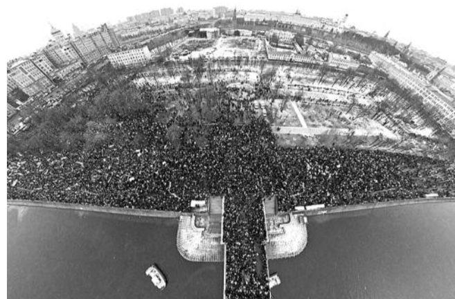
● НА ФОТО: НА КАРТЕ ГОРОДА ХОТЯТ ОТМЕТИТЬ «МЕСТА ДЛЯ ПРОТЕСТА»

Состоялось заседание оргкомитета «За честные выборы!», в ходе которого представители оппозиционных политических партий, общественных организаций, а также гражданские активисты подписали обращение к депутатам Законодательного собрания Новосибирской области с требованием не поддерживать законопроект «О порядке подачи уведомления о проведении публичного мероприятия» как ущемляющий гражданские права.