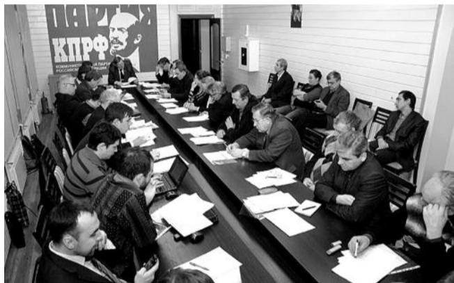
■ НА ФОТО: ИДЕТ БЮРО ОБЛАСТНОГО КОМИТЕТА КПРФ