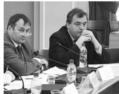
■ НА ФОТО: ЗАСЕДАНИЕ РАБОЧЕЙ ГРУППЫ