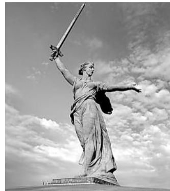
■ КАКИЕ ЕЩЕ НУЖНЫ СИМВОЛЫ?

Волгоградские чиновники, которым в голову пришла мысль сменить символ города — «Родину-Мать» на современный торговый и туристический бренд, заплатили за излишнюю инициативность. Как передает «Русская служба новостей», чиновники мэрии, ответственные