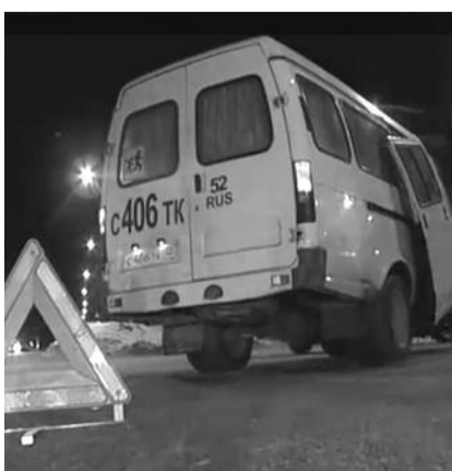
● НА ФОТО: «ГАЗЕЛЬ» ПРЕТКНОВЕНИЯ