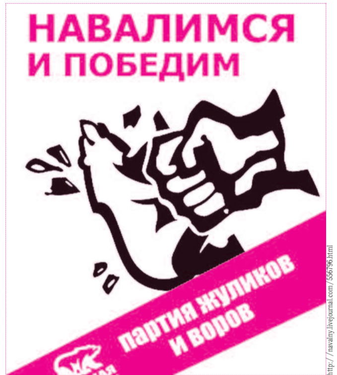
■ НА РИС.: НАРОД ПРОТИВ!

К дискуссии предпринимателей в интернет-сфере подключились пенсионеры и рабочие, которые выказали свое согласие с анти-