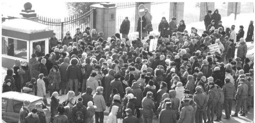
● НА ФОТО: ПЕРЕД РЕЗИДЕНЦИЕЙ ПОЛПРЕДА ПРЕЗИДЕНТА СОСТОЯЛСЯ ПИКЕТ