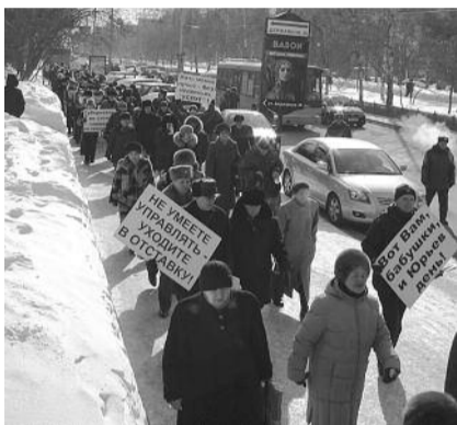
● НА ФОТО: ШЕСТЬ ПЕНСИОНЕРОВ ПО КРАСНОМУ ПРОСПЕКТУ В ЗАЩИТУ ЛЬГОТ

Прибыв к зданию полпреда, митингующие отправили для встречи с Виктором Толоконским небольшую делегацию.