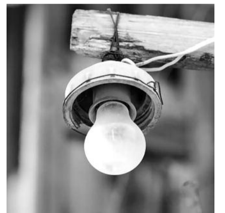
■ НА ФОТО: КАК СДЕРЖАТЬ РОСТ ТАРИФОВ?

Совокупно такая «экономия» должна привести к сокращению доходов энергокомпаний на 19 млрд. рублей. В числе других мер были названы сокращение инвестирующей для ГЭС и АЭС, а также