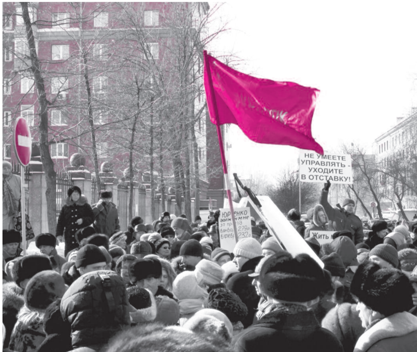
● НА ФОТО: НЕ ДОЖДАВШИСЬ «ВЫХОДА В НАРОД» ВЫСОКОПОСТАВЛЕННЫХ ЧИНОВНИКОВ ПРАВИТЕЛЬСТВА НОВОСИБИРСКОЙ ОБЛАСТИ, МИТИНГУЮЩИЕ ПЕРЕМЕСТИЛИСЬ К РЕЗИДЕНЦИИ ПОЛНОМОЧНОГО ПРЕДСТАВИТЕЛЯ ПРЕЗИДЕНТА В СИБИРСКОМ ФЕДЕРАЛЬНОМ ОКРУГЕ