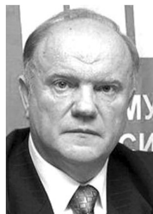
● НА ФОТО: ЛИДЕР КПРФ

Лидер КПРФ Геннадий ЗЮГАНОВ выступил с критикой «Единой России» в связи с состоявшейся на канале ВГТРК «Россия 24» трехчасовой трансляции конференции партии с участием ее лидера Владимира ПУТИНА . По мнению господина Зюганова, «Единая Россия» использовала административный ресурс накануне выборов, которые пройдут 13 марта в 70 регионах страны. Обвинения ЦИК в пособничестве партии власти звучат и от других партий. В ЦИКе от комментариев воздерживаются.