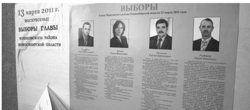
■ НА ФОТО: 13 МАРТА СДЕЛАЕМ ПРАВИЛЬНЫЙ ВЫБОР!

когда сдавала документы для регистрации. Она и не рассчитывает работать главой нашего района.