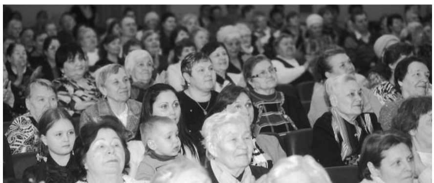
● НА ФОТО: ЗАЛ ДК «ЭНЕРГИЯ» БЫЛ ЗАПОЛНЕН ДО ОТКАЗА