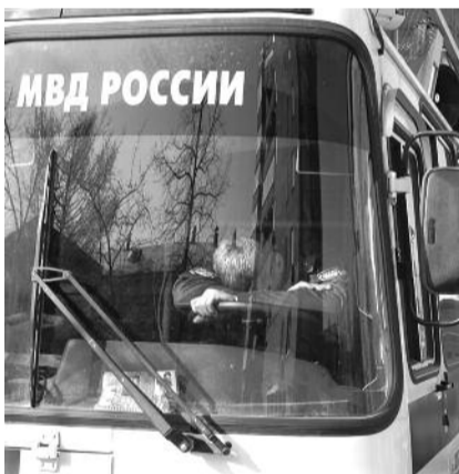
● НА ФОТО: НА ПОСТУ...

И, в-третьих, не эти ли «пострадавшие» ранее вели за коммунистами наружное наблюдение, прокололи колеса их машины, распространяли среди жителей Арзамаса фальсифицированные «партий власти» газеты от имени КПРФ? Или это были другие птенцы того же «единороссовского гнезда»?