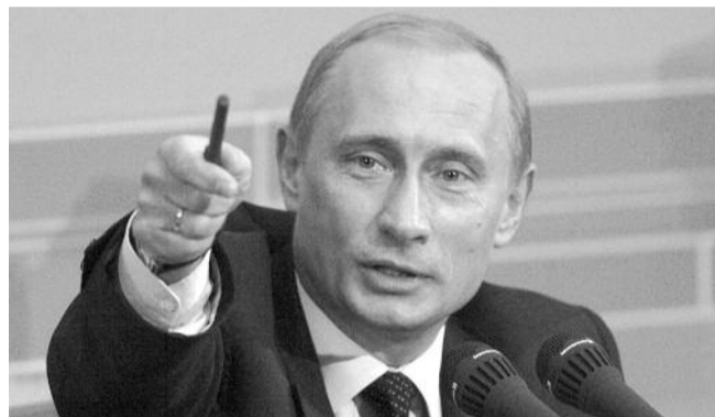
● НА ФОТО: ИМ ВСЕ МОЖНО?

Это не первый инцидент подобной агитации с участием Владимира ПУТИНА . На выборах в Госдуму в октябре 2007 года господин Путин провел прямую линию общения с гражданами, которая транслировалась всеми федеральными каналами. На ней господину Путину был задан вопрос, почему он решил возглавить федеральный список «Единой России». Ответ на него в КПРФ и СПС посчитали незаконной агитацией. Однако, несмотря на жалобы в ЦИК и обращение в Верховный суд, «Единая Россия» осталась безнаказанной.