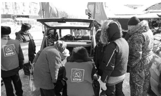
■ НА ФОТО: ГОЛОСОВАНИЕ ПО НАРОДНОМУ РЕФЕРЕНДУМУ

В Первомайском районе возле микрорайона «Переходной мост» прошел пикет, организованный районным комитетом КПРФ. Одновременно проводилось голосование жителей Первомайки по вопросам Народного референдума. Проголосовало более 50 человек.