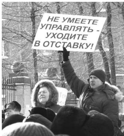
● НА ФОТО: ПЕНСИОНЕРЫ СКАНДИРОВАЛИ: «ДОЛОЙ «ЕДИНУЮ РОССИЮ»»

Во-вторых, в сообщении «скромно» умалчивается о том, что «пассажиры», судьба которых так взволновала нашу «ответственную за все «Единую Россию», все как один были в масках, и почему-то с применением физической силы пытались отобрать у активистов КПРФ распространяемые ими агитационные материалы.