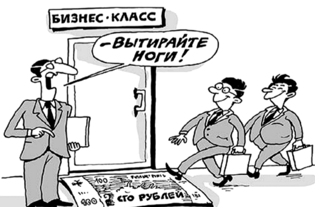
НА РИС.: ДОБРО ПОЖАЛОВАТЬ В ШКОЛУ, БИЗНЕС-УЧЕНИКИ!

Карикатура Константина Малышева / Caricatura.ru