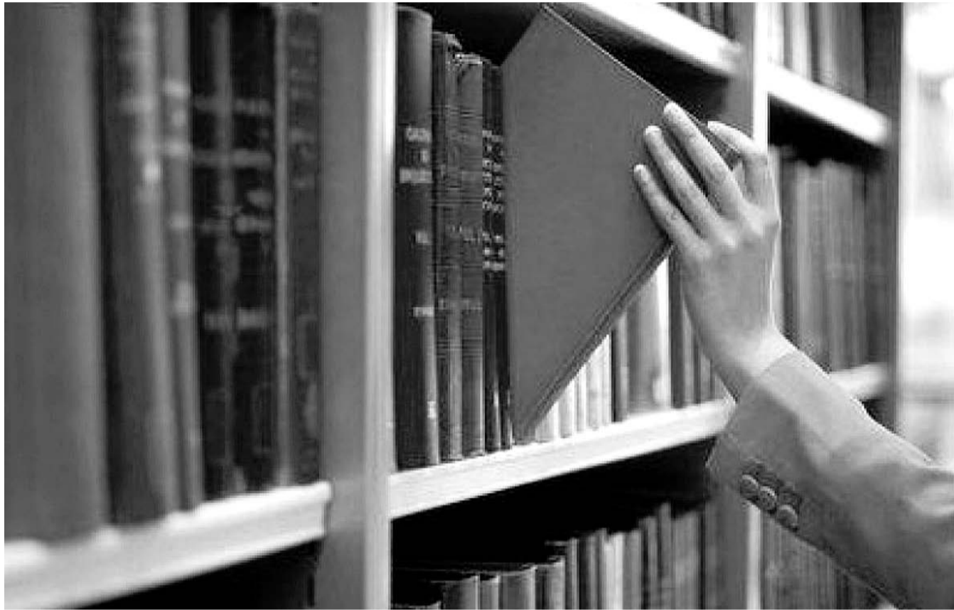
НА ФОТО: ИЗ ШКОЛЬНОЙ ПРОГРАММЫ ПРЕДЛАГАЕТСЯ УБРАТЬ, К ПРИМЕРУ, ОСТРОВСКОГО, НЕКРАСОВА, ДОСТОЕВСКОГО, ТУРГЕНЕВА...