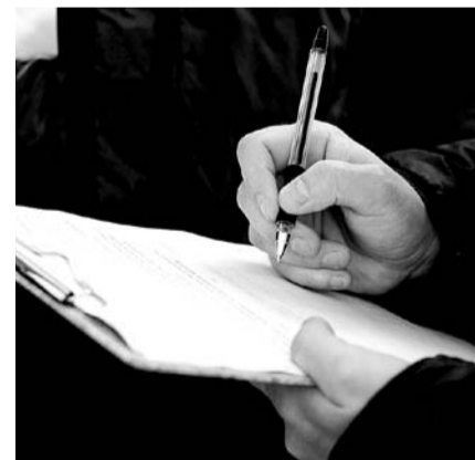
НА ФОТО: ПРЕЗИДЕНТ УДЛИНИЛ ПУТЬ ИНИЦИАТИВЫ ОТ НАРОДА ДО СЕБЯ

ление вылились выборы в Координационный совет оппозиции.