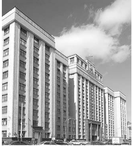
НА ФОТО: ГОСДУМУ МОГУТ РАСПУСТИТЬ РАДИ РЕЙТИНГА ПУТИНА?

«Единую Россию» сливает мощная экспертная группа