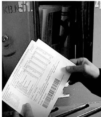
НА ФОТО: ЦИФРЫ В ПЛАТЕЖКАХ ВСЕ БОЛЬШЕ

О проделанной работе руководители Федеральной службы по тарифам, Минрегиона и Минэкономразвития должны будут доложить до 10 апреля и представить согласованный доклад в правительство. Кроме того, Медведев поручил губернаторам отчитаться о