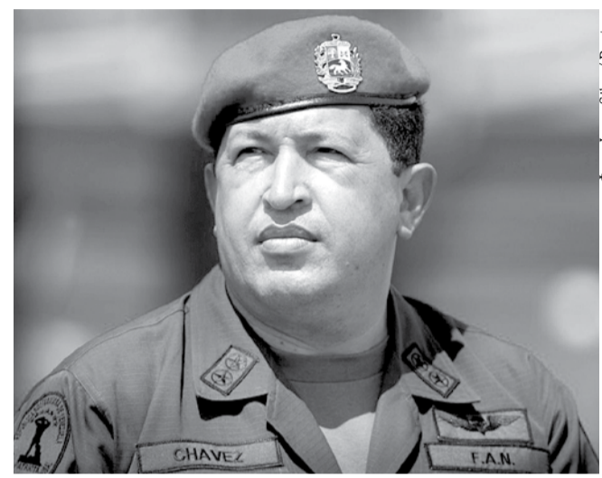
НА ФОТО: УГО ЧАВЕС — АВТОР «ЛЕВОГО ПОВОРОТА» ВЕНЕСУЭЛЫ

Новосибирские коммунисты направили соболезнования вице-президенту Боливарианской Республики Венесуэла Николасу Мадуро . Смерть президента Венесуэлы Уго Чавеса потрясла всех прогрессивных людей. Коммунисты Новосибирской области вместе с венесуэльским народом скорбят по поводу этой безвременной утраты.