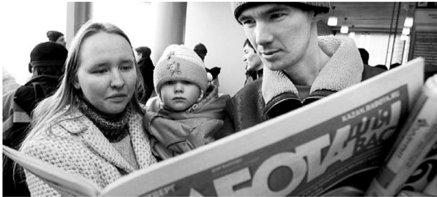
НА ФОТО: В НОВОСИБИРСКЕ 5,5 ТЫСЯЧИ ОФИЦИАЛЬНЫХ БЕЗРАБОТНЫХ

ки этих специалистов никто не давал. В конце концов несколько выпусков подряд столь масштабного количества специалистов означенных профессий, привело к тому, что их оказалось некуда девать в плане трудоустройства. Например, к нам, депутатам, часто обращаются психологи с просьбой о содействии в трудоустройстве. Их готовили для работы в учебных заведениях, которые к моменту выпуска оказались уже полностью укомплектованы психологами.