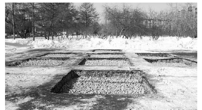
НА ФОТО: В НАРЫМСКОМ СКВЕРЕ УЖЕ ЗАКЛАДЫВАЕТСЯ ФУНДАМЕНТ