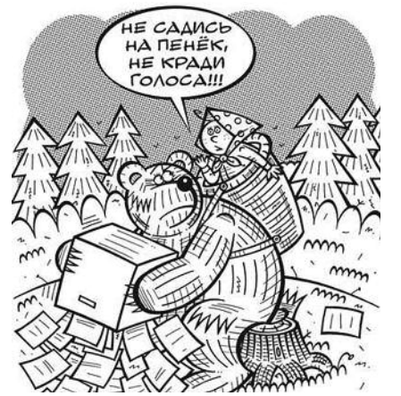
■ НА РИС.: НЕ СЛЫШИТ МЕДВЕДЬ ГЛАС НАРОДА

Пока верстался номер, в редакцию сайта КПРФНск поступила информация о том, что сотрудников ОАО «Новосибирский аффинажный завод» под угрозой увольнения заставляют брать открепительные удостоверения и голосовать за «Единую Россию».