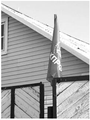
■ НА ФОТО: КРАСНАЯ УБИНКА

Одна из улиц районного центра Убинское в одночасье стало местной достопримечательностью. Над крышами трех домов взметнулись ввысь красные флаги с партийной символикой КПРФ. Вот уже несколько дней они гордо реют на ветру, привлекая внимание всех, кому довелось побывать в этой части населенного пункта.