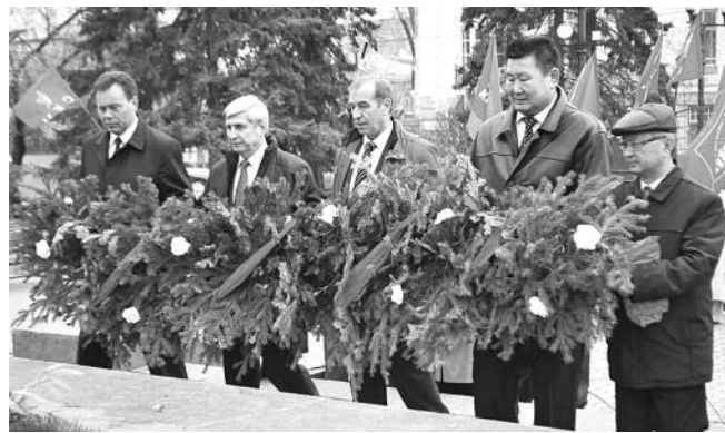
● НА ФОТО: ВОЗЛОЖЕНИЕ ЦВЕТОВ К ПАМЯТНИКУ В.И. ЛЕНИНУ

14-15 октября в Иркутске проходила Всероссийская конференция по развитию Сибири и Дальнего Востока, на которую приехали участники из различных регионов, от Новосибирска до Владивостока. Перед началом конференции ее участники вместе с иркутскими коммунистами провели торжественный митинг и возложили цветы к памятнику В.И. Ленину.