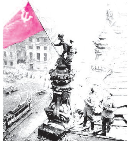
■ НА ФОТО: ЗНАМЯ НАД РЕЙХСТАГОМ

— К сожалению, мы, ветераны, не участвовали в подготовке к мероприятию, —