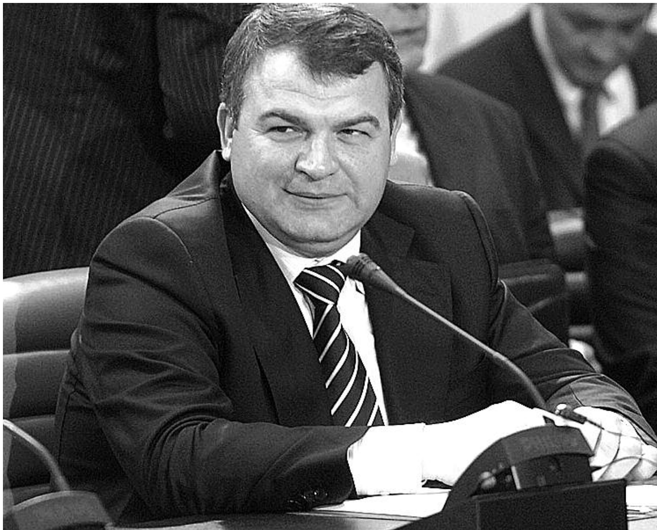
● НА ФОТО: СЕРДЮКОВ ИЗДАЛ УКАЗ...