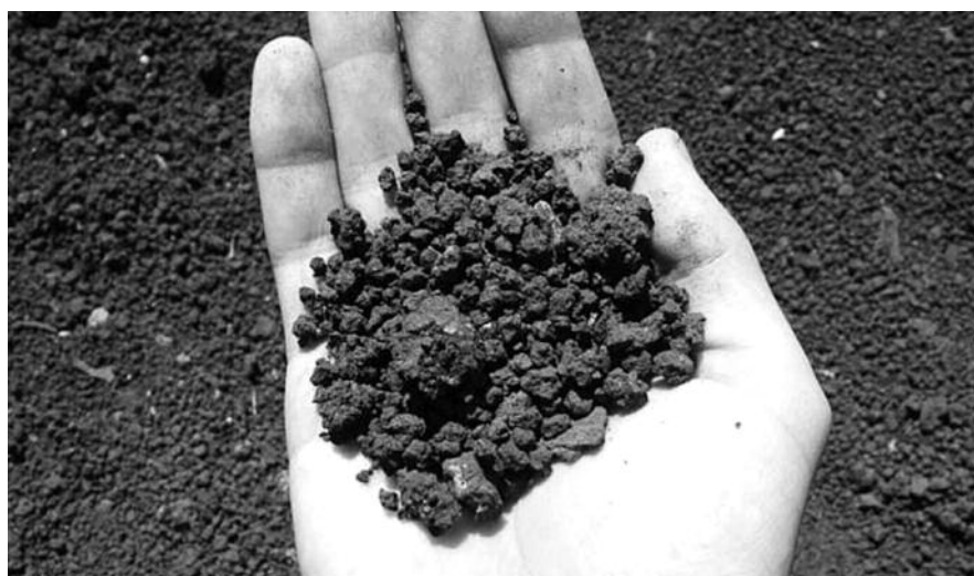
■ НА ФОТО: ДОРОГАЯ ТЫ НАША