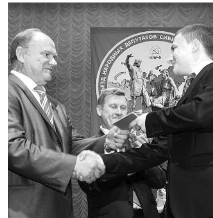
● НА ФОТО: ГЕННАДИЙ ЗОГАНОВ ВРУЧАЕТ ПАРТБИЛЕТ КОММУНИСТУ НА СЪЕЗДЕ ДЕПУТАТОВ СИБИРИ И ДАЛЬНЕГО ВОСТОКА

отделений по обмену опытом и практикой работы в этом направлении.