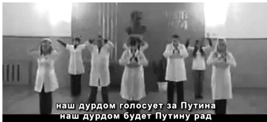
● НА ФОТО: КАДР ИЗ КЛИПА НА ПЕСНЮ ГРУППЫ «РАБФАК»

Рокировка в тандеме вызвала всплеск сатирического творчества в виде карикатур, стихотворений, коллажей и анекдотов. Популярность обрела написанная год назад ироническая песня Андрея МАКАРЕВИЧА «Путин едет в Холуево», по поводу чего в интервью российским агентствам музыкант выражал удивление.