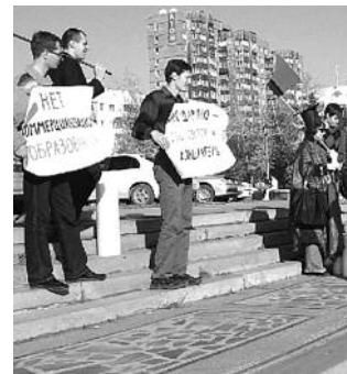
● НА ФОТО: УЧАСТНИКИ МИТИНГА ЗА ДОСТУПНОЕ ОБРАЗОВАНИЕ

В минувшую субботу возле театра «Глобус» состоялся митинг за качественное и доступное образование, организованный Новосибирским отделением РКСМ. Инициативная группа новосибирцев выступила против официального законопроекта «Об образовании» и в поддержку альтернативного закона, подготовленного КППРФ. Перед участниками мероприятия выступили общественные активисты, депутаты-коммунисты Законодательного собрания НСО и Совета депутатов города Новосибирска.