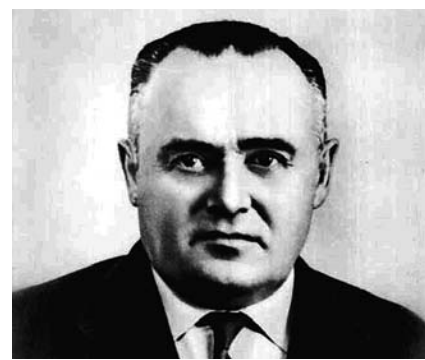
НА ФОТО: СЕРГЕЙ КОРОЛЕВ

В апреле 1947 года в Кремле, у В.И. СТАЛИНА прошло совещание, а после него вождь отдало постановление с Королевым о перспективах создания мощных ракет. Вскоре по предложению и под руководством С.П.Королева был создан Совет глав-