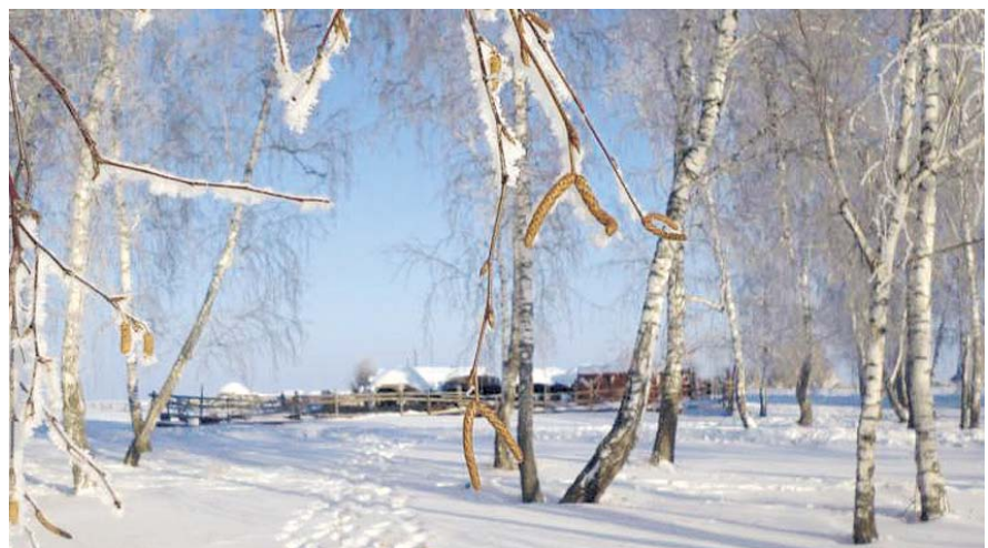
НА ФОТО: КУНДРАНСКИЙ ПЕЙЗАЖ