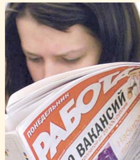
НА ФОТО: ГДЕ НАЙТИ РАБОТУ?

По данным Минтруда Новосибирской области, в наступившем году предполагается рост числа безработных на 3000 человек.