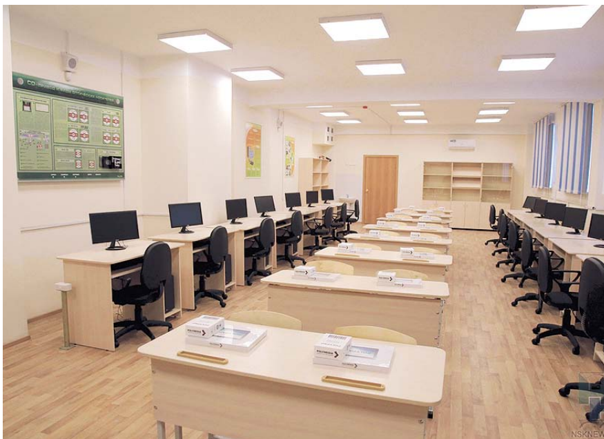
НА ФОТО: ЗАРАБОТАЛА НОВАЯ ШКОЛА №212

В 2017 году в Новосибирске стартует Программа комплексного развития социальной инфраструктуры на 2017-2030 годы. В городе планируется построить 318 объектов.