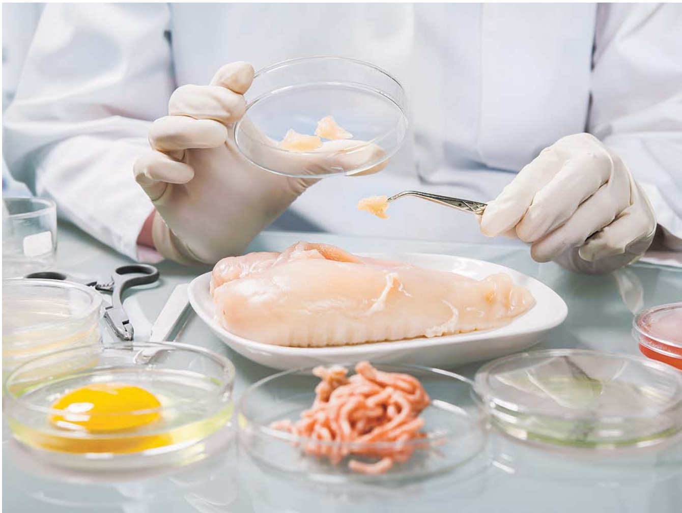
НА ФОТО: АНАЛИЗ ПРОДУКТОВ ПИТАНИЯ ВЫЯВИЛ УДРУЧАЮЩУЮ КАРТИНУ