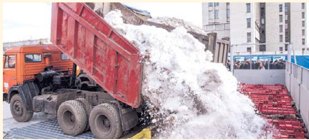
НА ФОТО: СТАНЦИЯ РАБОТАЕТ НА ПОЛНУЮ МОЩНОСТЬ