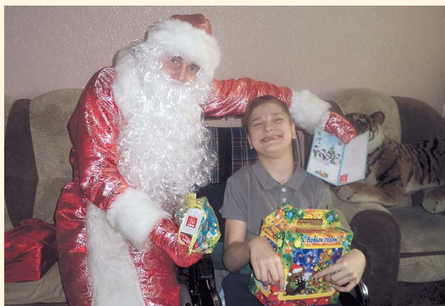
НА ФОТО: ДЕТИ БЫЛИ РАДЫ!