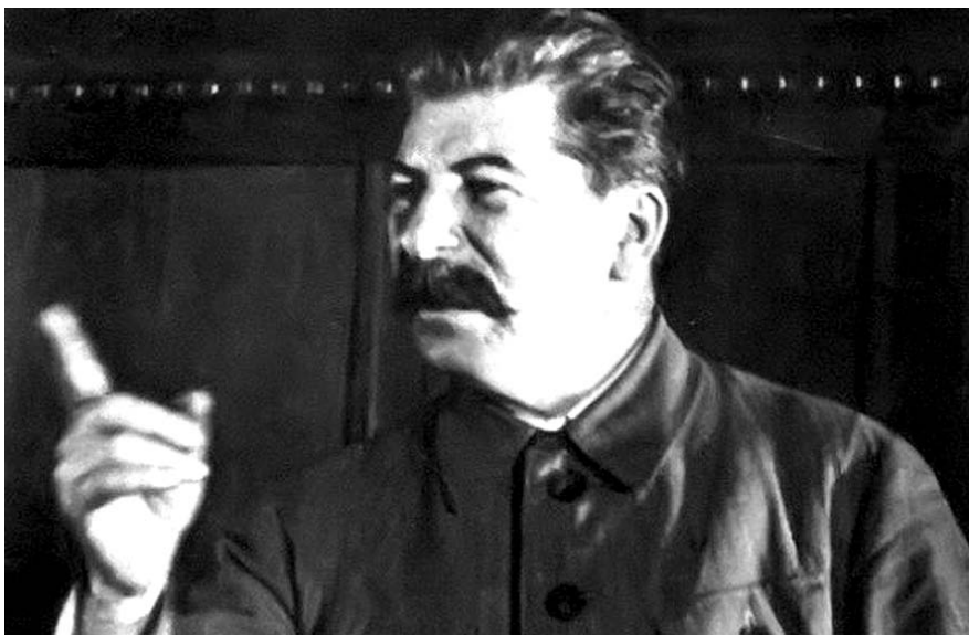
НА ФОТО: ИОСИФ ВИССАРИОНОВИЧ СТАЛИН

Как сообщают исследователи, Сталин выехал из Москвы 15 января 1928 г. и 17 числа прибыл в Новосибирск. Стоит сказать, что Сталин бывал в нашем городе и раньше, правда, что называется, мимоходом, когда в 1912 году возвращался из Нарымской ссылки. Но спустя 16 лет он уже в качестве государственного деятеля посетил Новосибирск для решения одного из главных экономических вопросов того вре-