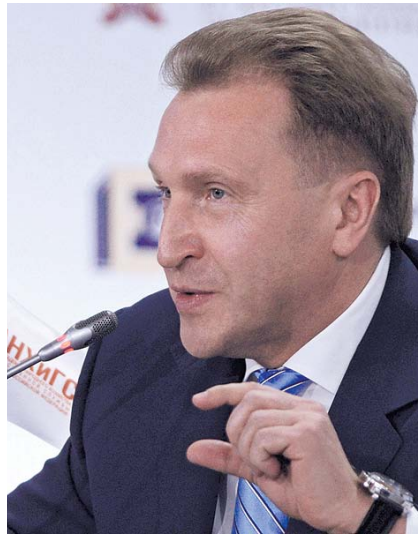
НА ФОТО: ИГОРЬ ШУВАЛОВ

— Нужно рассчитывать лишь на себя. А что заграница? Сегодня тот