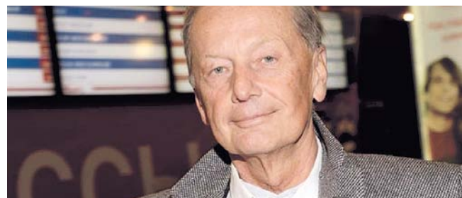
НА ФОТО: МИХАИЛ ЗАДОРНОВ

— Объяснять: не олигарх, а человек труда должен цениться. У Иосифа Виссарионовича не было драгоценностей, яхт, не было коттеджей на Рублевском шоссе. Из личного имущества остались пять трубок да несколько ките-