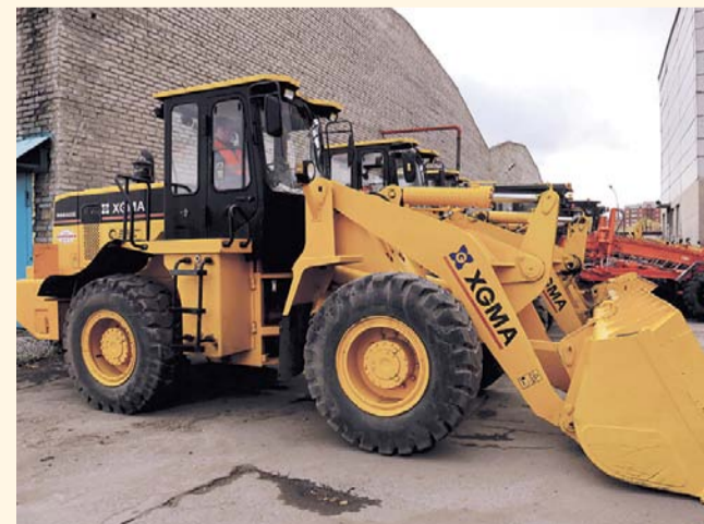
НА ФОТО: СОВРЕМЕННАЯ ТЕХНИКА НА СЛУЖБЕ ГОРОДУ