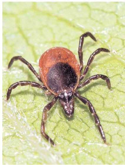
НА ФОТО: ОПАСНЫЕ НАСЕКОМЫЕ АКТИВИЗИРОВАЛИСЬ В НОВОСИБИРСКОЙ ОБЛАСТИ

В Новосибирской области клещи уже укусили почти 2 тысячи человек. Роспотребнадзор назвал самые опасные районы.