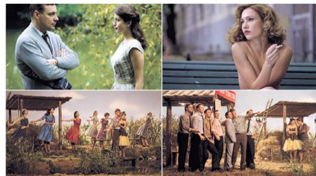
НА ФОТО: КАДРЫ ИЗ СЕРИАЛА

которая даже присниться не может этому, в сущности, простому парню.