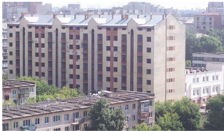
НА ФОТО: ДОЛГОСТРОЙ, КОТОРОМУ БОЛЬШЕ 20 ЛЕТ, НАКОНЕЦ-ТО БУДЕТ СДАН