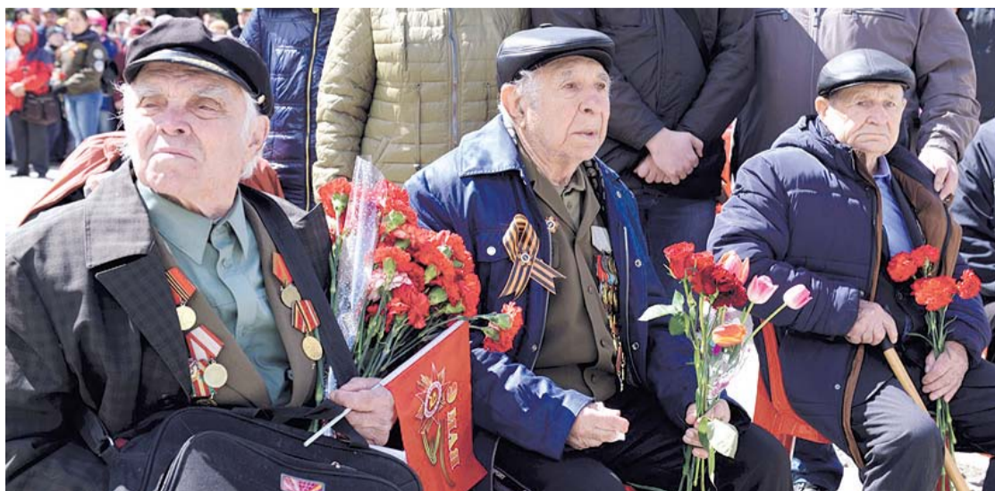
НА ФОТО: ОНИ ЗАВОЕВАЛИ ДЛЯ НАС ЖИЗНЬ И СВОБОДУ