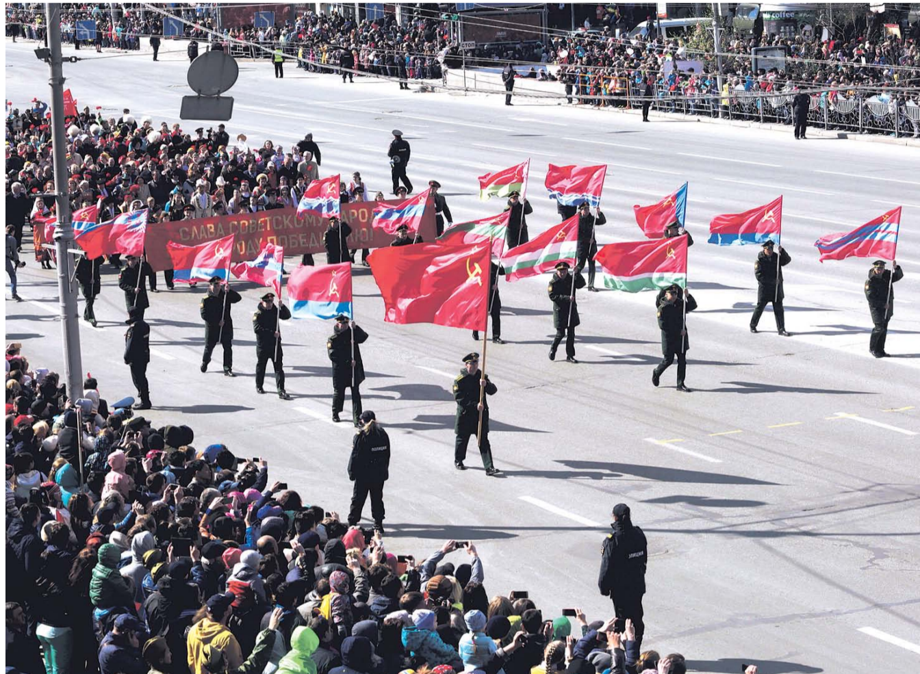
НА ФОТО: КОЛОННУ «БЕССМЕРТНОГО ПОЛКА» ВОЗГЛАВИЛА ЗНАМЕННАЯ ГРУППА С ФЛАГАМИ СССР И СОЮЗНЫХ РЕСПУБЛИК