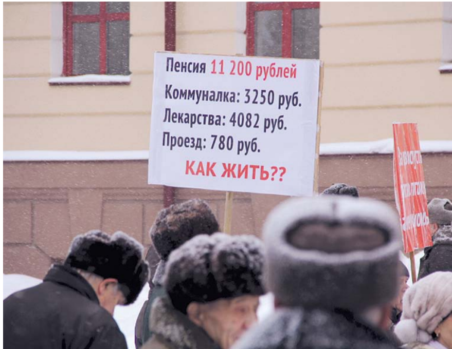
НА ФОТО: ЧТОБЫ ПЕНСИИ ХВАТАЛО, НУЖНО СНИЗИТЬ КОЛИЧЕСТВО ПЕНСИОНЕРОВ

Необходимый стаж для начисления страховой пенсии, который сейчас ежегодно повышается до 15 лет к 2024 году, нужно продолжить повышать и далее — до 20 лет, говорится в материалах ЦСР. Минимальное число пенсионных баллов, которое тоже запланировано по-