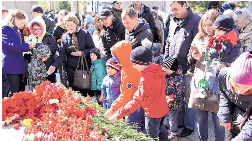
НА ФОТО: НОВОСИБИРЦЫ ПРИНЕСЛИ ЦВЕТЫ К ВЕЧНОМУ ОГНЮ

Шествие и митинг прошли в 9 часов утра. Колонна, в которой представители администрации, общественных организаций, учащиеся школ, ветераны, прошла по проспекту Дзержинского в парк «Березовая роща». Там, на площадке перед памятником воинам, умершим от ран в госпиталях города Новосибирска в годы Великой Отече-