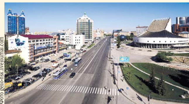
НА ФОТО: НАШ ГОРОД БЕЗОПАСНЕЕ РИМА И АФИН