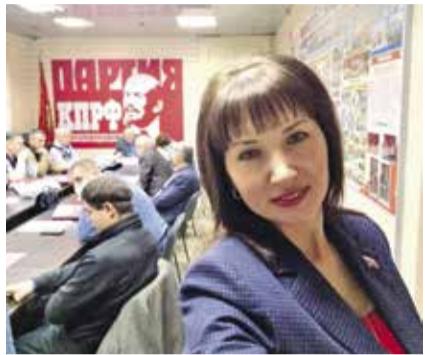
НА ФОТО: УЧАСТНИКИ ПЛЕНУМА НОВОСИБИРСКОГО МЕСТНОГО ОТДЕЛЕНИЯ КПРФ

По данным альтернативной системы подсчета голосов, которые приводились на пленуме, совокупно в Новосибирском районе КПРФ получила 26,06%, более 11 тысяч голосов, в то время как «Единая Россия» — 14,2 тысячи, 33,6%. В сравнении с кампанией 2020 года, когда проходили выборы в Совет депутатов района, коммунисты увеличили свой результат как в процентном соотношении, так и в абсолютных величинах — тогда список КПРФ получил всего 16,7%, 6,3 тысячи голосов. Год назад оппозиционный электорат целенаправленно раскалывался, что было