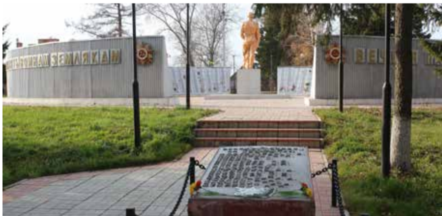
НА ФОТО: ПАМЯТНИК НЕИЗВЕСТНОМУ СОЛДАТУ В ЦЕНТРЕ КЫШТОВКИ