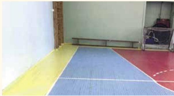
НА ФОТО: СПОРТИВНЫЙ ЗАЛ НАХОДИЛСЯ В УДРУЧАЮЩЕМ СОСТОЯНИИ

С другой стороны, я обратил внимание на удручающее состояние спортивного зала. Мне, как взрослому человеку, воспитывающему своих детей, стало больно за ребят — атмосфера в учреждении сама по себе хорошая, но спортзал выделяется в худшую сторону. Вместе с Фондом развития детского спортивного резерва решили взять спортзал под свою опеку, запланировали провести там ремонт, стартовал сбор материалов.