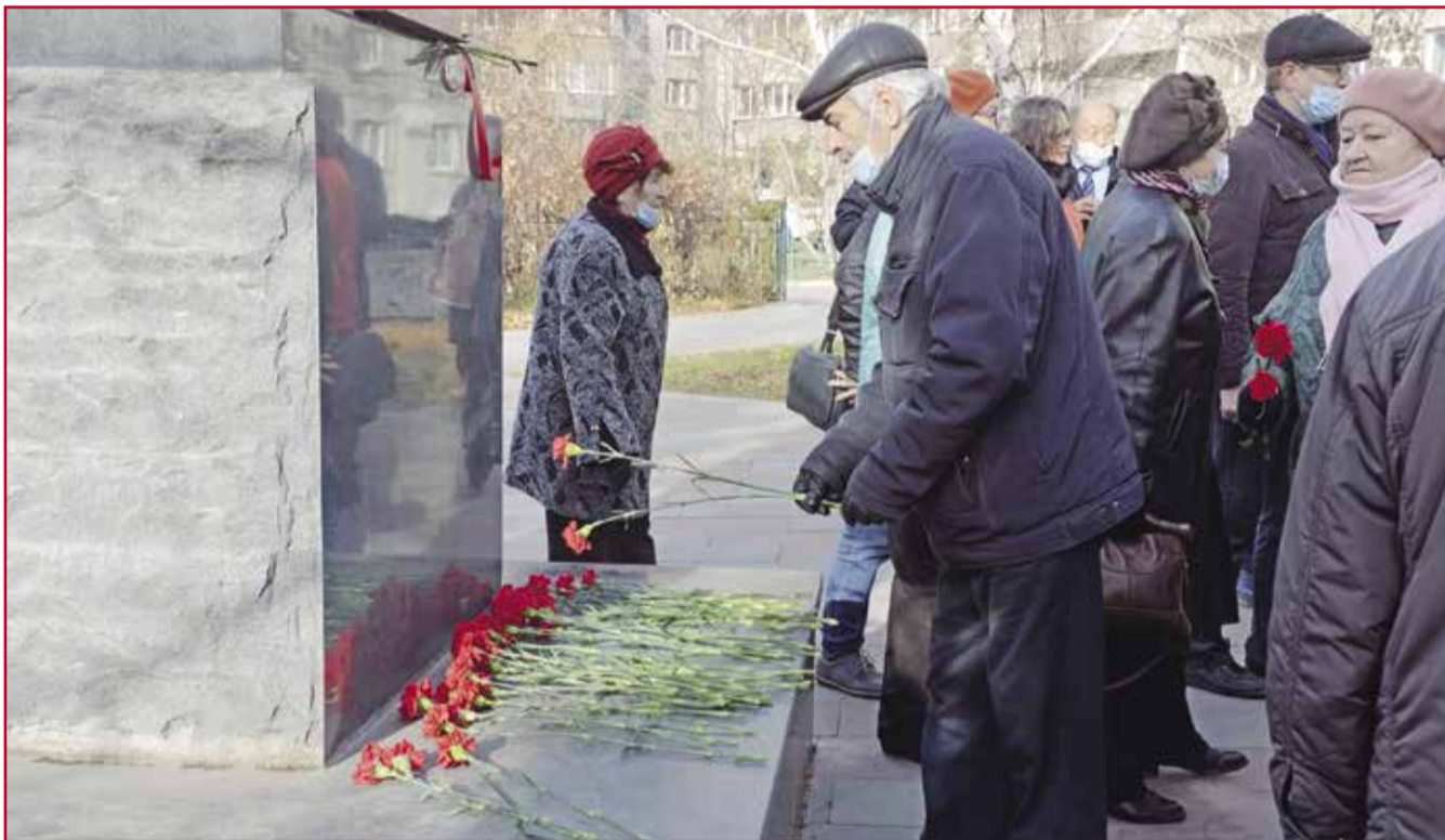
НА ФОТО: ВОЗЛОЖЕНИЕ ЦВЕТОВ К СТЕЛЕ «КОМСОМОЛЬЦАМ ВСЕХ ПОКОЛЕНИЙ»