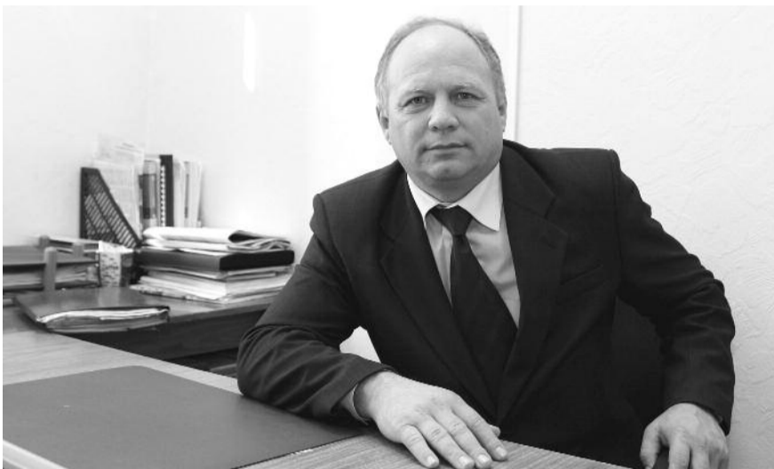
● НА ФОТО: ДЕПУТАТ ЗАКОНОДАТЕЛЬНОГО СОБРАНИЯ НОВОСИБИРСКОЙ ОБЛАСТИ, ПЕРВОЙ СЕКРЕТАРЬ ИСКИТИМСКОГО ОТДЕЛЕНИЯ КПРФ СЕРГЕЙ КАНУННИКОВ

ОБРАЩЕНИЕ ДЕПУТАТА ЗАКОНОДАТЕЛЬНОГО СОБРАНИЯ НОВОСИБИРСКОЙ ОБЛАСТИ, ПЕРВОГО СЕКРЕТАРЯ ИСКИТИМСКОГО ОТДЕЛЕНИЯ КПРФ СЕРГЕЯ КАНУННИКОВА К ИЗБИРАТЕЛЯМ Г. ИСКИТИМА