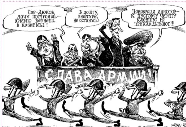
● НА РИС.: НАША АРМИЯ ВСЕХ СИЛЬНЕЙ?

Российская армия в ее нынешнем состоянии не способна к выполнению даже минимально необходимых функций. Сохранение прежних объемов финансирования отечественных Вооруженных Сил приведет к коллапсу и исчезновению армии как таковой, считают военные эксперты.