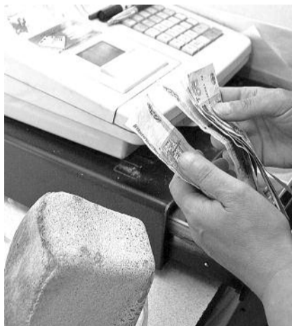
● НА ФОТО: ЦЕНЫ РАСТУТ, ЗАРПЛАТЫ — НЕТ

Не радуют и последние данные Росстата по доходам и зарплатам населения. В январе 2011 года реальные располагаемые денежные доходы россиян упали на 5,5% по сравнению с январем 2010 года. Номинальная зарплата россиян выросла в январе этого года по отношению к прошлогоднему январю на 10,2%, а реальная — лишь на 0,6%. При этом уточним: статистика доходов принципиально отличается от статистики зарплат. Ведь в доходах учитываются в том числе и пенсии, которые правительство периодически индексирует, то есть повышает с учетом инфляции. Динамика же зарплат отражает именно те экономические