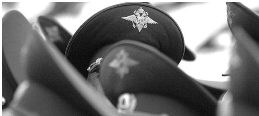
● НА ФОТО: СЕЙЧАС ПРАКТИЧЕСКИ ВСЕ СОТРУДНИКИ МВД ВЫВЕДЕНЫ ЗА ШТАТ

— С 1 марта у нас в стране не милиция, а полиция, — говорит лидер коммунистов Новосибирской области. — На первый взгляд кажется, что ничего существенного не случилось, но на самом деле в структуре правоохранительных органов происходят глубинные изменения. Практически все