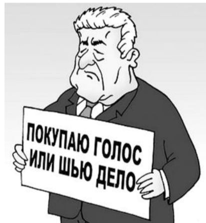
● НА РИС.: ИХ МЕТОДЫ

решил, что «нарушение обязанности политической партии о заблаговременном извещении избирательной комиссии о выдвижении кандидата не влечет правовых последствий для признания незаконным решения избирательной комиссии». КПРФ оспаривает это решение в областном суде.