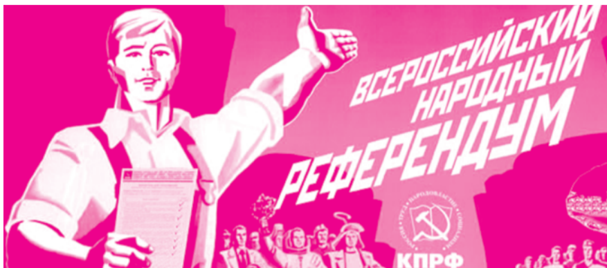
● НА РИС.: ПРИМИ УЧАСТИЕ ВО ВСЕРОССИЙСКОМ НАРОДНОМ РЕФЕРЕНДУМЕ!

В Барабинске единороссы, наплевав на нормы закона, на выдвижение кандидатов не пригласили представителей избиркома. Подобное нарушение, допущенное любой другой партией, неминуемо бы повлекло снятие всех выдвинутых кандидатов. Однако к единороссам законодательство, видимо, неприменимо — районный суд