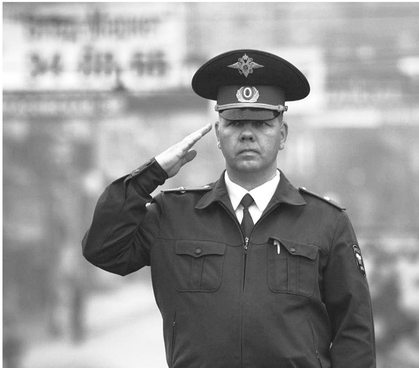
● НА ФОТО: ТОВАРИЩИ МИЛИЦИОНЕРЫ УХОДЯТ В ПРОШЛОЕ