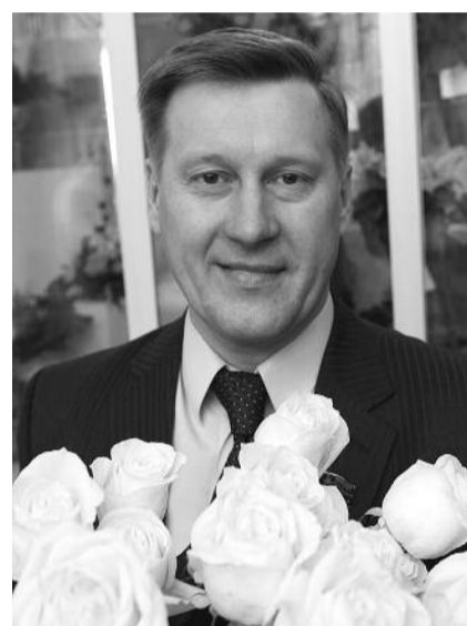
● НА ФОТО: С ПРАЗДНИКОМ, МИЛЫЕ ДАМЫ!

Вот и закончилась суровая сибирская зима, пришла весна — пора свежести и расцвета. А с приходом весны пришел прекрасный праздник — Международный женский день 8 Марта.