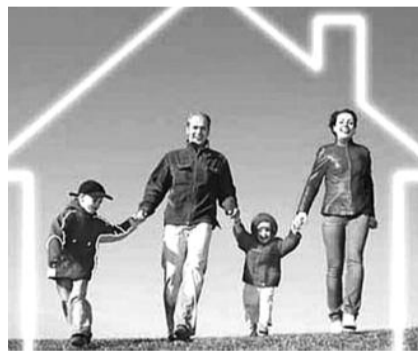
● НА ФОТО: ПОДДЕРЖКА ТОЛЬКО НА СЛОВАХ

— Реализуя такие программы, мы фактически закрываем глаза на проблему. Признавая положительную работу мэрии при реализации провальной программы, депутаты-единороссы доводят ситуацию до абсурда и лишают городскую молодежь веры в помощь муниципалитета.