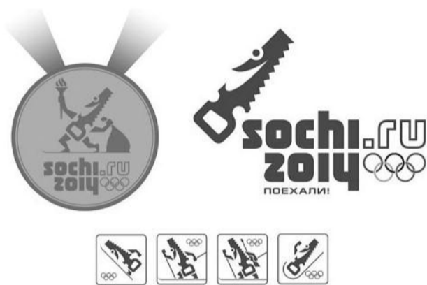
● НА ФОТО: НАРОДНЫЙ ОТВЕТ НА «РАСПИЛЫ» ОЛИМПИЙСКИХ БЮДЖЕТОВ — КАНДИДАТ В СИМВОЛЫ ОЛИМПИАДЫ РУЧНАЯ ПИЛА «ПИЛЫЧ»

Кто лучше — белый мишка в голубом шарфе, бледный голый заяц, леопард с доской для катания или еще полтора десятка «персонажей»? Вот такой острый и своевременный вопрос решали всем миром. А премьер ПУТИН , пользуясь случаем пропиариться, отдал свой голос за леопарда. Их, к слову, во всей России-матушке найдется не более 50 штук.