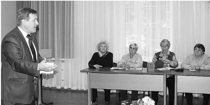
НА ФОТО: АНАТОЛИЙ ЛОКОТЬ НА ВСТРЕЧЕ С ДЕТЬМИ ВОЙНЫ

— Этот закон призван устранить историческую несправедливость по отношению к детям войны, которые лишились детства, в голоде и холоде наравне со взрослыми на заводах и фабриках ковали историческую победу над фашизмом, — говорит Анатолий ЛОКОТЬ. — У большинства из них отцы сгинули в военном лихолетии, отцы оплатили победу своей кровью, не щадя себя и свято верили, что если им придется погибнуть в бою, об их детях позаботится страна, ради которой они пошли на смерть. Но поколение детей войны превратилось в поколение лишних людей, закона о них нет, нет и обеспечения достойной старости. Маленькая разгромленная Германия уже расплатилась со своими участниками войны, выплатила контрибуцию временно оккупированным