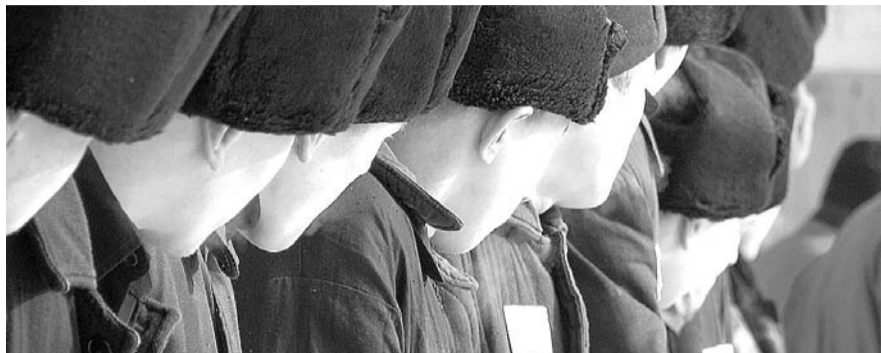
НА ФОТО: ЭТОТ ПРОЕКТ АМНИСТИИ ПОЗВОЛИТ ВЫЙТИ НА СВОБОДУ ОПАСНЫМ ПРЕСТУПНИКАМ