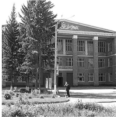
НА ФОТО: ВСТРЕЧА СОСТОЯЛАСЬ В РАЙОННОМ ДОМЕ КУЛЬТУРЫ

3 ноября в Доме культуры Черепановского района депутат Госдумы Анатолий ЛОКОТЬ провел встречу с избирателями. Несмотря на выходной день, десятки жителей районного центра и соседних населенных пунктов