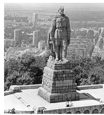
НА ФОТО: ПАМЯТНИК В БОЛГАРИИ

Ветеран Великой Отечественной войны Алексей Скурлатов, ставший прототипом героя известного памятника «Алеша» в Болгарии, скончался в своем родном селе Налобиха Косихинского района Алтайского края, сообщил РИА Новости представитель краевой администрации. Легендарному разведчику был 91 год.