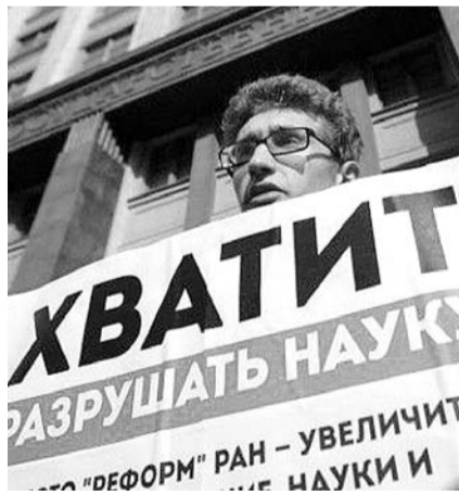
НА ФОТО: НЕУЖЕЛИ ОПОМНИЛИСЬ?

Власть решила «заморозить» реформу Академии наук, опасаясь роста протестных настроений в обществе