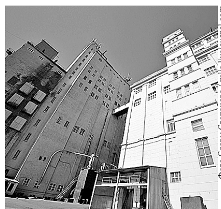
НА ФОТО: НОВОСИБИРСКИЙ МЕЛЬКОМБИНАТ — В ЧЕРНОМ СПИСКЕ

В черный список попали организации-хранители, имеющие неудовлетворительное санитарно-техническое, противопожарное или финансово-хозяйственное состояние. Из Новосибирской области в этом списке ДОО «Кирзахлебопродукт», ОАО «Баганский элеватор», ЗАО «СибЭкоРесурс», ДОО «Усть-Тарское хлебоприемное предприятие», ОАО «Новосибирскхлебопродукт», ООО «Финтрейд» и ООО «Чулымхлебопродукт». По оценкам ОЗК, эти компании имеют высокие ри-