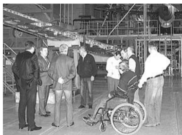
НА ФОТО: ВСТРЕЧА В НИИ АВИАЦИИ