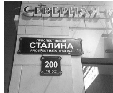
НА ФОТО: АКТ ВОССТАНОВЛЕНИЯ ИСТОРИЧЕСКОЙ СПРАВЕДЛИВОСТИ

Минувшей ночью группа активистов провела акцию в Санкт-Петербурге, которую ее представители в письме в адрес редакции сайта «Фонтанка.ру» назвали «актом восстановления исторической справедливости».