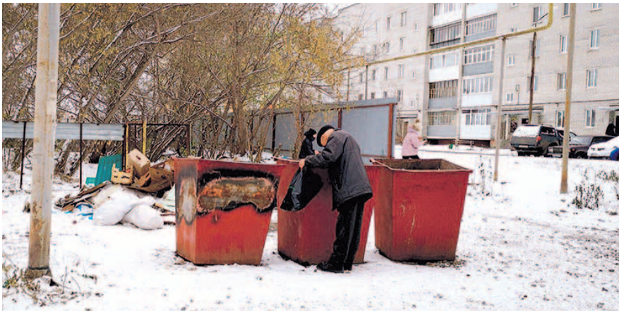
НА ФОТО: ПЕНСИИ ДЛЯ НАПОЛНЕНИЯ ПРОДУКТОВОЙ КОРЗИНЫ НЕ ХВАТАЕТ

Мать троих детей, семья которой имеет на еду 30 тысяч рублей в месяц, сопровождал во время покупок в магазине маркетолог. Он посоветовал взять корзинку вместо тележки, чтобы купить меньше; смотреть на нижние полки, где продукты дешевле; заменить колбасу и деликатесы мясом, которое можно приготовить, к примеру, в духовке, и это обойдется в два раза