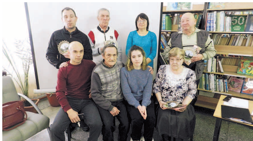
НА ФОТО: ПОТОМКИ СУЗУНСКИХ БОРЦОВ ЗА ВЛАСТЬ СОВЕТОВ