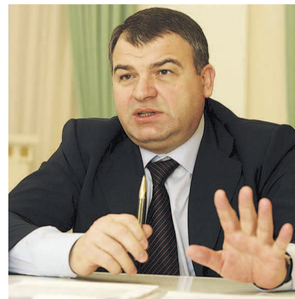
НА ФОТО: СЕРДЮКОВ ПРЕДЛАГАЕТ БОРЦАМ С КОРРУПЦИЕЙ НЕ МЕШАТЬ ЕМУ «РАБОТАТЬ»

В бюллетене Антикоррупционного комитета опубликованы данные за 2017 год о полученных и выявленных в России взятках, сумма за год увеличилась в три раза и достигла 6 млрд. 700 млн. руб.