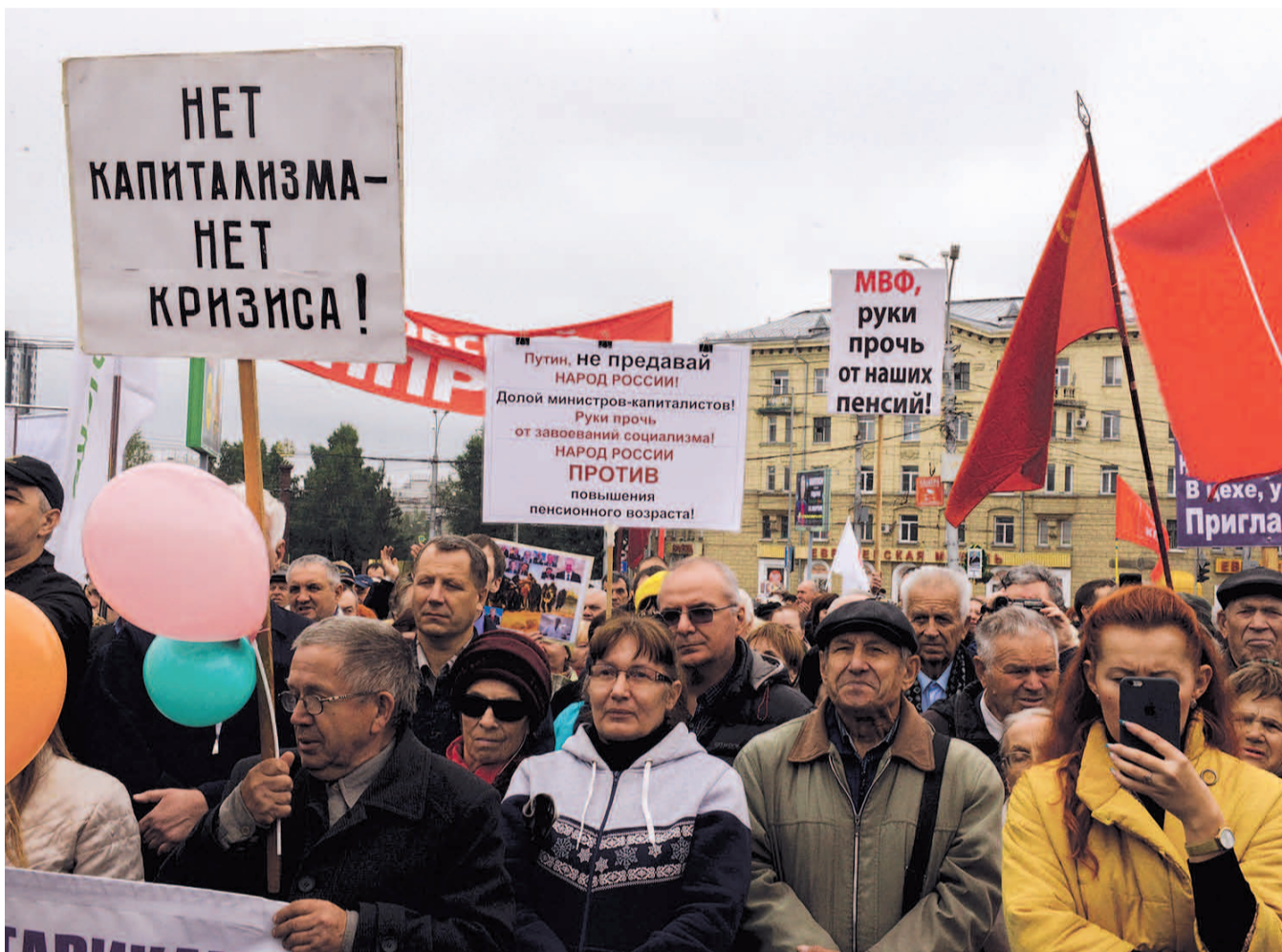
НА ФОТО: НОВОСИБИРЦЫ АКТИВНО ПРОТЕСТУЮТ ПРОТИВ ПОВЫШЕНИЯ ПЕНСИОННОГО ВОЗРАСТА