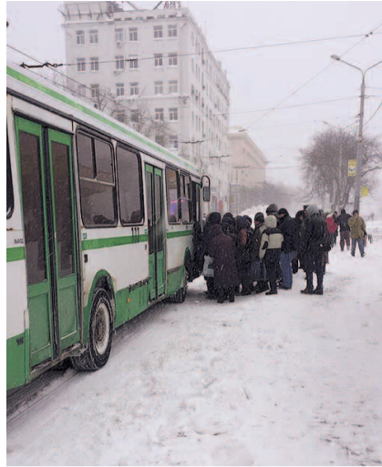
НА ФОТО: РЕДКИЙ АВТОБУС ЗАБИТ ПОД ЗАВЯЗКУ

— Для чего содержать БиС (благоустройство и санитарная очист-