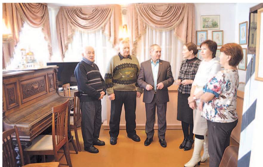
НА ФОТО: НА ОТКРЫТИИ ВЫСТАВКИ В КУЙБЫШЕВЕ