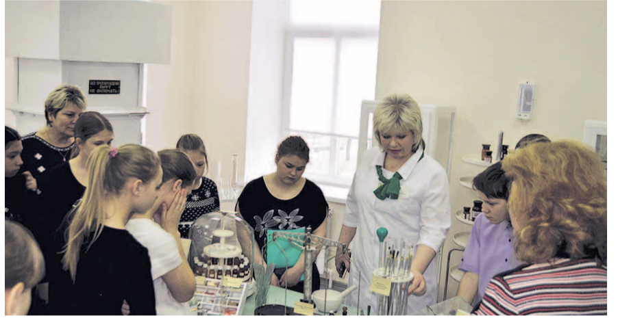
НА ФОТО: УРОК ПО ПРОФЕССИОНАЛЬНОЙ ОРИЕНТАЦИИ В АПТЕКЕ №2

— Специалисты выходят в аптеки и по утвержденному плану проверки регистрируют все разделы фармацевтической деятельности: от внешнего вида до особо важного санитарного режима и фармпорядка, — рассказал директор аптечной сети. — Если будут обнаружены какие-либо недочеты, сотрудни-