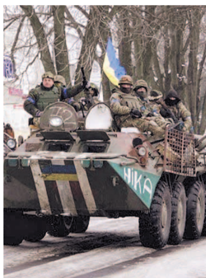
НА ФОТО: ВОЕННОЕ ПОЛОЖЕНИЕ НА УКРАИНЕ

Также необходимо немедленно признать ДНР и ЛНР. Они самоотверженно поднялись на защиту Русского мира. И платят за это своей кровью. Мы признали Южную Осетию и Абхазию, и там больше не стреляют. Мы фактически признали Приднестровье, и там тоже воздерживаются от агрессии. Хотя в том же Приднестровье посадили лидера коммунистов ХОРЖАНА и третий месяц держат его в застенках. Я обращался ко всем службам безопасности, но