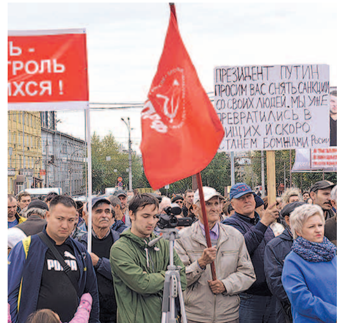
НА ФОТО: НОВОСИБИРЦЫ ГОТОВЫ ЗАЩИЩАТЬ СВОИ ПРАВА

4 октября Областной суд отклонил иск КПРФ к Облзбиркому.