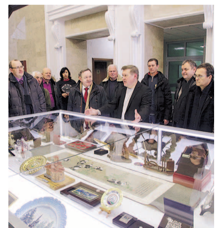
НА ФОТО: В КОРИДОРАХ МЭРИИ

К одному из последних, но не по значимости, мест коммунисты добирались через весь город по отремонтированному Красному проспекту — это обновленная Михайловская набережная. Даже укрытая снегом, она произвела впечатление на многих участников экс-