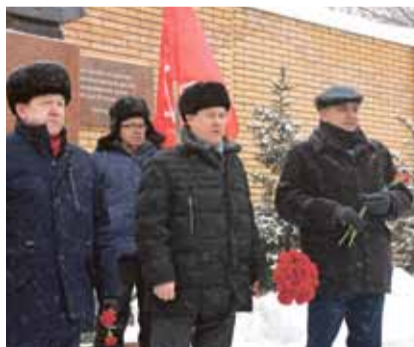
НА ФОТО: ЛИДЕРЫ НОВОСИБИРСКОГО ОБКОМА КПРФ НА ВОЗЛОЖЕНИИ ЦВЕТОВ К ПАМЯТНИКУ ГЕНЕРАЛИССИМУСУ ИОСИФУ СТАЛИНУ

Лидер новосибирских коммунистов напомнил, что на декабрь этого года пришлось много праздничных дат: 84 года «Сталинской Конституции», 103 года со дня возникновения самых сильных спецслужб, созданных в СССР, в первую очередь ВЧК, а 30 декабря исполнится 98 лет со дня создания Советского Союза.