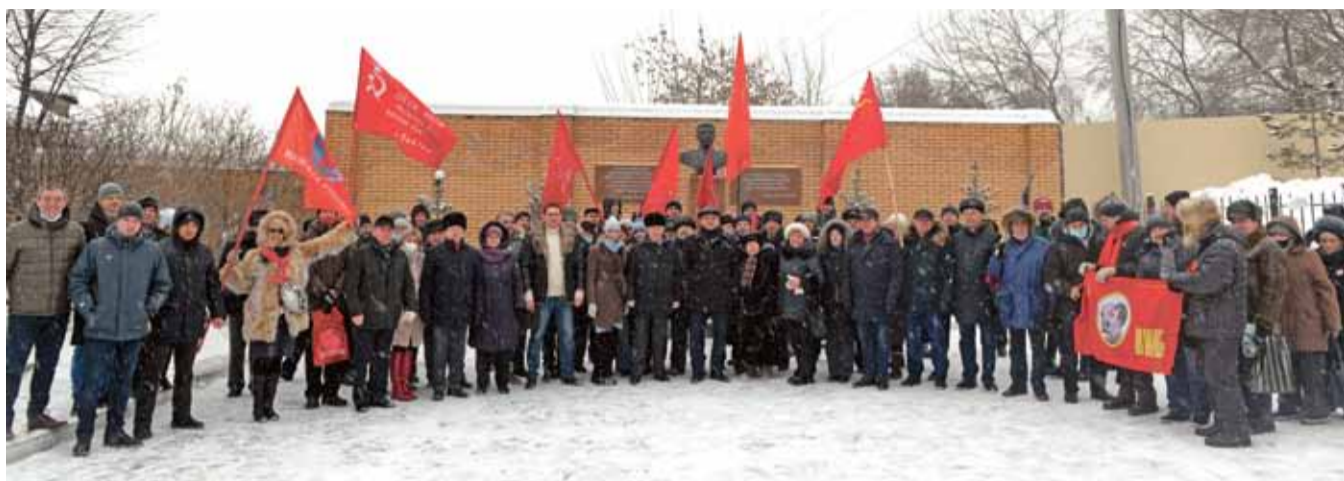
НА ФОТО: НОВОСИБИРСКИЕ КОММУНИСТЫ ПОМНЯТ ВЕЛИКОГО ГЕНЕРАЛИССИМУСА ИОСИФА СТАЛИНА

Одна из главных особенностей современного отношения к Иосифу Сталину, 141-ю годовщину со дня рождения которого мы сейчас отмечаем, — это несомненное признание его вклада в историю. Но ведь так было не всегда.