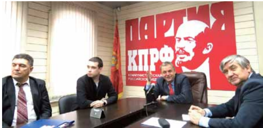
НА ФОТО: НОВОСИБИРСКИЕ КОММУНИСТЫ ПРИНИМАЮТ УЧАСТИЕ В ВИДЕОКОНФЕРЕНЦИИ