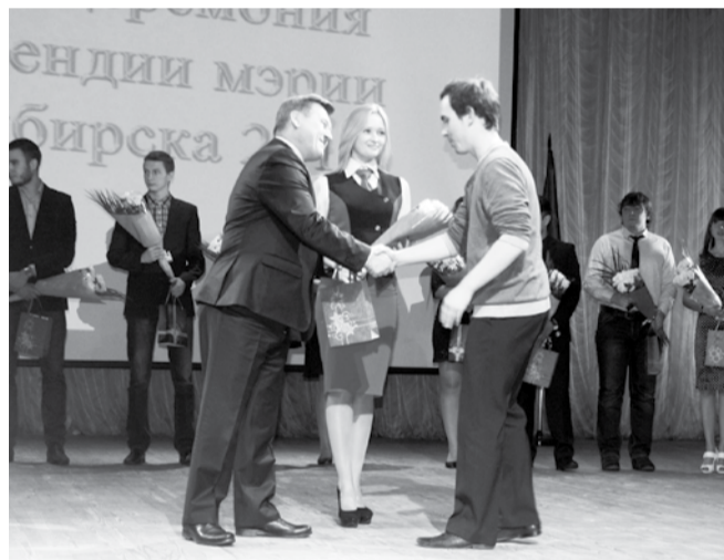
НА ФОТО: МЭР ЛИЧНО ВРУЧАЛ НАГРАДЫ