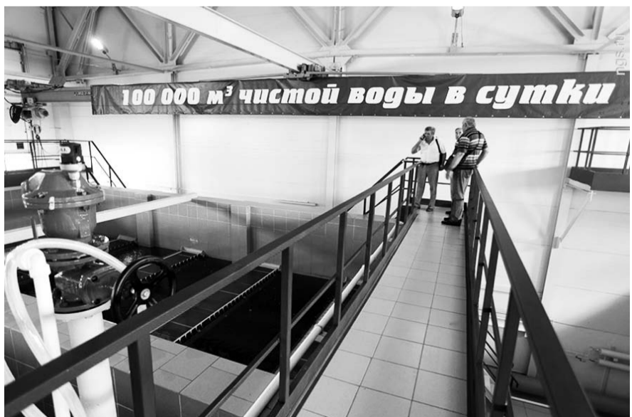
НА ФОТО: ЧИСТАЯ ПИТЬЕВАЯ ВОДА — ВАЖНАЯ ЗАДАЧА ДЛЯ НОВОСИБИРСКОЙ ОБЛАСТИ