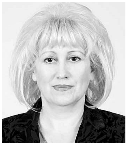
НА ФОТО: ВЕРА ГАНЗЯ

По словам депутата Госдумы Веры ГАНЗЯ , региональные чиновники, включая губернатора, предпочитают замалчивать проблемы области, вместо того, чтобы совместно с депутатами искать пути их решения.