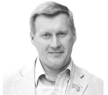
НА ФОТО: АНАТОЛИЙ ЛОКОТЬ

На сессии Совета депутатов Новосибирска депутаты поддержали предложение мэрии об изменении земельного налога, которые позволят дополнительно привлечь в бюджет до 200 миллионов рублей.