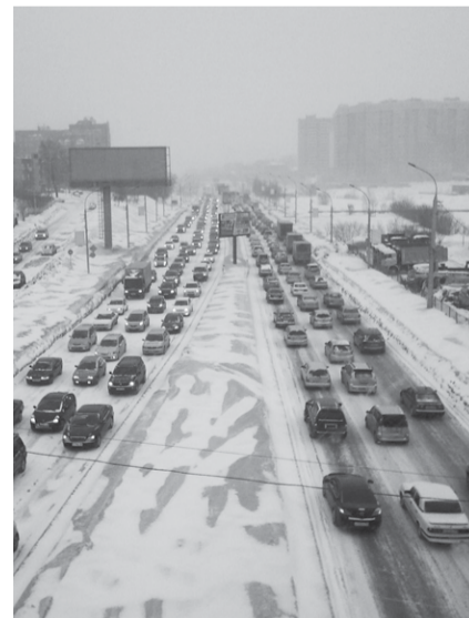
НА ФОТО: СНЕГ ОСТАНОВИЛ ДВИЖЕНИЕ

Также в ходе встречи с журналистами обсуждалась история, в которую попал барнаулец, сутки просидевший в автомобиле, находящемся на платформе эвакуатора, протестуя против перемещения своего авто на штрафстоянку. Мэр Новосибирска подверг критике процедуру эвакуации автомобиля в присутствии его владельца, предложив ограничиться штрафом. Так коммунист отреагировал на беспрецедентный случай, когда водитель провёл больше суток в транспортном средстве.