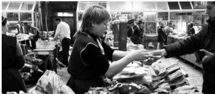
НА ФОТО: РАСХОДЫ НА ПРОДУКТЫ ПИТАНИЯ РАСТУТ