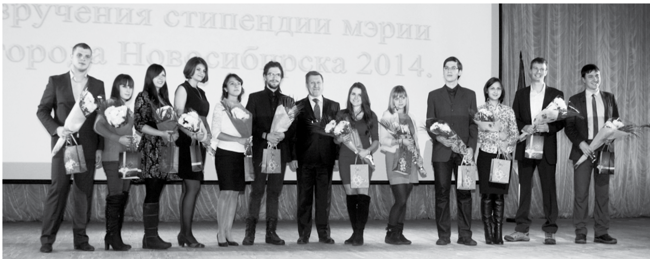
НА ФОТО: ТАЛАНТЛИВАЯ МОЛОДЕЖЬ — БУДУЩЕЕ НАШЕГО ГОРОДА!

— Сегодня на предприятиях города острая нехватка кадров — нужны инженеры, конструкторы, квалифицированные рабочие с высоким уровнем подготовки для реализации государственной политики импортозамещения. Для нас очень важно, чтобы такие ребята оставались здесь. Самые лучшие, умные, перспективные, чтобы продвигали наше производство и экономику, чтобы у Новосибирска была перспектива развития! — подчеркнул мэр.