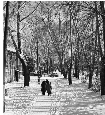
НА ФОТО: СКВЕР БУДЕТ ВОЗРОЖДЕН

В канун 70-летия Победы очень своевременным проектом отделения ЛКСМ «Первомайское» является восстановление Сквера героям Великой Отечественной войны по ул. Первомайской. В советское время Сквер героям Великой Отечественной войны в Первомайском районе был красивым и оживленным местом — в нем был мини-пруд с живыми рыбами и фонтаном в застекленной оранжерее, а по альпийской горке ездил паровоз с вагончиками. Стела-посвящение гласит: «Данный сквер был заложен трудящимися Первомайского района Новосибирска в честь 25-летия победы советского народа в Великой Отечественной войне». Сейчас же сквер почти заброшен — в нем больше не горит ни один фонарь, памятные доски с именами героев Великой Отечественной войны уничтожены, а стела-посвящение изрисована вандалами. Требуют восстановления и ограждение сквера, дорожки, оставшиеся лишь фрагментарно, отсутствуют скамейки. Эта задача также стоит