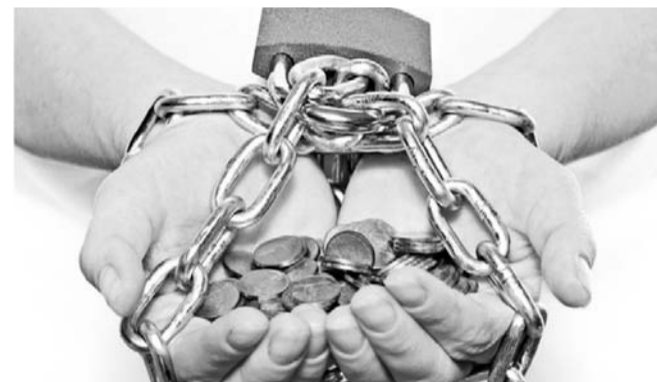
НА ФОТО: НАСЕЛЕНИЮ СТАЛО СЛОЖНО ОБСЛУЖИВАТЬ КРЕДИТЫ