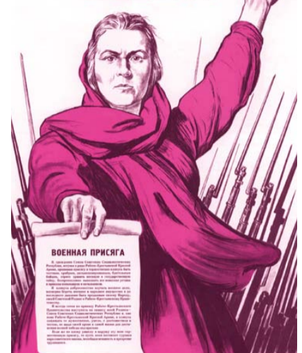
НА ФОТО: ПЛАКАТ, КАК И ПЕСНЯ, — ОДНА ИЗ ПРИМЕТ ВОЕННОГО ВРЕМЕНИ