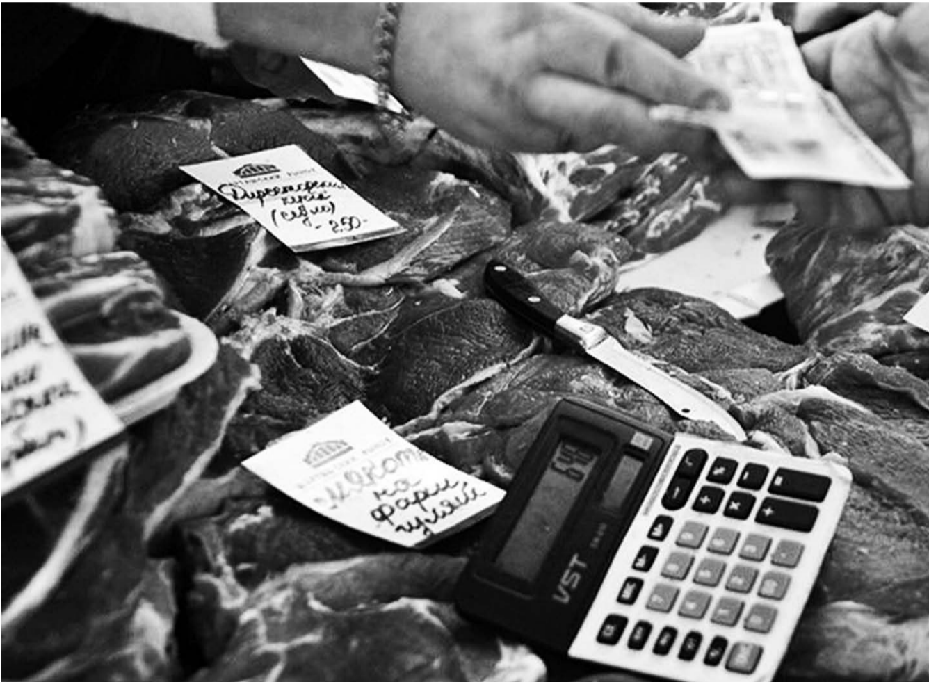
НА ФОТО: ЦЕННИКИ ПЕРЕПИСЫВАЮТСЯ ВСЕ ЧАЩЕ