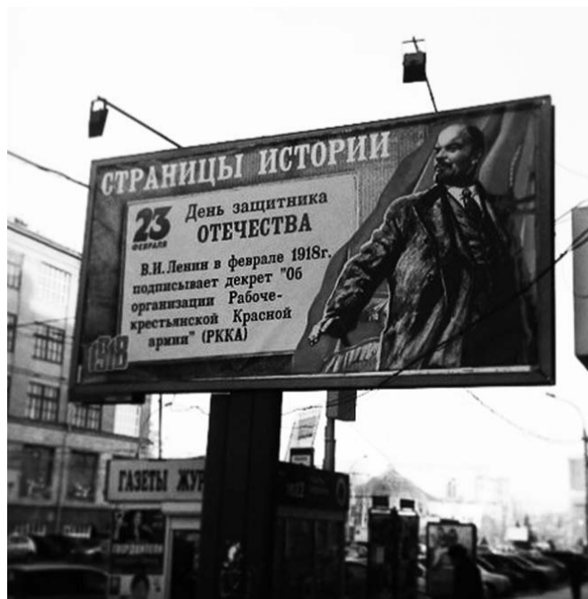
НА ФОТО: СОЦИАЛЬНАЯ РЕКЛАМА К 23 ФЕВРАЛЯ