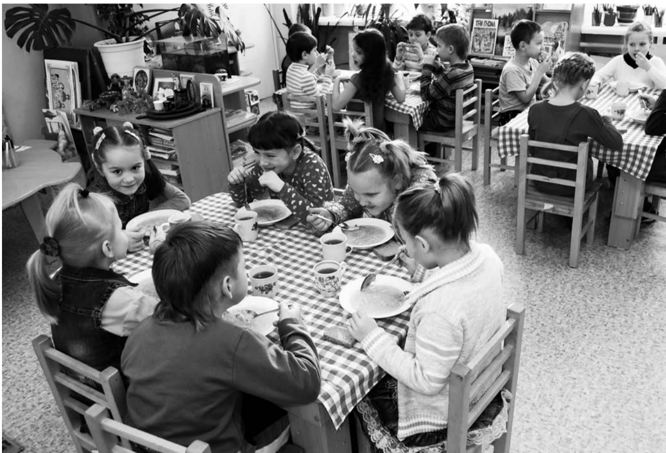
НА ФОТО: «ОБЩЕРОССИЙСКИЙ НАРОДНЫЙ ФРОНТ» ПРЕДЛАГАЕТ СЭКОНОМИТЬ НА ПИТАНИИ ДОШКОЛЬНИКОВ?