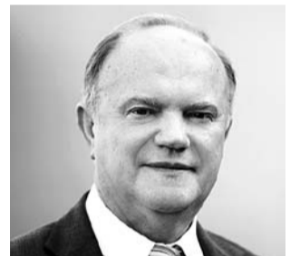
НА ФОТО: ГЕННАДИЙ ЗЮГАНОВ

17 февраля, предваряя пленарное заседание Госдумы, перед журналистами выступил Председатель ЦК КПРФ Геннадий Зюганов .