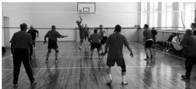
НА ФОТО: ОДИН ИЗ МАТЧЕЙ ГОРОДСКОГО ПЕРВЕНСТВА