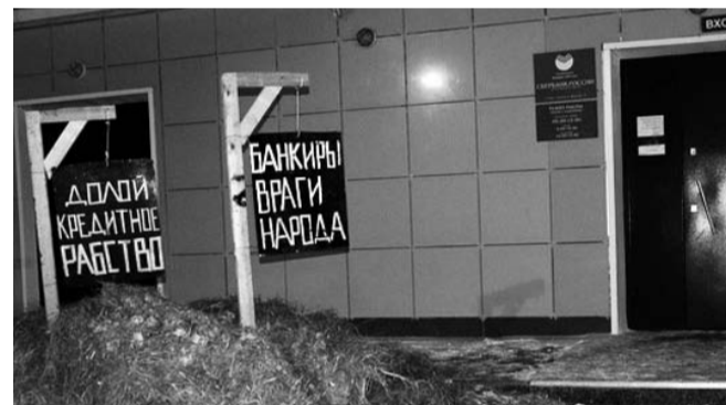
НА ФОТО: КРЕДИТ ОПЛАЧЕН НАВОЗОМ