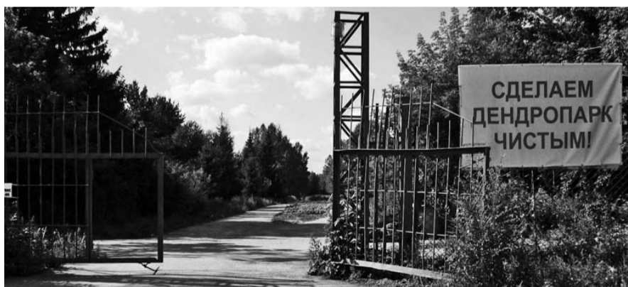
НА ФОТО: ЗАРОСШИЙ ЛЕС ПРЕВРАТИТСЯ В ЗОНУ ОТДЫХА ГОРОЖАН