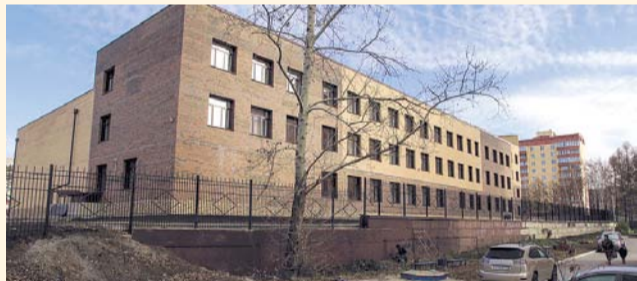
НА ФОТО: НОВОЕ ЗДАНИЕ ШКОЛЫ