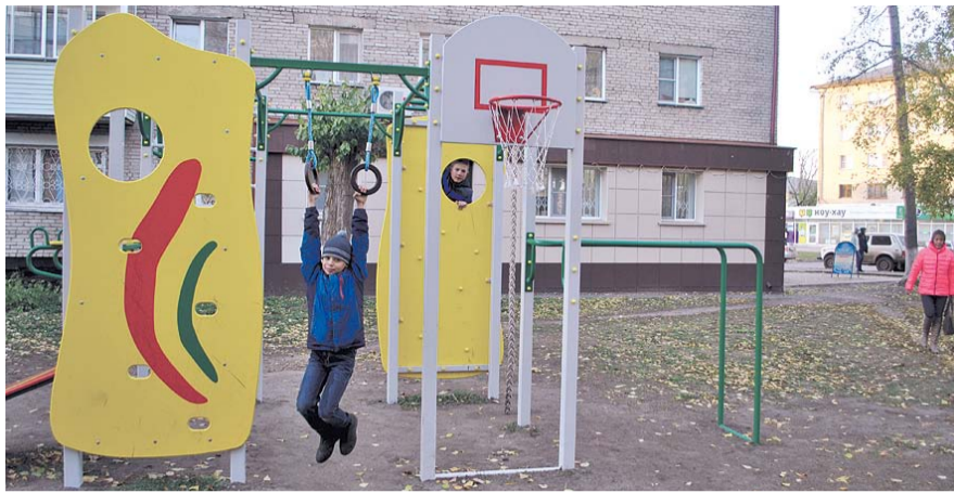
НА ФОТО: ДЕТИ СРАЗУ ОЦЕНИЛИ НОВУЮ ПЛОЩАДКУ