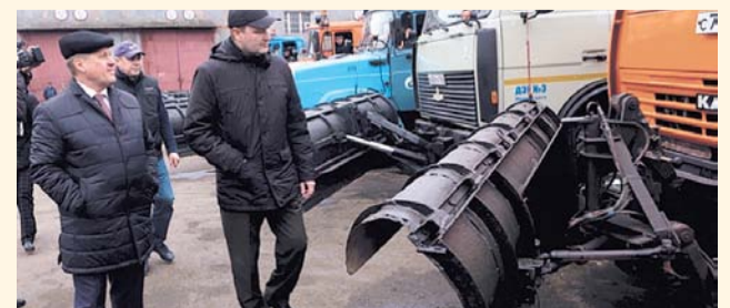
НА ФОТО: МЭР ОСМАТРИВАЕТ УБОРОЧНУЮ ТЕХНИКУ