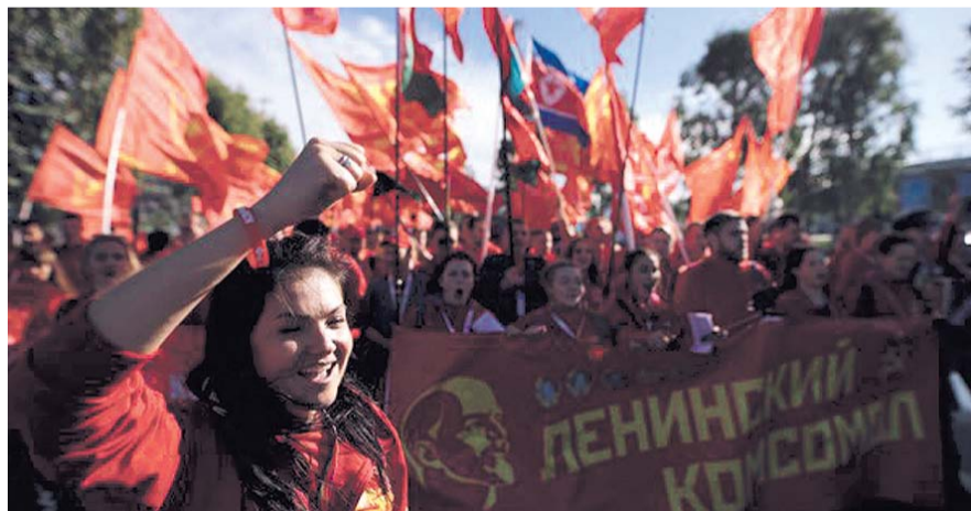
НА ФОТО: КОМУНИСТИЧЕСКАЯ МОЛОДЕЖЬ

И об этом, как и о других губительных для человечества сторонах империализма, сказал президент Всемирной