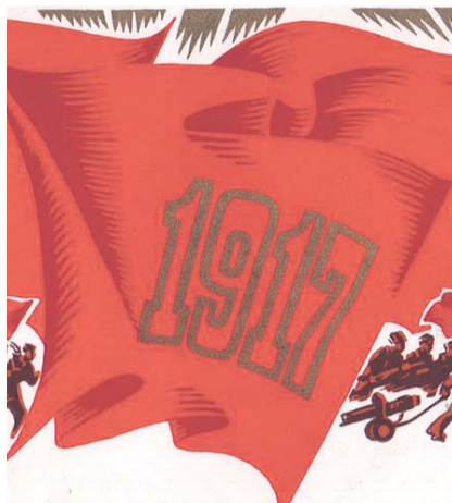
НА ФОТО: СЛАВА ВЕЛИКОМУ ОКТЯБРЮ!

Сегодня история пошла вспять: вновь появились богатые и бедные, сытые и голодные, олигархи и нищие. Его препохабие капитализм вновь вернулся на территорию нашей страны, сея рознь, междоусобицу, разврат. В стране разруха, беспредел и несправедливость. Не стало Советского Союза, не стало дружбы народов, не стало высоких революционных идеалов и нравственных целей. Мощный удар нанесен по промышленности, сельскому хозяйству, науке, образованию. При нашем молчаливом согласии Россию спихнули с высокой орбиты, и она с каждым годом опускается все ниже и ниже. Но, похоже, многих это устраивает, так как каждый раз на выборах голосуют за пред-