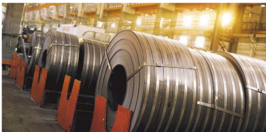
НА ФОТО: НОВОСИБИРСКАЯ ПРОМЫШЛЕННОСТЬ ЭФФЕКТИВНА, НЕСМОТЯ НА САНКЦИИ