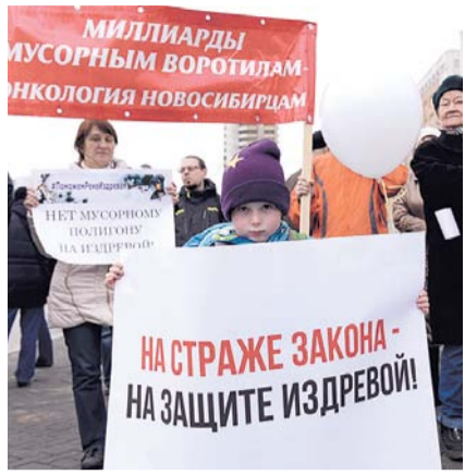
НА ФОТО: МИТИНГОВАЛ И СТАР, И МЛАД

Неофициальным лозунгом протеста могло бы стать: «Ударим креативом по концессии». Митинг украсили большие кубы с граффити, направленные против «мусорной аферы» (так называли кон-