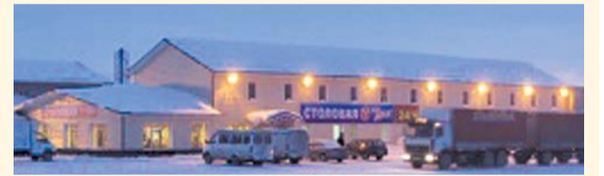
НА ФОТО: КОМПЛЕКС СТОИТ ПЕРЕД УГРОЗОЙ ЗАКРЫТИЯ