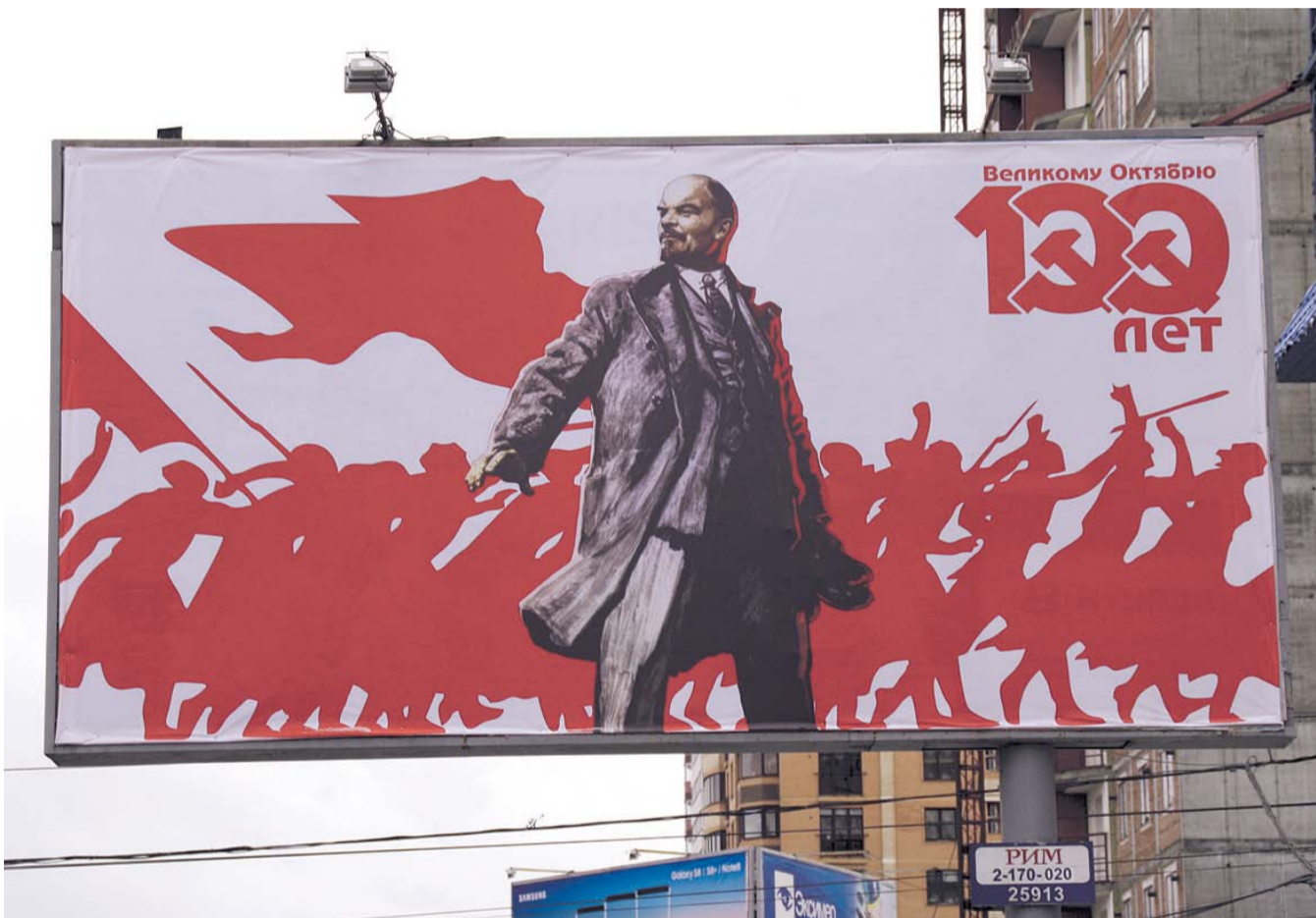
НА ФОТО: НОВОСИБИРСК НАЧИНАЕТ ОТМЕЧАТЬ СТОЛЕТИЕ ВЕЛИКОЙ ОКТЯБРЬСКОЙ СОЦИАЛИСТИЧЕСКОЙ РЕВОЛЮЦИИ