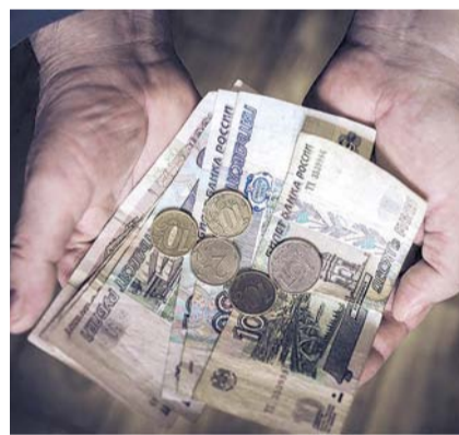
НА ФОТО: СТАТИСТИКОЙ СЫТ НЕ БУДЕШЬ

— Инфляция действительно уменьшается, но нужно смотреть, по каким именно группам товаров она снижается, а по каким растет. Инфляция, которую учитывает Центральный банк, видимо, расходится с теми группами товаров, которые мы потребляем. Проще говоря, не все товары, которые входят в наш ежедневный набор, учитываются в индексе инфляции. Потому что если мы видим номинальный рост заработной платы и сокращение инфляции, а реальные доходы падают, возникает вопрос с расчетами.