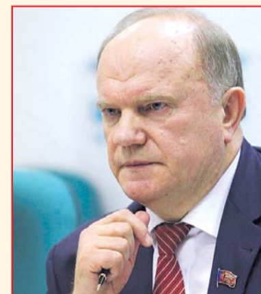
Председатель ЦК КПРФ Геннадий ЗЮГАНОВ

В проекте бюджета, который нам навязывают, отразились самые возмутительные и разрушительные особенности проводимого властью социально-экономического курса. Голосуя против этого проекта, КПРФ голосует и против этого курса, скорейшая смена которого является необходимым условием возрождения России, ее спасения от экономической и социальной катастрофы.