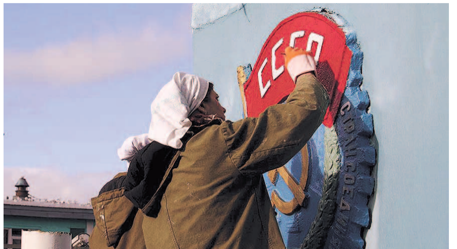
НА ФОТО: В СОВЕТСКОМ СОЮЗЕ ЛЮДИ ЖИЛИ, В РОССИИ — ВЫЖИВАЮТ

— Молодежь сейчас вспоминает о достижениях социализма намного чаще. Такое отношение возникло не столько благодаря, например, общению с родителями и теми, кто жил в Советском Союзе, но и потому, что молодежь видит, что в сегодня в нашей стране многое идет не так. В современной России государство не заботится о молодежи. И, конечно, молодые люди хотели бы иметь уверенность в завтрашнем дне, как это было в СССР, граждане которого были обеспечены бесплатным и лучшим в мире образованием, имели ясные перспективы получения собственной