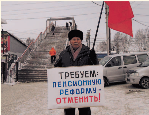
НА ФОТО: БОРЬБА ПРОДОЛЖАЕТСЯ!