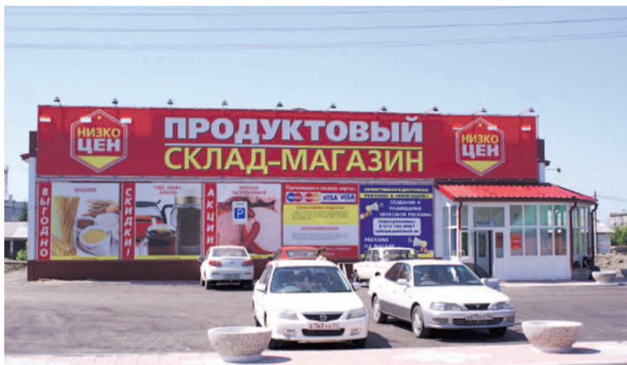
НА ФОТО: ВМЕСТО ЕДИНСТВЕННОЙ БАНИ — ОЧЕРЕДНОЙ МАГАЗИН

— На месте разрушенной бани быстро построили магазин «Низкоцен», в