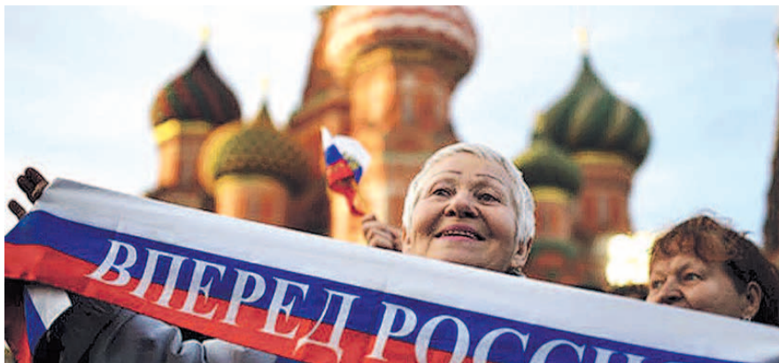
НА ФОТО: А ЕСТЬ ЛИ ОНО, ДВИЖЕНИЕ ВПЕРЕД?

Лидером рейтинга оказалась Норвегия, далее следуют Швейцария и Исландия. Также в десятку вошли Люксембург, Дания, Швеция, Сингапур, Финляндия, Австрия и Нидерланды. Из бывших советских республик выше всех расположилась Эстония — 25-е место рейтинга. Что касается стран СНГ, то и среди них Россия оказалась не выше всех. Как уже было сказано, ее опередили Белоруссия и Казахстан, а Украина, несмотря на кризис последних лет, отстала не так уж сильно — она занимает 67-е место. Также