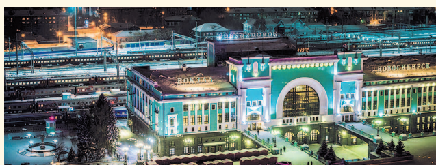
НА ФОТО: ДЛЯ МНОГИХ НОВОСИБИРСК НАЧИНАЕТСЯ С ВОКЗАЛА