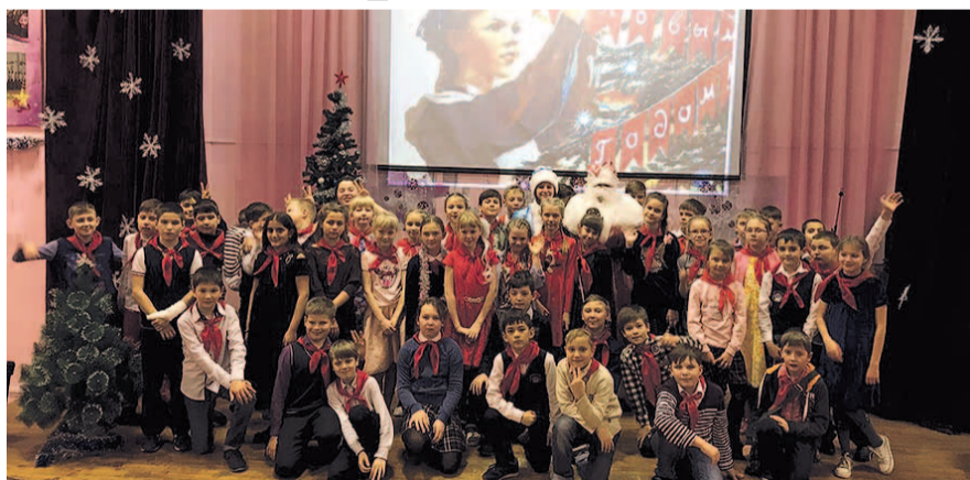
НА ФОТО: НОВОСИБИРСКИЕ ПИОНЕРЫ НАКАНУНЕ 2019 ГОДА