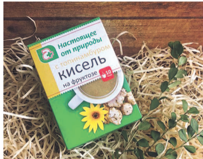
НА ФОТО: УГОЩАЙТЕСЬ НА ЗДОРОВЬЕ!

Обычно льняное масло применяется для профилактики и в комплексном лечении сердечно-сосудистых и кожных заболеваний, сахарного диабета, аллергии, избыточного веса и других проблем со здоровьем. Из-за того, что оно изготовлено из льна, выращенного в экологически чистых районах Сибири, где почвы богаты ценными микроэлементами — селеном, хромом и крем-