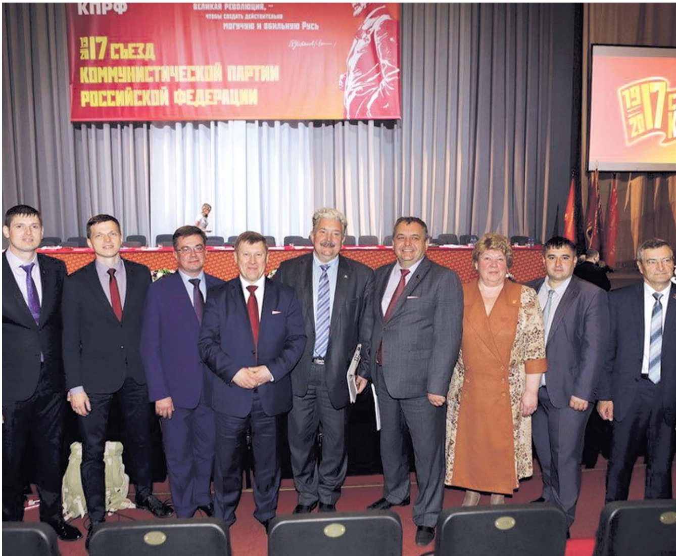
НА ФОТО: НОВОСИБИРСКАЯ ДЕЛЕГАЦИЯ НА XVII СЪЕЗДЕ КПРФ