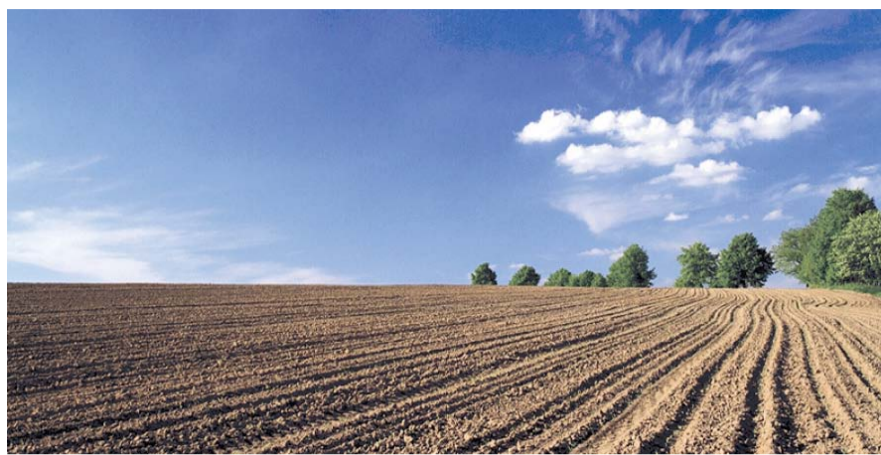
НА ФОТО: ЗАСЕЯНЫЕ ПОЛЯ ПРИХВАТИЛО МАЙСКИМИ ЗАМОРОЗКАМИ

Из-за майских заморозков сроки вегетации посевов передвинулись более чем на неделю. Скажется ли это на предстоящем урожае и последующем посеве яровых культур, редакция узнала у специалистов аграрной отрасли в нескольких районах НСО.