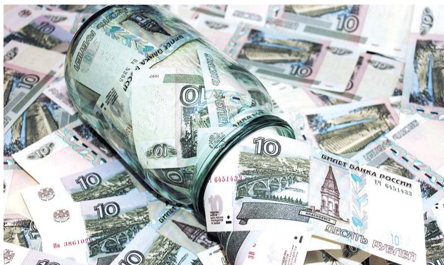
НА ФОТО: НАКОПЛЕНИЯ ЕСТЬ МЕНЕЕ, ЧЕМ У ТРЕТИ РОССИЯН

По данным Фонда, неутешительный показатель практически не меняется последние три месяца. В декабре 2016 ситуация была еще хуже — в отсутствие накоплений признавались 64% граждан.