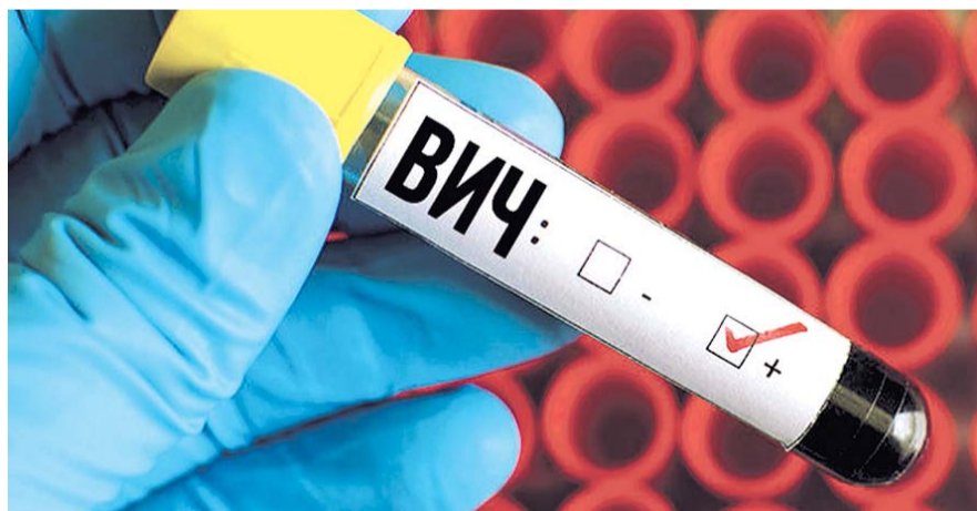
НА ФОТО: РАСТЕТ КОЛИЧЕСТВО ВИЧ-ИНФИЦИРОВАННЫХ

относительно вреда наркотиков, тех последствий, которые это употребление может повлечь, в том числе и ВИЧ-заболеваний. И осуществлять ее должны и учреждения образования, и учреждения здравоохранения, и работники правоохранительных органов. Причем последние должны максимально активизировать свою работу по пресечению проникновения наркотических веществ на территорию не только Новосибирской области, но и всего государства. Должен быть комплексный анализ ситуации и комплексное же воздействие на нее.