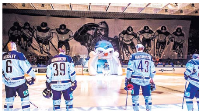
НА ФОТО: НОВОСИБИРСК СЛАВИТСЯ ХОККЕЙНЫМИ ТРАДИЦИЯМИ

Мэр Новосибирска Анатолий ЛОКОТЬ рассказал, что Новосибирск подал заявку на право принять Молодежный чемпионат мира по хоккею в 2023 году.