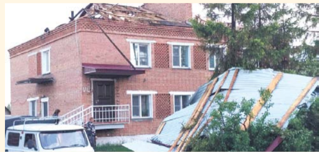
НА ФОТО: НЕКОТОРЫЕ ДОМА ОСТАЛИСЬ БЕЗ КРЫШИ