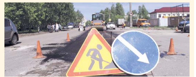
НА ФОТО: КОМИССИЯ ВЫСОКО ОЦЕНИЛА КАЧЕСТВО РЕМОНТА ДОРОГ