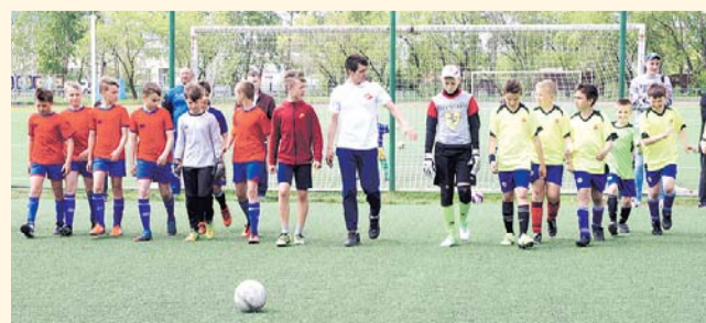
НА ФОТО: ЮНЫЕ СПОРТСМЕНЫ — УЧАСТНИКИ ТУРНИРА