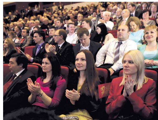
НА ФОТО: В ЗАЛЕ НЕ БЫЛО СВОБОДНЫХ МЕСТ

— При этом главная проблема нашего города, как и всей России — это