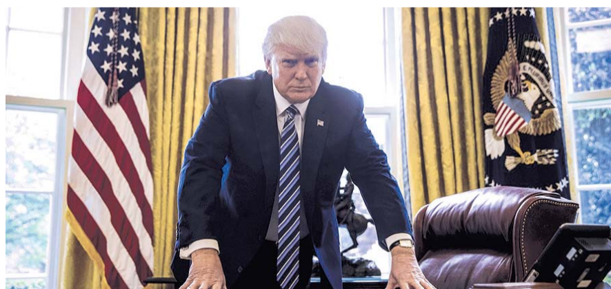
НА ФОТО: ПРЕЗИДЕНТ США ДОНАЛЬД ТРАМП

куда не денутся». Как показали последние события, именно такой подход, основанный на ленинской концепции империализма, оказался верным.