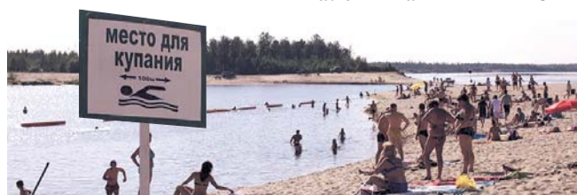
НА ФОТО: ОПРЕДЕЛЕНА БЕЗОПАСНЫЕ ДЛЯ КУПАНИЯ ПЛЯЖИ