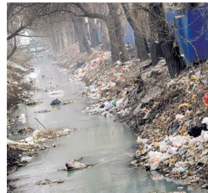
НА ФОТО: ЧТО ОСТАНЕТСЯ ПОСЛЕ НАС?

Год экологии имеет солидный бюджет, превышающий 347 млрд рублей. Экологические проблемы современной России — это чрезмерное истоще-