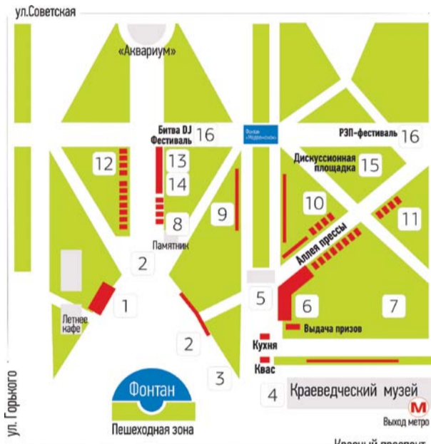
НА ФОТО: «ДЕНЬ ПРАВДЫ»: СХЕМА РАСПОЛОЖЕНИЯ ПЛОЩАДОК В ПЕРВОМАЙСКОМ СКВЕРЕ