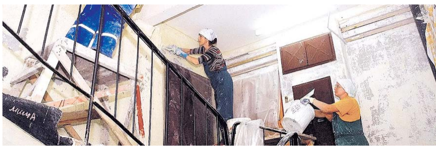
НА ФОТО: РЕМОНТ ПОДЪЕЗДА — ФИНАЛЬНЫЙ АККОРД КАПРЕМОНТА

ки, хороший, крепкий, потому что в то время за плохое строительство наказывали, и если его отреставрировать, он простоит еще лет 100. Сейчас наши проблемы пошли на убыль, потому что нам сделали ремонт водоотведения, доделывают канализацию. До этого починили крышу, заменили трубы отопления, холодного и горячего водоснабжения, электрику. В завершение приведут в порядок фасад, — рассказывает общественница.