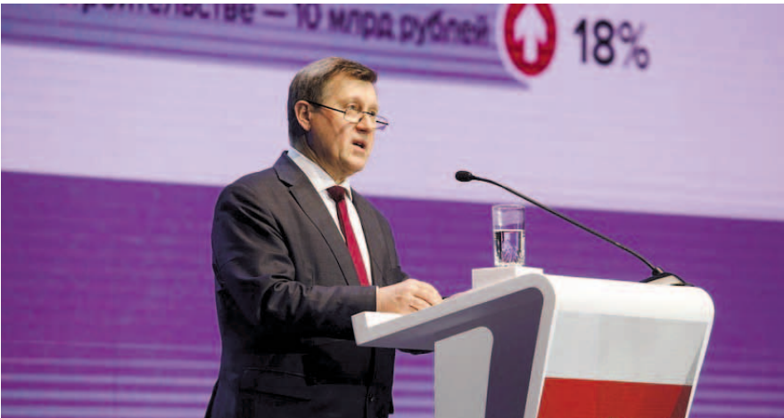
НА ФОТО: АНАТОЛИЙ ЛОКОТЬ РАССКАЗАЛ О ТОМ, ЧЕГО УДАЛОСЬ ДОБИТЬСЯ В 2019 ГОДУ

— Стремительное развитие Новосибирска — его историческая особенность. И это вечное движение вперед задают новосибирцы. Важно, чтобы Новосибирск таким и оставался — городом открывающихся новых возможностей. Чтобы именно с нашим городом связывали свое будущее умные, образованные, одаренные и трудолюбивые люди, — заявил Анатолий Локоть. — В Новосибирске ряд показателей демографии лучше, чем в среднем по России. Но негативные тенденции не обошли нас стороной. Последние четыре года снижается уровень рождаемости. В прошлом году естественный прирост населения сменился убылью. В то же время по сравнению с 2018 годом миграционный поток увеличился почти в два раза. Новосибирск остаётся лидером среди сибирских столиц по этому показателю. В результате число жителей достигло 1 млн 625 тысяч человек. Главный вывод: Мы растем!