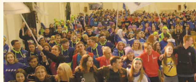
НА ФОТО: АКТИВНАЯ МОЛОДЕЖЬ ПОМОГЛА ВЕТЕРАНАМ