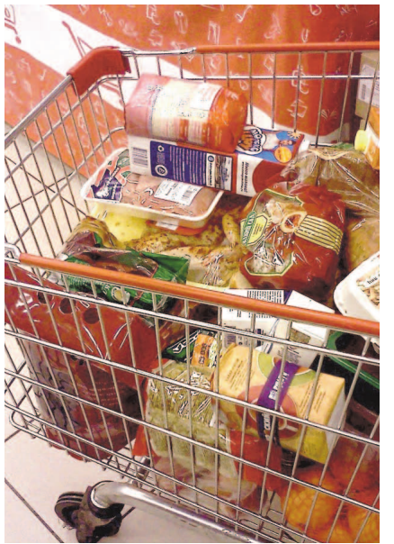
НА ФОТО: ТАКАЯ РОСКОШЬ БОЛЬШЕ НЕ ПО КАРМАНУ

— Наверяд ли лучшую жизнь дождутся сибирские регионы, где газифицировано лишь 10% территории, а жилье отапливается дровами. «Щедрость» президента — закрепить в Конститу-