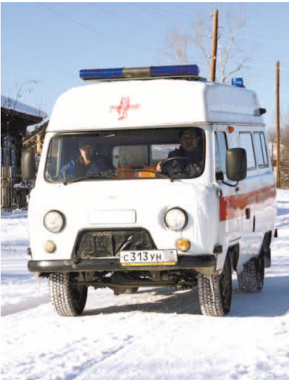
НА ФОТО: МЕДИЦИНЕ НА СЕЛЕ ТРЕБУЕТСЯ НЕОТЛОЖНАЯ ПОМОЩЬ