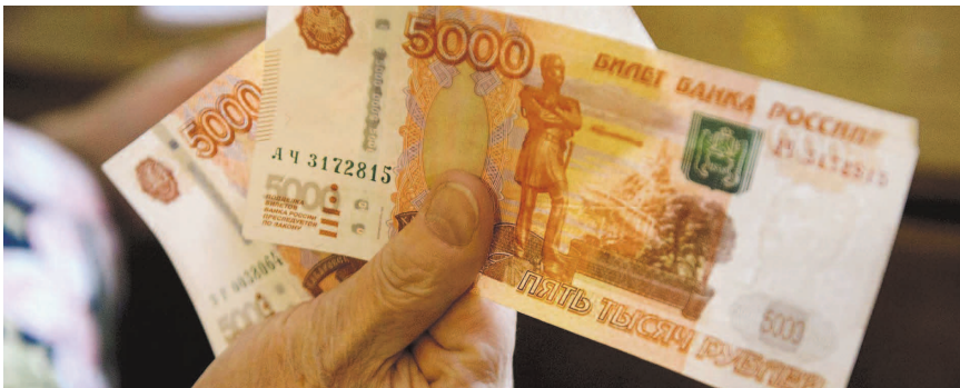
НА ФОТО: КАК ПРОЖИТЬ НА 10 ТЫС. РУБЛЕЙ В МЕСЯЦ?

— Проблема здесь не в самих фигурах. Проблема здесь в деньгах Пенсионного фонда, — подчеркнул он. — Дело в том, что в закромах ПФР на самом деле очень много денег. И такой рокировкой власть, с одной стороны, пытается понизить градус социальной напряженности, подарив пенсионерам абсолютно призрачную надежду на