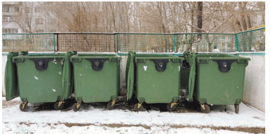
НА ФОТО: ЗА МУСОР ПЛАТЯТ БЕДНЫЕ, БОГАТЫЕ НА НЕМ ЗАРАБАТЫВАЮТ

— Два года назад, когда проходили законодательные инициативы и принимали нормативные документы, я прекрасно понимал, что государство