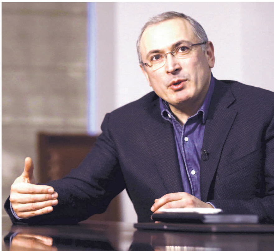
НА ФОТО: НЕПОМЕРНЫЕ АППЕТИТЫ ХОДОРКОВСКОГО ОПЛАТЯТ ПРОСТЫЕ РОССИЯНЕ

По версии следствия, в девяностые Ходорковский, совместно с группой лиц, обманул государство на аукционе, присвоил себе контрольный пакет компании «ЮКОС», то есть более 57% акций, а затем через подконтрольные фирмы оформил эти активы на несколько иностранных фирм. Будучи мажоритарными акционерами, Ходор-