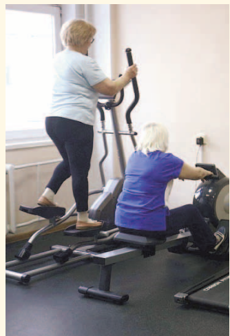
НА ФОТО: НОВОСИБИРСК ЗА АКТИВНОЕ ДОЛГОЛЕТИЕ