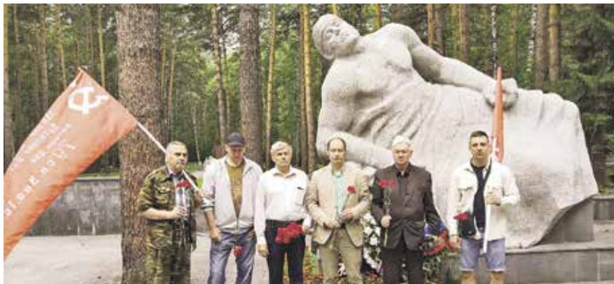
НА ФОТО: КОММУНИСТЫ ЗАЕЛЬЦОВСКОГО РАЙОНА У МЕМОРИАЛА «РАНЕНЫЙ ВОИН»

22 июня, в День памяти и скорби, жители Новосибирска вспоминали тех, кто 82 года назад принял на себя удар гитлеровской армии.