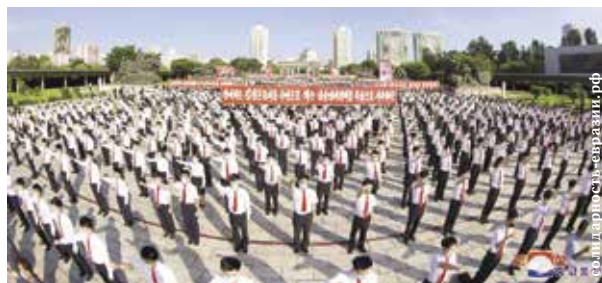
НА ФОТО: ПО СЛУЧАЮ ДНЯ БОРЬБЫ С АМЕРИКАНСКИМИ ИМПЕРИАЛИСТАМИ 25 ИЮНЯ ПРОШЕЛ МИТИНГ ЖИТЕЛЕЙ В ПХЕНЬЯНЕ

В КНДР есть свой «День памяти и скорби», также отмечаемый в конце июня: 25 июня 1950 года началась Корейская война. В Пхеньяне по этому поводу прошел массовый митинг.