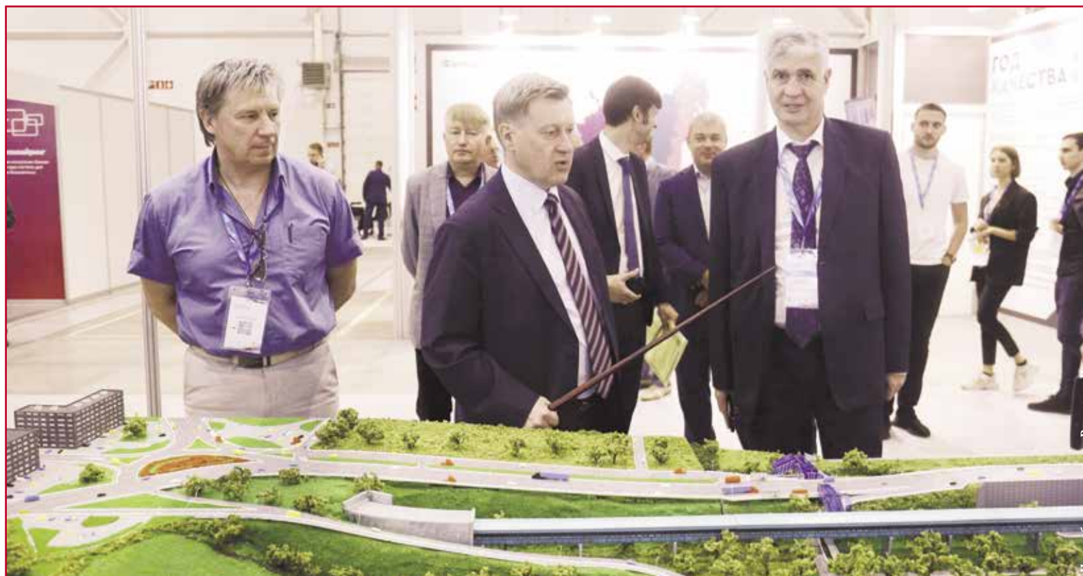
НА ФОТО: МЭР НОВОСИБИРСКА АНАТОЛИЙ ЛОКОТЬ НА IX МЕЖДУНАРОДНОМ СИБИРСКОМ ТРАНСПОРТНОМ ФОРУМЕ