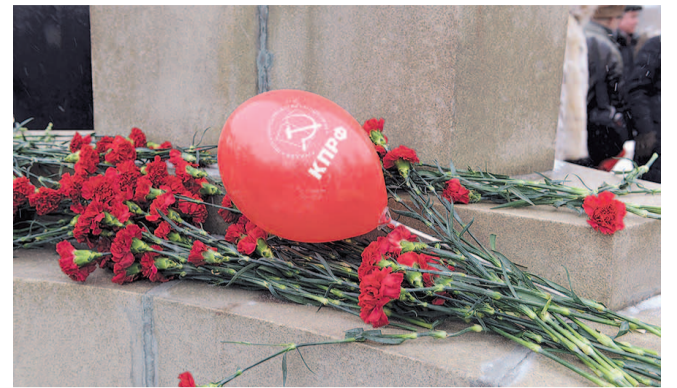
НА ФОТО: КОММУНИСТЫ ПРИНЕСЛИ ЦВЕТЫ К БЮСТУ ПОКРЫШКИНА

— 100 лет — большой период, и нельзя сказать, что он был устал розами. Были трудности, были временные поражения, но были и оглушительные победы, была Великая Победа, которая спасла и нашу страну, и весь мир от фашизма, от раскола, от большой войны. Это сделала наша народная Красная Армия. 100 лет назад под Нарвой и Псковом создавались первые военные части регулярной Красной Армии. Сегодня нам смешно слушать, когда некоторые псевдоисторики и политтехнологи пытаются оспорить эти события — их результатом стала победа в Гражданской войне, переход основного костяка офицерского корпуса старой армии на сторону народа. В этом наша сила, всегда армия была поддержана народом, мы были вместе. Выступление Анатолия Локтя несколько раз прерывалось возгласами «Ура!» А следом выступил Евгений ГРИГОРЬЕВ — молодой коммунист из Первомайского района, доверенное лицо партии КПРФ на президентских выборах: