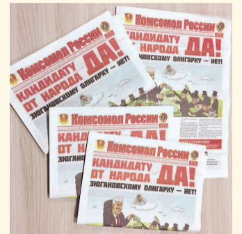
НА ФОТО: ПРОДАЖНАЯ ПРЕССА

Материал имеет целый букет вопиющих нарушений избирательного законодательства. В букете — использование фотопортрета и карикатуры на Павла ГРУДИНИНА, поливание грязью и весь набор «черной мифологии» про Совхоз имени Ленина, игнорирование оплаты материала из избирательного фонда наряду с агитацией за СУ-