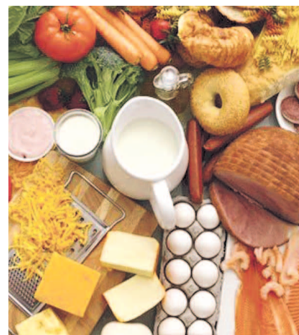
НА ФОТО: КАКАЯ ЕДА — ПОЛЕЗНАЯ?

Но даже проверку минимальной безопасности (токсичности) продуктов разрешили проводить надзорным