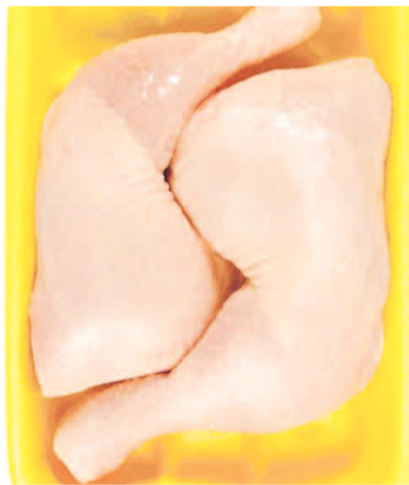
НА ФОТО: ОПАСНЫЕ НОЖКИ

— Массовые нарушения, выявленные «Росконтролем», могут свидетельствовать о системном кризисе в отрасли, несоблюдении технологий выращивания птицы, нарушениях санитарных правил и технологии производства полуфабрикатов, сроков и температурных режимов транспортировки, хранения и реализации пище-