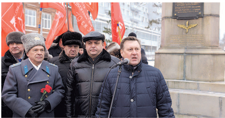
НА ФОТО: ВЫСТУПАЕТ МЭР НОВОСИБИРСКА АНАТОЛИЙ ЛОКОТЬ