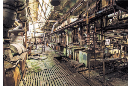
НА ФОТО: ЦЕХ «СИБСЕЛЬМАША»

А Новосибирский завод полупроводниковых приборов и НПО «Союз» , на которых трудилось несколько десятков тысяч человек,