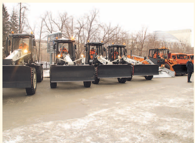
НА ФОТО: НОВАЯ ТЕХНИКА ПОСЛУЖИТ ГОРОДУ