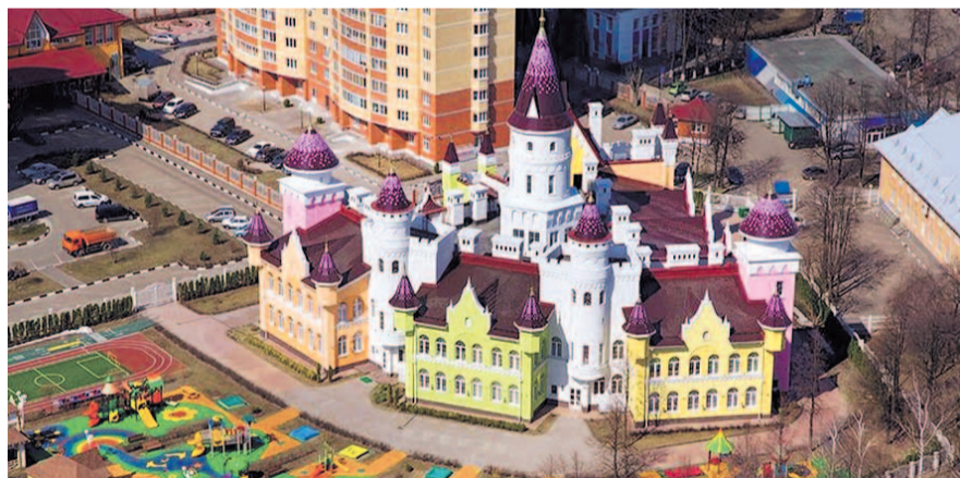
НА ФОТО: ТАК ВЫГЛЯДИТ ДЕТСКИЙ САД В СОВХОЗЕ ИМ. ЛЕНИНА

Вбросили вторую тухлую утку: ГРУДИНИН олигарх, и он не может представлять интересы народа. Ответ во-