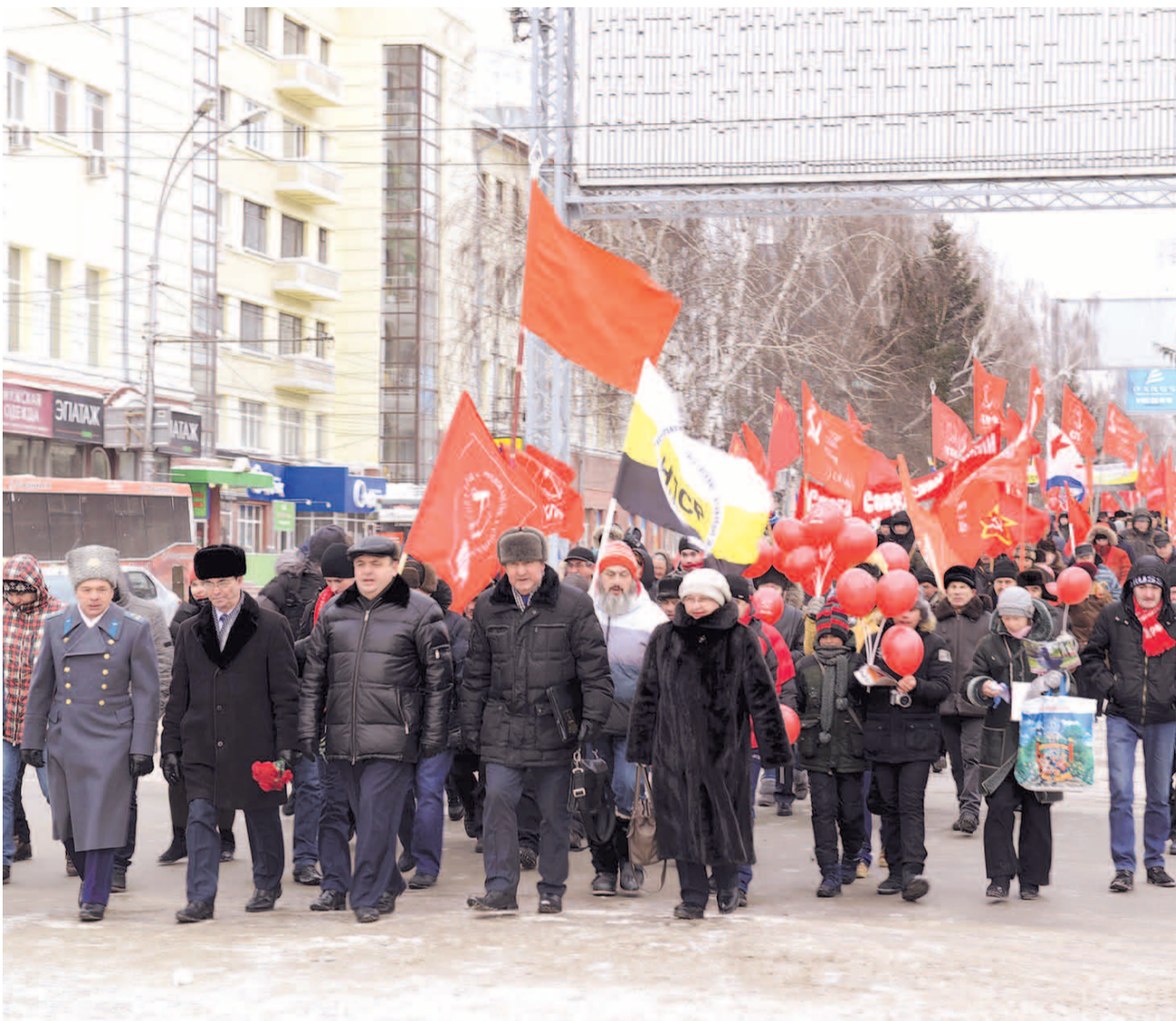
НА ФОТО: КОЛОННА КПРФ И НПСР ПРОШЛА МАРШЕМ ПО КРАСНОМУ ПРОСПЕКТУ