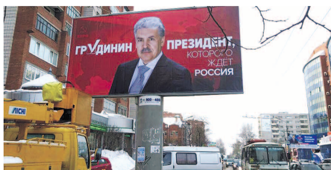
НА ФОТО: ДЕМОНТАЖ БАННЕРА В ТОМСКЕ