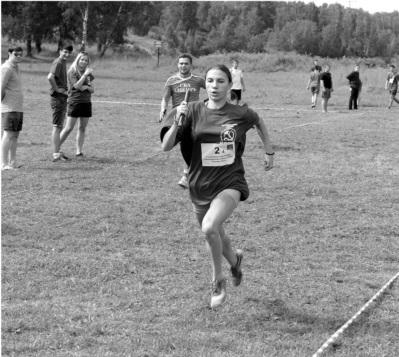
НА ФОТО: ВПЕРЕД, К ПОБЕДЕ!