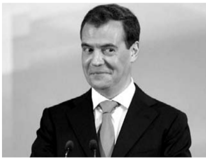
НА ФОТО: ЛИДЕР «ЕДИНОЙ РОССИИ»

какие-то другие средства, о которых не знают ни Государственная дума, ни правительство в целом. А регионы сегодня тонут в долгах, имея «на своей шее» майские указы президента, совершенно не обеспеченные никакой финансовой поддержкой. Работая в бюджетном комитете, я хорошо знаю, что денег на оказание финансовой помощи нет. Думаю, что это — очередной пустой разговор в преддверии выборов: нужно любым путем провалить «правящую партию» и остаться у власти!