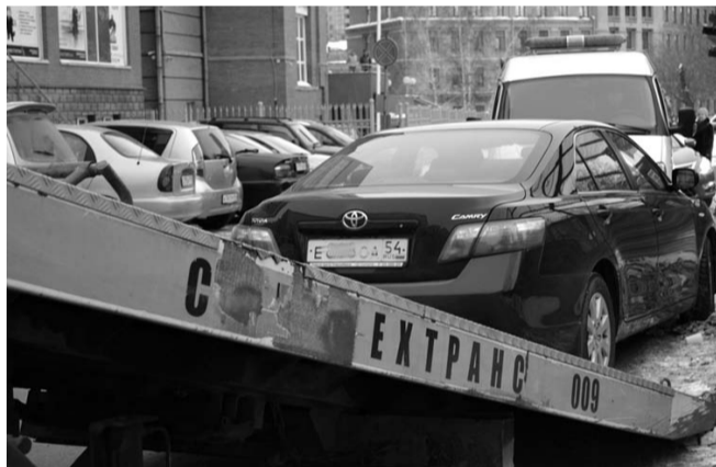
НА ФОТО: БОРЬБА С НАРУШИТЕЛЯМИ ИЛИ ОЧЕРЕДНАЯ «КОРМУШКА»?