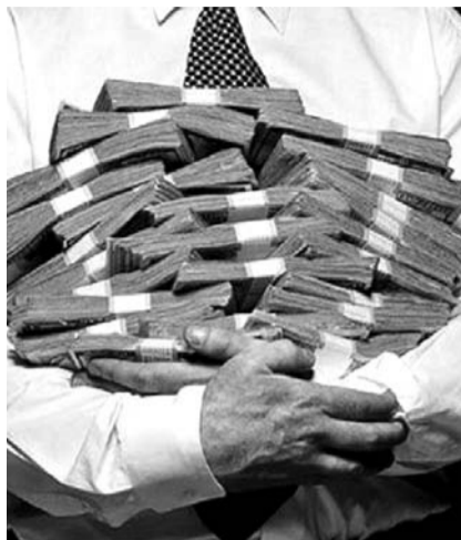
НА ФОТО: ДЕНЬГИ К ДЕНЬГАМ?

К такому результату привело падение реальных зарплат граждан — за год они уменьшились на 13,2%. При этом число россиян, которым не хватает денег даже на покупку еды, достигло максимального за последние шесть лет уровня. Неприятным маркером процесса массового обеднения стали изменения в речи, которые зафиксировали специалисты. В разговорах появились