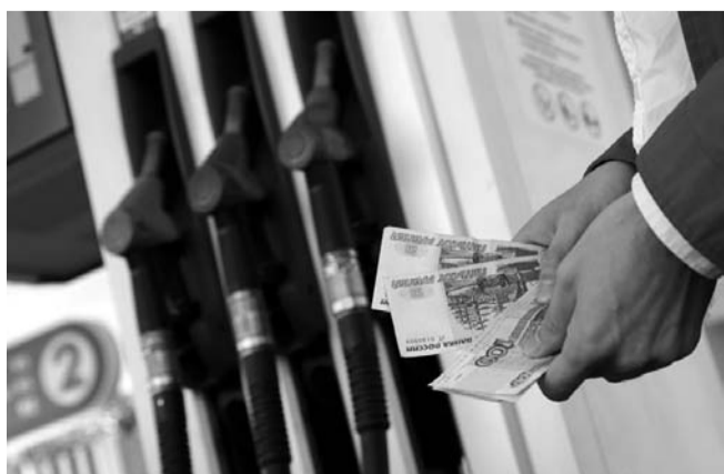
НА ФОТО: ЦЕНА НА ТОПЛИВО СТРЕМИТЕЛЬНО РАСТЕТ