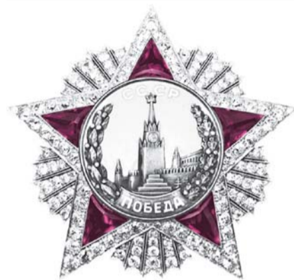
НА ФОТО: ОРДЕН «ПОБЕДА»

Свой орден очень нужен был главному герою в стране — труженику войны, и 08.11.1943 года был учрежден орден Славы. Он считался знаком воинской зрелости и мастерства. Им награждались за храбрость, мужество и бесстрашие. Орден 1-й степени изготавливался из золота, 2-й — из серебра с позолоченным кругом, 3-й — только из серебра. Лица, награжденные орденом