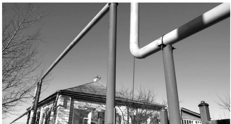
НА ФОТО: СТОИМОСТЬ КИЛОМЕТРА ГАЗОПРОВОДА ЗАВЫШЕНА В ТРИ РАЗА