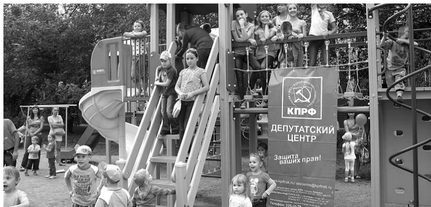
НА ФОТО: ВО ДВОРАХ ПЯВЛЯЮТСЯ НОВЫЕ ДЕТСКИЕ ПЛОЩАДКИ

Мэр внимательно выслушал информацию об озеленении территории — высажены 54 березы, 31 сосна, 2 яблони,