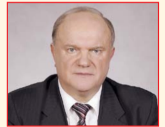
НА ФОТО: ГЕННАДИЙ ЗЮГАНОВ

15 ноября лидер КПРФ прокомментировал по просьбе журналистов задержание министра экономического развития РФ Алексея УЛЮКАЕВА , обвиненного в коррупции.