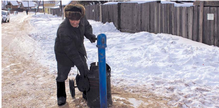
НА ФОТО: ДАЖЕ ТАКАЯ КОЛОНКА С ПИТЬЕВОЙ ВОДОЙ ЕСТЬ НЕ В КАЖДОЙ ДЕРЕВНЕ

Как следует из отчета регионального управления Роспотребнадзора за девять месяцев 2016 года, каждый четвертый житель Новосибирской области не обеспечен чистой водой. Наиболее остро эта проблема стоит в сельской местности.