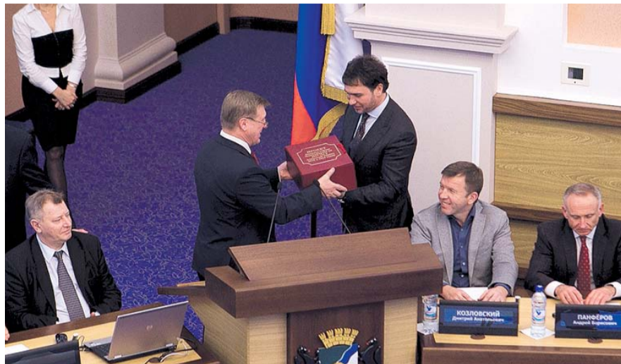
НА ФОТО: МЭР АНАТОЛИЙ ЛОКОТЬ ПЕРЕДАЛ ДЕПУТАТАМ ПРОЕКТ БЮДЖЕТА

вам Анатолия Локтя, последние два года сохраняет социальную направленность («защищенные статьи расходов, как, например, оплата труда работников бюджетной сферы, социальные выплаты и ряд других в будущем году составят 73% от всех расходов, и предполагается, что эта доля будет расти), однако на протяжении этого времени город живет без «бюджета развития». В частности, градоначальник привел примеры, когда глобальные задачи, такие, как строительство на территории города новых школ, расселение ветхих домов (в текущем году расселена 351 семья) удалось решить при финансировании со стороны региона и федерального центра. Существует договоренность с региональной властью относительно благоустройства 130 дворовых территорий.