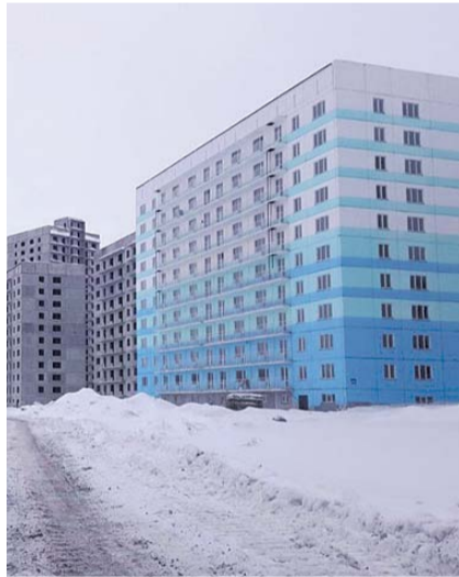
НА ФОТО: ДОМА РАСТУТ НА ГЛАЗАХ, А КТО ПОДУМАЕТ ОБ ИНФРАСТРУКТУРЕ?

Глава города подчеркнул, что у муниципалитета нет возможностей накладывать обременение на застройщика в плане строительства социальных объектов. Но есть другой механизм, который использует городская власть.