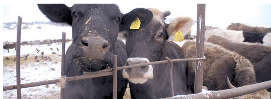
НА ФОТО: БОЛЬНЫХ ЖИВОТНЫХ НЕ СПЕШАТ ЗАБИВАТЬ