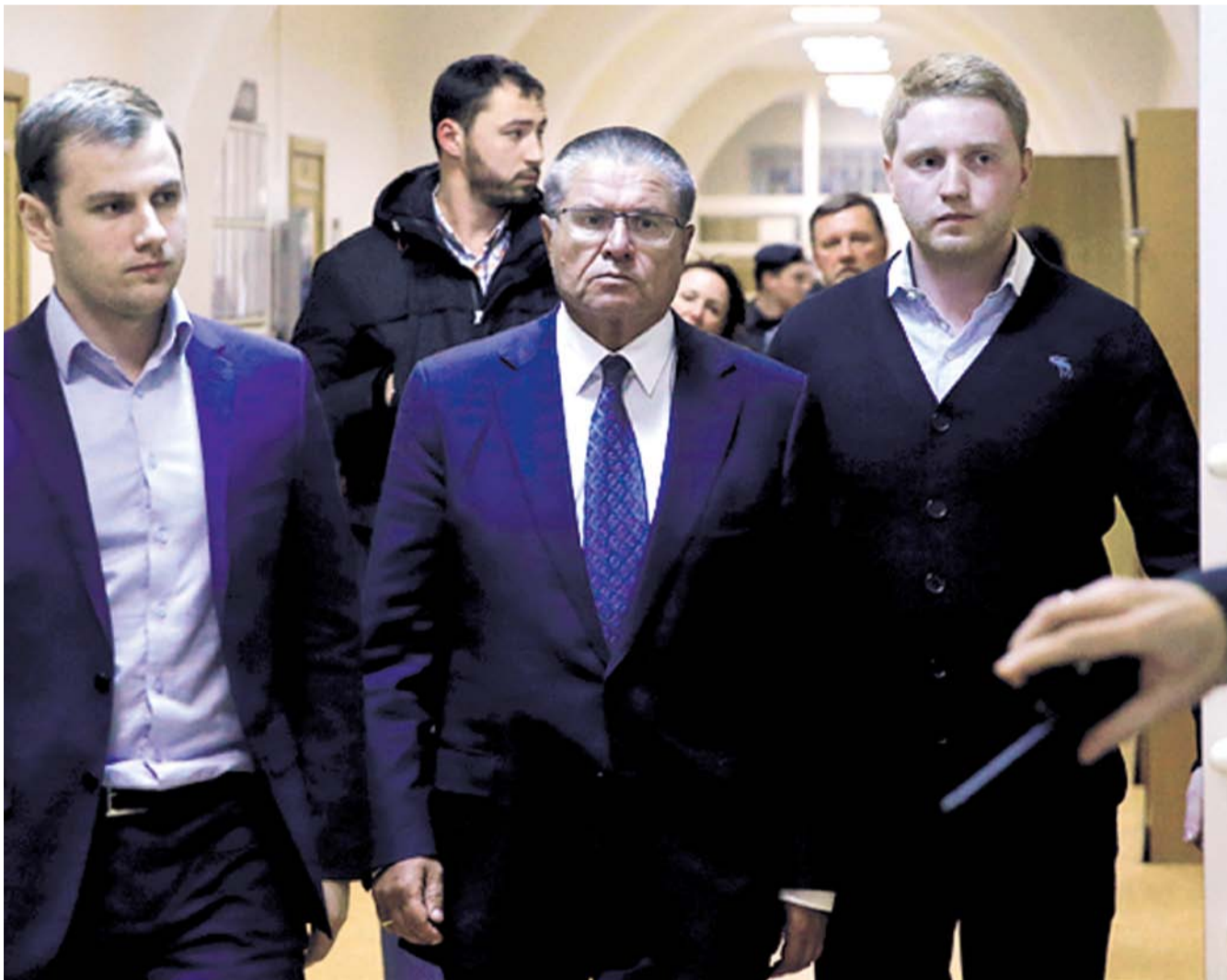
НА ФОТО: ЭКС-МИНИСТРА АЛЕКСЕЯ УЛЮКАЕВА ВЕДУТ В ЗАЛ БАСМАННОГО СУДА