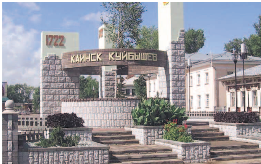
НА ФОТО: В СОВЕТСКИЕ ВРЕМЕНА ГОРОД ПРОЦВЕТАЛ

В 1948 году в городе началось строительство Барабинской ГРЭС, а уже в