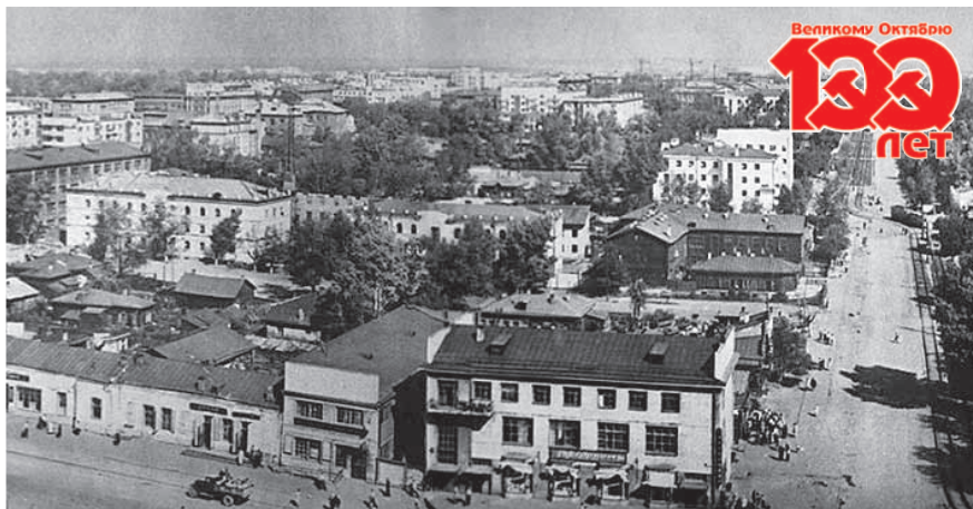
НА ФОТО: ПАНОРАМА НОВОСИБИРСКА В 1930-Х

Название Октябрьского района Новосибирска и его улиц непосредственно связаны с событиями и героями Великого Октября.