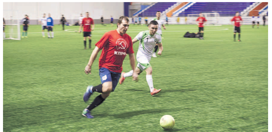
НА ФОТО: В УПОРНОЙ БОРЬБЕ КОМАНДА КПРФ ЗАНЯЛА III МЕСТО

— Некоторые из команд играют в различных лигах по мини-футболу, но не совсем профессиональным командам это ничуть не мешает показать красивый футбол.