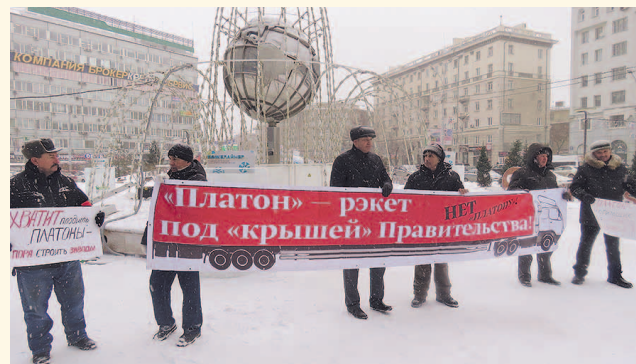
НА ФОТО: «ПЛАТОН» — ЕЩЕ ОДИН НАЛОГ