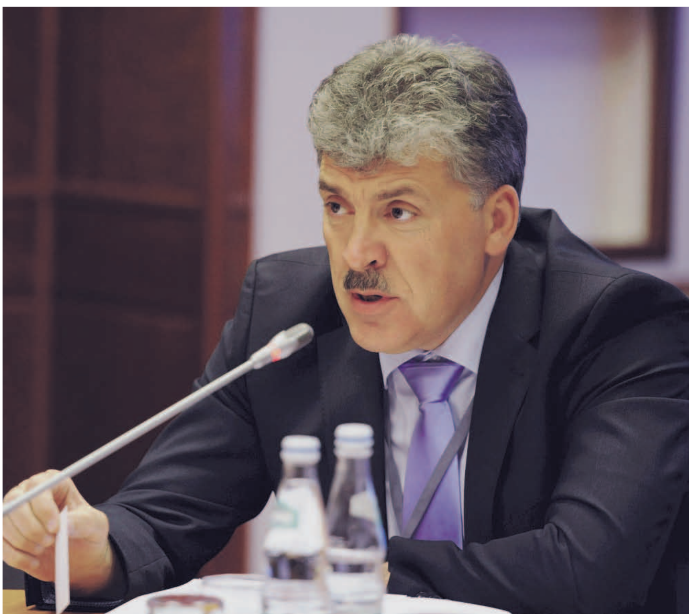
НА ФОТО: КАНДИДАТ В ПРЕЗИДЕНТЫ ОТ КПРФ ПАВЕЛ ГРУДИНИН