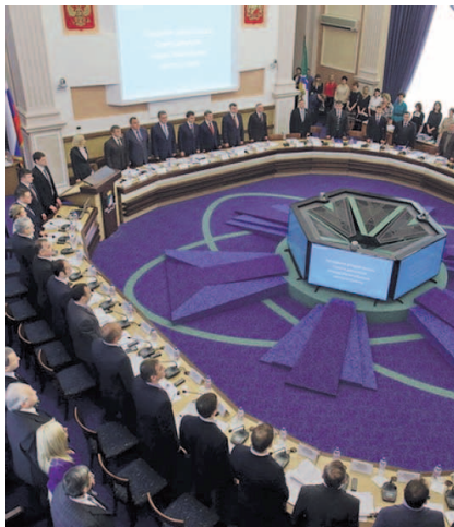
НА ФОТО: НА СЕССИИ ГОРСОВЕТА

— В дальнейшем вернемся к вопросу изменения нормативов отчисления НДФЛ в сторону увеличения в пользу Новосибирска. Пока такой возможности я не вижу — нужно снизить госдолг региона. Мы будем изыскивать возможности для финансирования проектов Новосибирска, — ответил Андрей Травников.