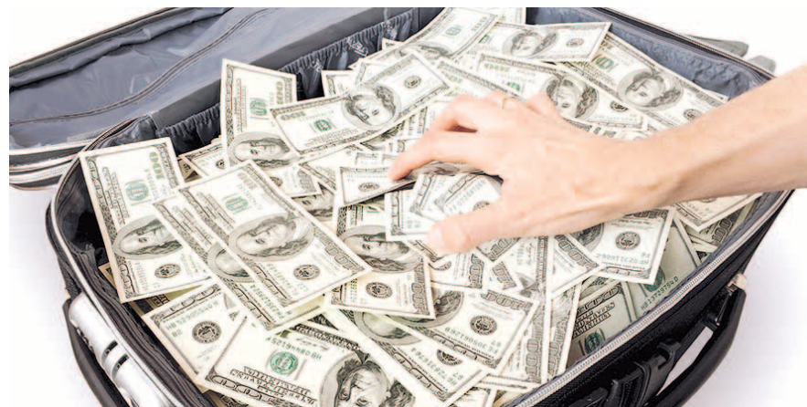
НА ФОТО: МИНФИН НАДЕЕТСЯ, ЧТО ОЛИГАРХИ ПЕРЕВЕДУТ КАПИТАЛЫ В РОССИЮ