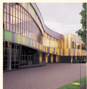
НА ФОТО: ШКОЛА В СОВХОЗЕ