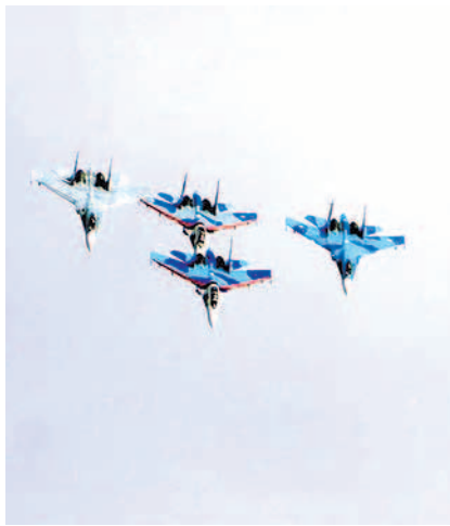
НА ФОТО: НА АВИАШОУ В МОЧИЩЕ

Вначале создания Советского государства авиация развивалась семимильными шагами, популярность ее среди