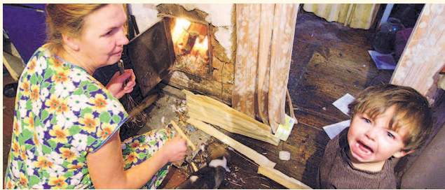
НА ФОТО: СЛОЖНО ВОСПИТАТЬ ЧЕЛОВЕКА, КОГДА ЕСТЬ НЕЧЕГО