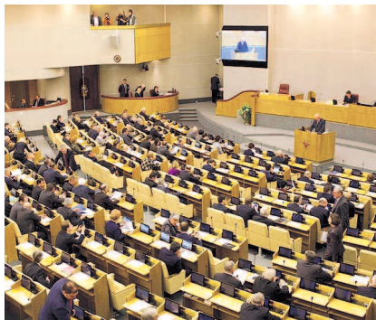
НА ФОТО: НА СЕССИИ ГОСДУМЫ

В этом году Государственная дума приняла закон об эскроу-счетах, которые сводят на нет возможности застройщиков обогатиться за счет средств дольщиков, не предоставив им жилья. Обмануть людей у недобросовестных бизнесменов не получится! Конечно, это повлечет за собой рост цен на новое жилье, но собственники будут защищены. Не будет такого ко-