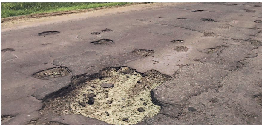
НА ФОТО: КТО ПРИДУМАЛ ТАКИЕ «ИННОВАЦИИ»?

В администрации Карасукского района сообщили, что ремонтные работы на участке ведут подрядчики Территориального управления автодорог (ТУАД) Новосибирской области. Ремонт дороги соломой занимались сотрудни-