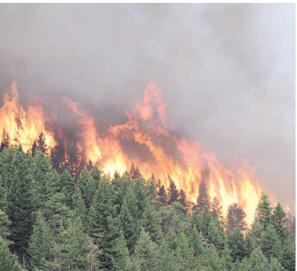
НА ФОТО: ОГОНЬ НЕ ОСТАНОВИТЬ

Депутат считает, что главная причина пожаров — несовершенство нормативной базы. Она рассказала, что в ходе внесения изменений в Лесной кодекс полностью «оптимизировали» службу лесоохраны. Полностью по тушению лесных пожаров возложили на регионы. В 2009 году леса перешли в муниципальную собственность и в частные руки, их стало можно арендовать. У регионов нет средств на контроль огромных территорий, поэтому «черные лесорубы» безнаказанно вывозят лес в Китай.