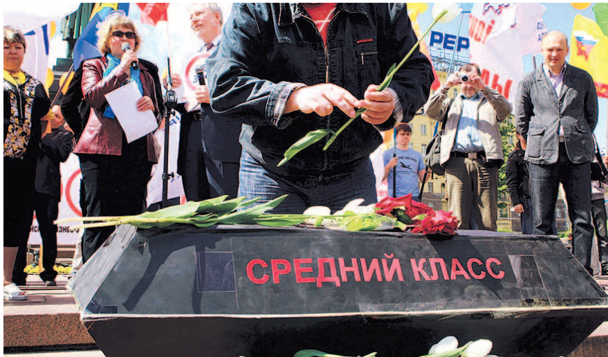
НА ФОТО: СРЕДНИЙ КЛАСС, ОСНОВА ОБЩЕСТВА, СКОРЕЕ МЕРТВ, ЧЕМ ЖИВ

Однако Новосибирская область обогнала Омскую область с 11,4% (43