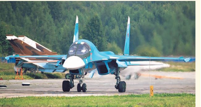
НА ФОТО: СУ-34 НА ВЗЛЕТНОЙ ПОЛОСЕ ЗАВОДА ИМ. ЧКАЛОВА