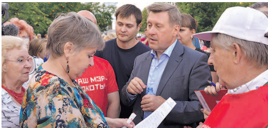
НА ФОТО: АНАТОЛИЙ ЛОКОТЬ ГОТОВ ОТВЕТИТЬ НА ВОПРОСЫ НОВОСИБИРЦЕВ

Этот объект достался мэру-коммунисту в наследство. При жесточайшем