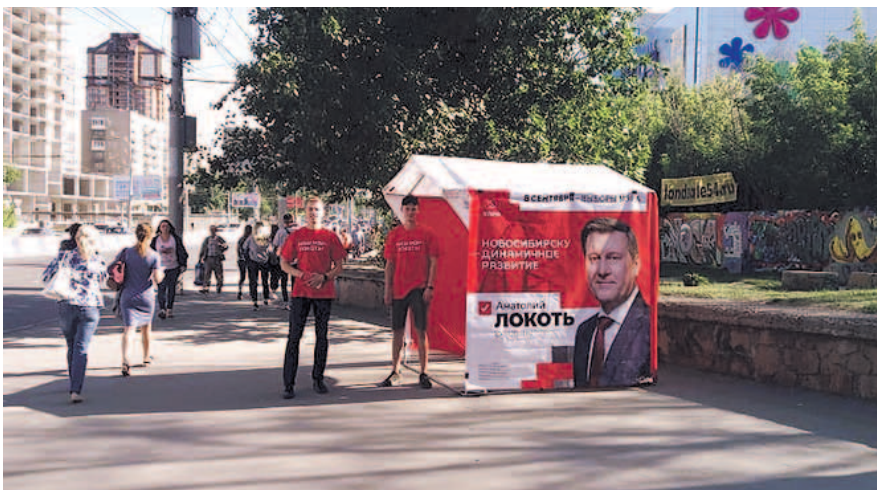
НА ФОТО: ПАЛАТКА КОММУНИСТОВ В ЗАЕЛЬЦОВСКОМ РАЙОНЕ

В силу специфики района пикеты проходят в разных его частях — ОбьГЭС, Нижней Ельцовке, Верхней зоне Академгородка. А коммунисты Ново-