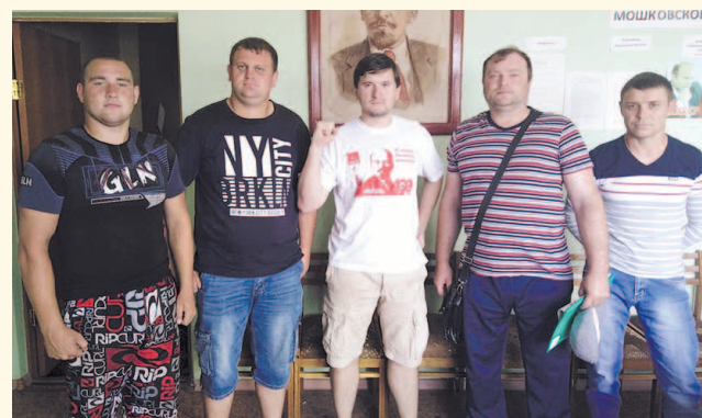
НА ФОТО: ЧЛЕНЫ НОВОГО ПЕРВИЧНОГО ОТДЕЛЕНИЯ