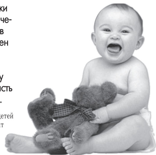
■ НА ФОТО: ДЕТИ — САМЫЕ БЕЗЗАЩИТНЫЕ

Шанхае этот проект уже был представлен как официальный курс России в сфере детской политики.