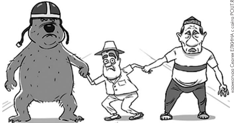
■ НА РИС.: НАРОДНЫЙ ФРОНТ — САМЫЙ ДОБРОВОЛЬНЫЙ ФРОНТ В МИРЕ

Против кого будет сосредоточен удар такого фронта? Беспорно — против левой оппозиции в лице коммунистов. Наступление уже начато в развернувшейся кампании «десталинизации» и фальсификации истории, прежде всего советского периода. Надо проявлять особую бдительность, поскольку конечной целью в этой цепи является ликвидация КПРФ, которая, как кобель в горле, мешает довести реформирование России по западным рецептам. Пора бы осознать простым гражданам, что дикий воровской капитализм создал на российских просторах два народа с диаметрально противоположным социальным положением и интересами. Разглагольствования Медведева, Путина и их с ними о свободе и демократии — миф. Тому много примеров. Столпами властных структур считались С.М. МИРОНОВ, Н.С. МИХАЛИКОВ, но потерпели фиаско за критику представителей партии власти и правительства. А вот классический пример нетерпимости нынешней власти к правде. Стоило Л. РОШАЛЮ, честному, бесстрашному человеку в критической ситуации сказать о медицинской некомпетентности лица правительственного масштаба, как свора лизоблюдов, мягко говоря, бросилась осуждать заслуженного врача, известного своим профессионализмом и за пределами России.