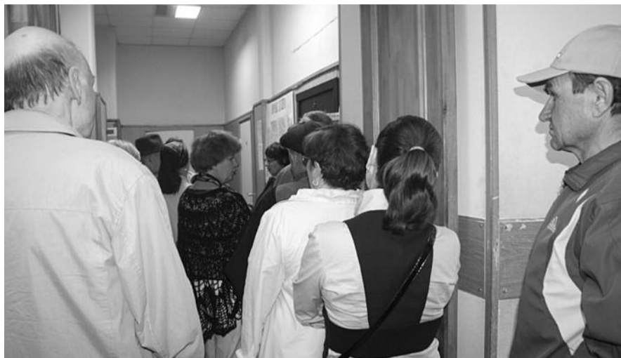
■ НА РИС.: ТАКИЕ ОЧЕРЕДИ ВЫСТРАИВАЮТСЯ В ОФИСЕ ОБСЛУЖИВАНИЯ СОЦИАЛЬНЫХ КАРТ

Перекроенная областным правительством программа льготного проезда продолжает оборачиваться новыми проблемами для новосибирских пенсионеров. В офисе обслуживания социальных карт выстраиваются огромные очереди, а деньги со вчерашних льготников собирают за два месяца вперед. Кто придумал такую систему и где крутятся деньги льготников, которыми они расплачиваются за будущий июль (!), остается для пенсионеров загадкой.