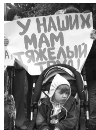
● НА ФОТО: ДЕТЕМ-ИНВАЛИДАМ НУЖНА ПОДДЕРЖКА ВЛАСТЕЙ

В День защиты детей родители инвалидов с ДЦП организовали протестную акцию напротив здания представительства полпреда президента в СФО Виктора ТОЛОКОНСКОГО .