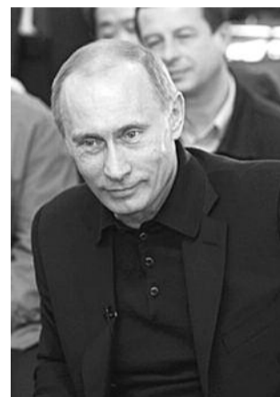
■ НА ФОТО: «МЫ ЕЩЕ НЕ РАЗОБРАЛИСЬ С ИТОГАМИ ПЛАНА ПУТИНА, А ТУТ «ФРОНТ»