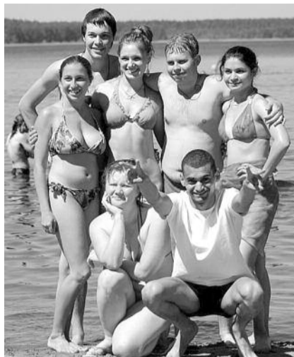
● НА ФОТО: ТУСОВКА НА СЕЛИГЕРЕ ОБОЙДЕТСЯ БЮДЖЕТУ СТРАНЫ В 178 МЛН. РУБЛЕЙ

— Страна не может выкарабкаться из экономического кризиса. Сокращаются социальные статьи в бюджете, государство отказывается от бесплатного образования для огромного количества молодых людей, родители которых через пару лет неспособны будут платить даже за среднее образование, не говоря уже об образовании высшем. У нас в Новосибирской области пенсионеры лишены заслуженного льготного проезда — это все государственные деньги, которые тратятся бездумно и своевольно.