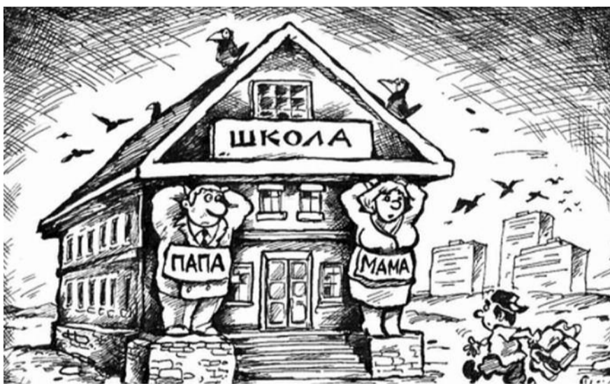
■ НА РИС.: С 1 СЕНТЯБРЯ ПЛАТА ЗА ОБРАЗОВАНИЕ ЛЯЖЕТ НА ПЛЕЧИ РОДИТЕЛЕЙ ШКОЛЬНИКОВ

— Некоторые просто не владеют информацией о нем, поскольку в СМИ эта тема практически не освещается. Я и мои товарищи-педагоги, кто понимает, что школа будет вынуждена существовать лишь за счет поборов с родителей, разъясняем это остальным. Родителям тоже говорим, что бесплатно их дети получают знания только по минимуму предметов. Если бы профсоюз работников образования выступил инициатором протеста, учителя вышли бы на улицы. Но профсоюзы сейчас настолько беззубы, что не способны решить этой проблемы. Все возмущаются, ужасаются. Родители открыто на собраниях говорят: «Сколько можно издеваться над детьми»? Некоторые надеются, что, как говорится, пронесет, и закон все же действовать не начнет. Однако факты, которыми обмениваются учителя из разных школ, свидетельствуют об обратном. В нашей школе