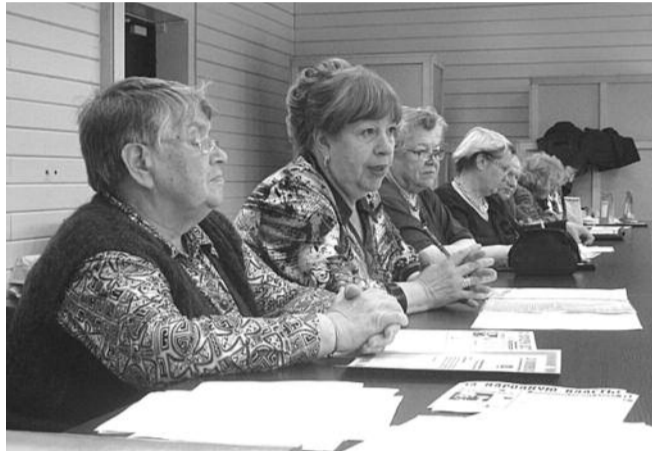
■ НА ФОТО: РАСПРОСТРАНТЕЛИ ПАРТИЙНОЙ ПЕЧАТИ НА СЕМИНАРЕ

27 мая, в пятницу в помещении обкома КПРФ состоялся 2-й семинар распространителей партийной печати в городе Новосибирске. Предыдущий семинар состоялся более года назад и собрал не только жителей Новосибирска, но и крупных райцентров области. В этот раз опытом делились городские райкомы КПРФ.