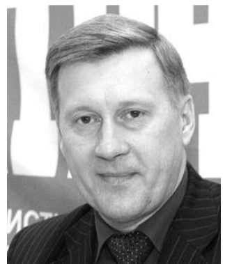
● НА ФОТО: АНАТОЛИЙ ЛОКОТЬ

«То, что происходит сейчас в Белоруссии, — в определенной степени следствие создания Таможенного союза. При отсутствии таможенных пошлин изначально низкие цены на качественные белорусские продукты и товары должны были вырасти до уровня российских. В результате спрос на дешевую и качественную продукцию резко возрос, и российские граждане поспешили этим воспользоваться.