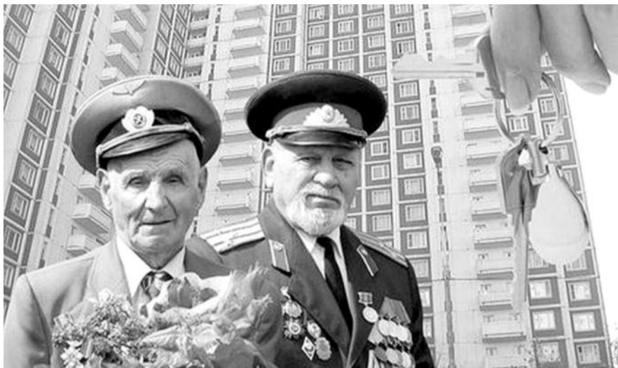
■ НА ФОТО: ВЕТЕРАНОВ ВЕЛИКОЙ ОТЕЧЕСТВЕННОЙ ВОЙНЫ В ОЧЕРЕДНОЙ РАЗ ОБМАНУЛИ?

В результате таких «реформ» растет общая неграмотность. Среди детей таких