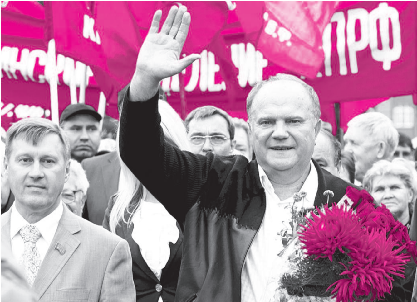
● НА ФОТО: ГЕННАДИЙ ЗЮГАНОВ И АНАТОЛИЙ ЛОКОТЬ ПЕРЕД ВОЗЛОЖЕНИЕМ ЦВЕТОВ НА МОНУМЕНТЕ СЛАВЫ В НОВОСИБИРСКЕ 22 АВГУСТА