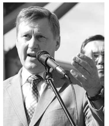
● НА ФОТО: АНАТОЛИЙ ЛОКОТЬ

Первый секретарь Новосибирского обкома КПРФ Анатолий ЛОКОТЬ , комментируя итоги работы совещания первых секретарей региональных отделений КПРФ, прошедшего в Новосибирске в рамках IV Съезда депутатов Сибири и Дальнего Востока, сообщил о задаче, поставленной перед отделением — избрать в Госдуму трех депутатов-коммунистов от Новосибирской области.