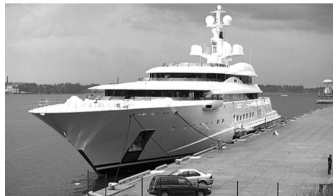
■ НА ФОТО: ЯХТА АБРАМОВИЧА СТОИТ 340 МИЛЛИОНОВ ЕВРО

Знаменитая крупнейшая в мире частная яхта Eclipse , принадлежащая российскому миллиардеру Роману АБРАМОВИЧУ , доставила своему хозяину неприятности в Антибе на французском Лазурном берегу. Из-за гигантских размеров судна для него не нашлось места в «бухте миллионеров» — самой большой в Европе гавани для яхт с более чем 2 тысячами причалов.