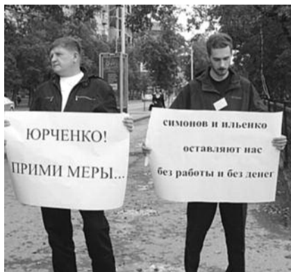
● НА ФОТО: ТАКСИСТЫ ПРОСЯТ ПОМОЩИ

В центре Новосибирска на площади Ленина 22 августа состоялся пикет предпринимателей, занимающихся пассажирскими перевозками, и таксистов из Черепановского, Маслянинского и Сузунского районов области. Поводом акции протеста послужил новый закон, который скоро вступит в силу.