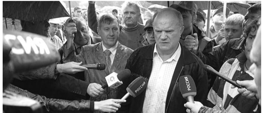
● НА ФОТО: ВИЗИТ ЛИДЕРА КПРФ В НОВОСИБИРСК ДОСТАТОЧНО ШИРОКО ОСВЕЩАЛСЯ В СМИ

Председатель ЦК КПРФ Геннадий ЗЮГАНОВ выступил