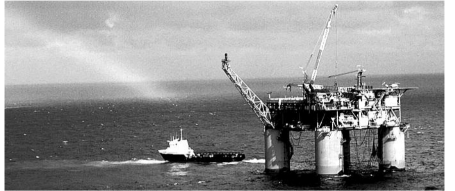
● НА ФОТО: В ПОГОНЕ ЗА ПРИБЫЛЬЮ НЕФТЕБАРОНЫ УВЛЕКЛИСЬ ЭКСПОРТОМ СЫРОЙ НЕФТИ

Почему государство добровольно отказалось от значительной части ренты в пользу пользователей недр? Известный экономист доктор экономических наук Рефат