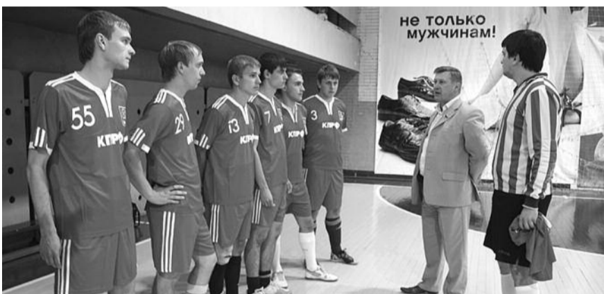
● НА ФОТО: НАГУСТВИЕ АНАТОЛИЯ ЛОКТО ПЕРЕД ПЕРВОЙ ИГРОЙ

Первый секретарь Новосибирского обкома уверен, что поддерживать спорт необходимо, так как без массовости проблеме здоровья нации не решить.