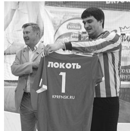
● НА ФОТО: ЛОКОТЬ — НОМЕР ОДИНИ

но такую цель команда новосибирских коммунистов ставит перед собой. Примером для новосибирской команды служит мини-футбольный клуб «КПРФ»,