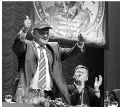
● НА ФОТО: ЗЮГАНОВ — НАШ ПРЕЗИДЕНТ!

На следующее утро Геннадий Зюганов, вернувшись с радио «Слово», где выступил в прямом эфире, принял участие в открытии нового здания Новосибирского обкома КПРФ на ул. Большевикской. Лидера компартии встречали 22 депутатские делегации из Сибири и Дальнего Востока. Торжественная часть завершилась поднятием флага КПРФ и исполнением гимна «Сибирского народного ополчения». Затем коммунисты воспользовались залом нового здания обкома, где состоялся рабочий семинар первых секретарей региональных отделений. Геннадий Зюганов поставил задачи для секретарей накануне выборов в Госдуму. В Новосибирской области коммунисты должны набрать 344 тыс. голосов. Только так можно будет гарантировать преобладание в Госдуме и решение задачи взятия президентского поста, формирования правительства Народного доверия.