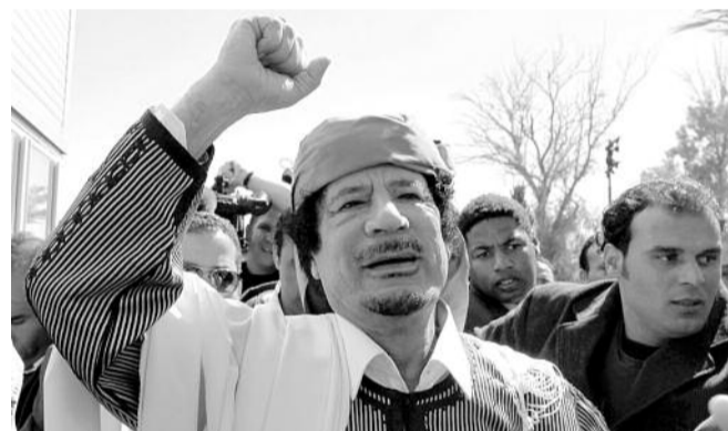
● НА ФОТО: МЕСТОНАХОЖДЕНИЕ ЛИВИЙСКОГО ЛИДЕРА НЕИЗВЕСТНО

Говоря о местонахождении полковника и его семьи, мировые СМИ ссылаются на президента Международной шахматной федерации (ФИДЕ), бывшего президента Калмыкии Кирсана ИЛЮМЖИНОВА , которому накануне, как он уверяет, удалось поговорить с Кадаffi по телефону. Тот сообщил, что «жив, здоров, находится в Триполи и не намерен покидать Ливию». Он также призвал «не верить лживым сообщениям западных телекомпаний».