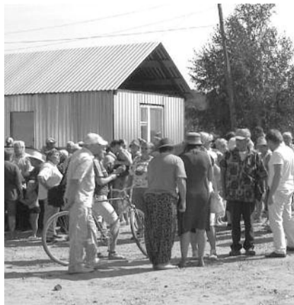
■ НА ФОТО: ЗДЕСЬ У САДОВОДОВ ТЕПЕРЬ СОБРАНИЯ ПОЧТИ КАЖДЫЙ ДЕНЬ

председатели садоводческих обществ «Маяк», «Темп», «Тополь», «Прибой», «Парус», которые официально и публично в установленном порядке внесли свои предложения по обсуждаемой проблеме. Однако, вопреки ожиданиям, их мнение было проигнорировано, и в окончательном варианте по результатам слушаний был