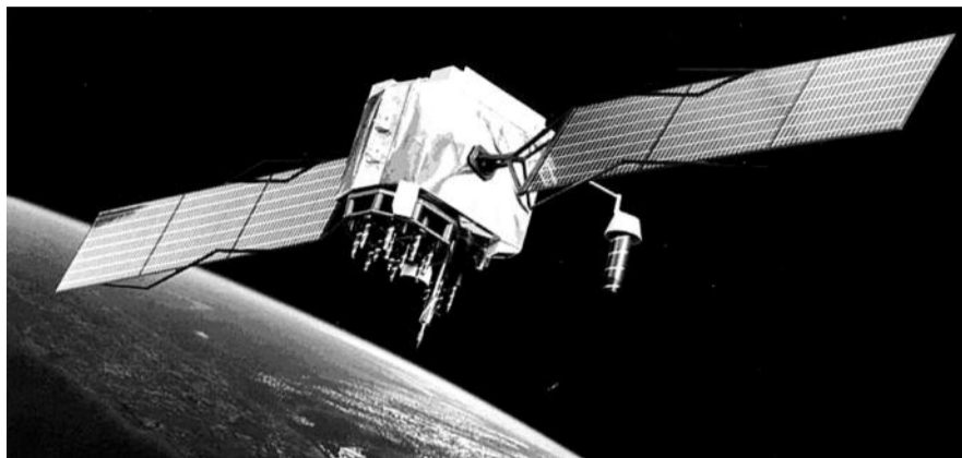
● НА ФОТО: ЗАПУСК «ЭКСПРЕСС-АМ4» СТАЛ ТРЕТЬЕЙ НЕУДАЧЕЙ РОССИИ

«За прошедшие с запуска с космодрома Байконур шесть суток так и не удалось установить связь с аппаратом с целью включения его бортовых систем. Вероятно, в ближайшее время, если подобные попытки не приведут к позитивному результату, будет сообщено о потере аппарата», — сказал источник агентства в