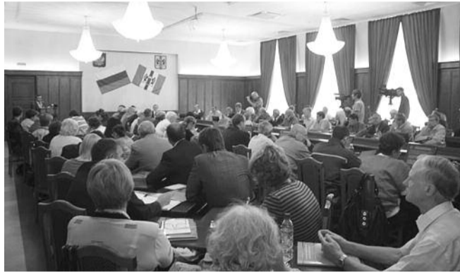
● НА ФОТО: НА КРУГЛОМ СТОЛЕ В МАЛОМ ЗАЛЕ ЗАКСОБРАНИЯ

В Новосибирске состоялся круглый стол, организованный фракцией КПРФ в Заксобрании и ВЖС «Надежда России» на острой тему для современного общества — тему образования. Коммунисты предложили сравнить два проекта закона об образовании — правительственный и проект фракции КПРФ в Госдуме. В работе круглого стола приняли участие депутаты Государственной думы Олег СМОЛИН и Нина ОСТАНИНА , а также депутаты региональных парламентов Сибири и Дальнего Востока.