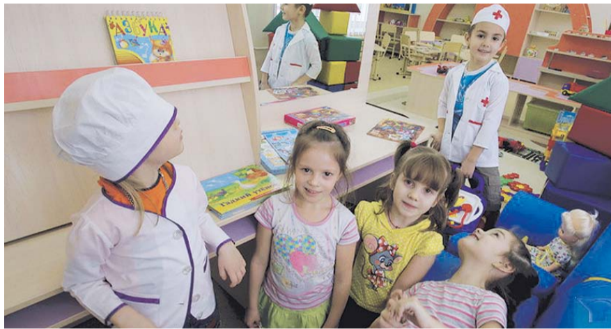
НА ФОТО: СОВРЕМЕННЫЙ И КОМФОРТНЫЙ ДЕТСКИЙ САД ДЛЯ МАЛЕНЬКИХ НОВОСИБИРЦЕВ

Два реконструированных здания — на ул. Тимирязева, 77а и ул. Тимирязева, 81 — вошли в состав МАДОУ «Детский сад №59». Теперь это один из крупнейших образовательных комплексов города, он состоит из 47 групп для более чем 1 тысячи детей.