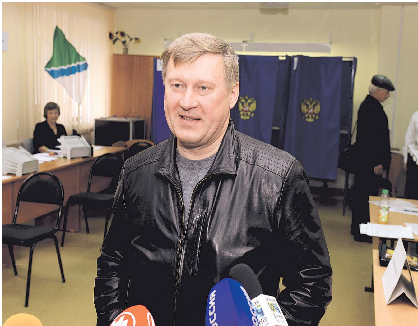
НА ФОТО: АНАТОЛИЙ ЛОКОТЬ НА ИЗБИРАТЕЛЬНОМ УЧАСТКЕ 13 СЕНТЯБРЯ