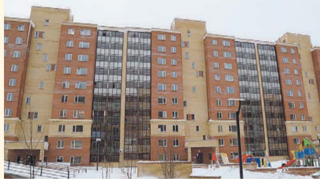
НА ФОТО: НОВОСЕЛЫ ПОЛУЧИЛИ КЛЮЧИ ОТ КВАРТИР В ЭТОМ ДОМЕ