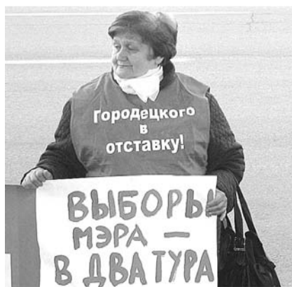
НА ФОТО: УЧАСТНИЦА ПИКЕТА

— На выборах мэра, главы любого города или поселения большое значение имеет, большая ли часть избирателей поддерживает того или иного кандидата, в том числе кандидата от власти, — пояснил позицию участников акции