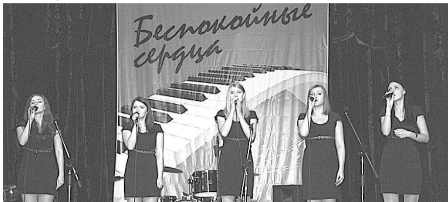
НА ФОТО: ПОБЕДИТЕЛИ ФЕСТИВАЛЯ В 2012 ГОДУ — АНСАМБЛЬ «СИНКОПА» (СИБГУТИ)

27 октября в преддверии Дня комсомола молодые таланты посоревнуются между собой в исполнении любимых песен комсомольцев советской эпохи и патриотических произведений современности.