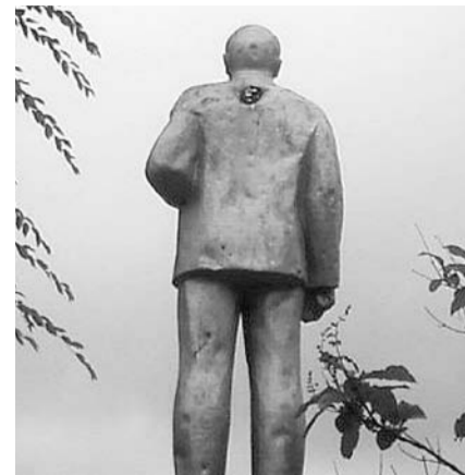
НА ФОТО: ОТВЕРСТИЕ В ПАМЯТНИКЕ — 6 СМ