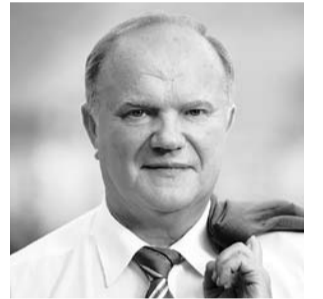
НА ФОТО: ЛИДЕР КПРФ

В жизни каждого народа и страны бывают события и даты, которые мы не вправе забывать. Исполняется 20 лет преступному ельцинскому Указу №1400. Пойдя на этот шаг, ЕЛЬЦИН поставил себя вне закона, он полностью узурпировал власть в стране. За этим указом последовал разгром всенародно избранных органов Советской власти и расстрел защитников Верховного Совета в Москве 3-4 октября 1993 года. Тогда погибли сотни людей. Ельцин и его поделщики совершили государственный переворот и пролили кровь в самом сердце страны.