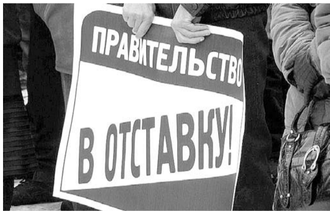
НА ФОТО: ЭТА ЛИБЕРАЛЬНАЯ КОМАНДА ДОЛЖНА УЙТИ В ОТСТАВКУ!

Нынешняя власть продолжает тащиться по старой ельцинской колее, не позволяя что-либо менять даже в ходе выборов <...>. Власть тратит массу сил на получение «правильного» результата в ходе выборов, и это вызвано серьезным сдвигом в массовом сознании <...>.