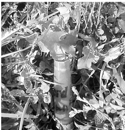
НА ФОТО: РЯДОМ ВАЛЯЛИСЬ ГИЛЬЗЫ

К сожалению, это не единственный акт вандализма по отношению к памятникам Ленину. Несколько лет назад жители поселка Белье Берега Брянской области обнаружили, что за ночь памятник около местного ДК неизвестные «художники» раскрасили в разные цвета. В Климовском районе той же