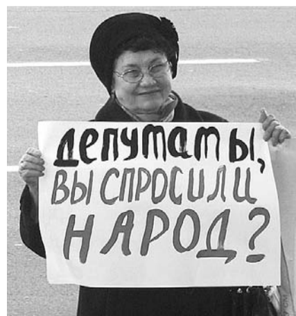
НА ФОТО: НАРОД — ПРОТИВ!

которой можно понять отношение жителей города к этим поправкам. Всем депутатам было роздано обращение шести политических партий — КПРФ, «Справедливой России», «Яблока», «Гражданской платформы», РГРП-ПАРНАС, которые также высказались против поправок. Мы все видим, что в стране от выборов к выборам идет неуклонное снижение явки, 8 сентября в Новосибирске на выборы пришло только 13% избирателей. Это означает, что подавляющее число избирателей не доверяет власти. Я думаю, что это происходит потому, что избирательное законодательство меняется перед каждыми выборами. Сначала отмена порога явки, потом отмена, а потом возвращение выборов губернаторов. Мы недавно внесли поправки в Устав о выборах 50% Совета по партийным спискам, а сейчас Госдума уменьшает партийные списки до 25%. Правила игры меняются в зависимости от политической конъюнктуры. Данные поправки приведут к снижению легитимности мэра. В западной политологии есть понятие порога легитимности. Если власть поддерживает менее 30%, то она нелегитимна. Мы уже подошли вплотную к этому порогу. В условиях