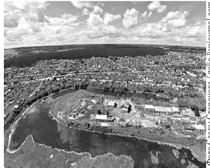
НА ФОТО: ЧЕРЕЗ 15-20 ЛЕТ БОЛЕЕ ПОЛОВИНЫ ЖИЛОГО ФОНДА СТАНЕТ ВЕТХИМ

Владимир ПУТИН неоднократно заявлял, что в стране необходимо создать не менее 25 млн новых современных рабочих мест. Принимая во внимание численность населения района, у нас за оставшиеся восемь лет нужно создать более 4500 рабочих мест. К сожалению, начиная с федерального уровня, эту инициативу президента власти просто игнорируют.