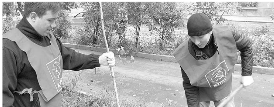
НА ФОТО: ВО ДВОРЕ ДОМА БЫЛИ ВЫСАЖЕНЫ МОЛОДЫЕ БЕРЕЗКИ И ОСИНКИ

Жители дома, прежде чем жаловаться в прокуратуру на муниципалитет, который не следит за своей территорией, решили привести в порядок придомовую «парковую» территорию. В первую очередь решили взяться за