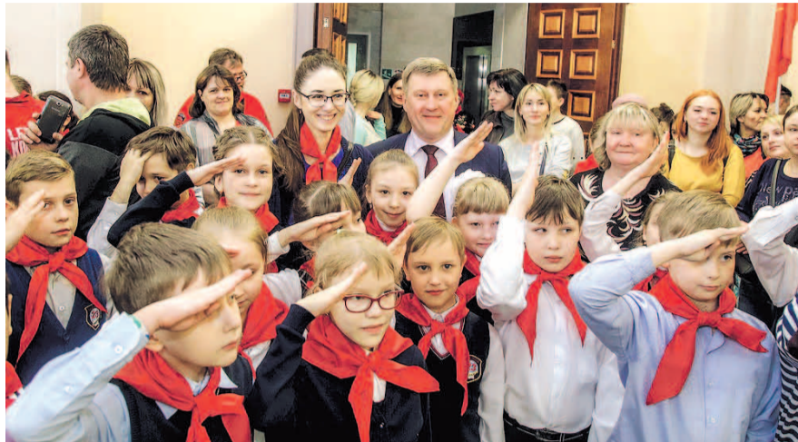
НА ФОТО: РЕБЯТАМ ПОВЯЗАЛИ КРАСНЫЕ ГАЛУСТУКИ В ДЕНЬ РОЖДЕНИЯ ПИОНЕРИИ