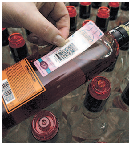
НА ФОТО: ОСТОРОЖНО, ПОДДЕЛКА!

Как правило, из-за низкого качества не соответствовали требованиям вкус, цвет, аромат... Но были и совсем уж вопиющие нарушения: производители 11 видов коньяка гнали его, как оказалось, не из коньячного, а из непищевого спирта. Делается это следующим образом, развясняют в «Роскачестве». Производитель берет не коньячный дистиллят, произведенный из винограда, а, например, этиловый спирт (зерновой