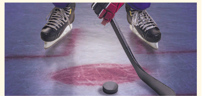
НА ФОТО: ЧЕМПИОНАТ ПОМОЖЕТ ОБНОВИТЬ ЛЕДОВУЮ АРЕНУ