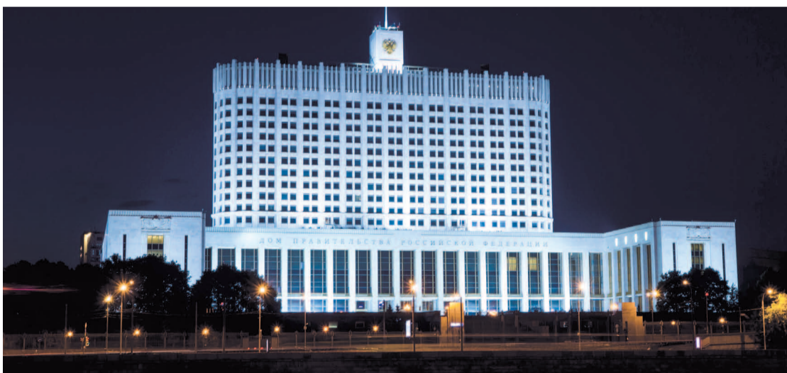
НА ФОТО: ДОМ ПРАВИТЕЛЬСТВА РОССИЙСКОЙ ФЕДЕРАЦИИ

«Что касается сюрпризов, — продолжил Г.А. Зюганов, — то опять в кулуарах три человека посидели и назвали состав Правительства, хотя я при утверждении МЕДВЕДЕВА предлагал Президенту собрать лидеров думских фракций и посоветоваться. Но они взяли на себя ответственность, полагаясь на рейтинг Президента. Однако любой рейтинг будет держаться, если вы станете выполнять свои обязательства. Но сейчас еще рот не закрыли на