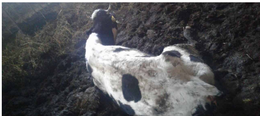
НА ФОТО: КОРОВЫ БОЛЕЮТ, А ИХ ДАЖЕ КОРМИТЬ ГОДНЫМИ КОРМАМИ НЕ СОБИРАЮТСЯ