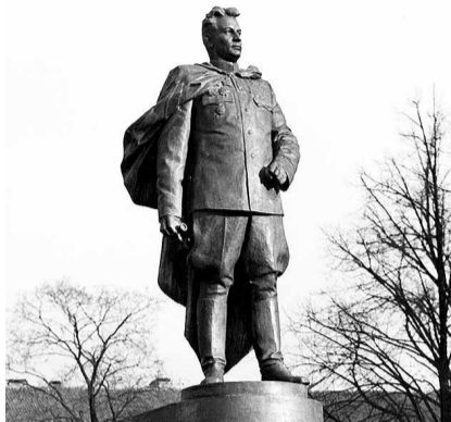
НА ФОТО: ПАМЯТНИК КОМАНДАРМУ, ПЕРЕНЕСЕННЫЙ ИЗ ВИЛЬНЮСА В ВОРОНЕЖ

В народе издавна говорят, что свою судьбу не обойдешь и не объедешь. Она и складывалась у полководца как нельзя лучше: победы в сражениях с врагом, награды, воинские звания и быстрое продвижение по службе. А дальше — чудовищная несправедливость: гибель от осколка шального снаряда за один день до присвоения ему звания маршала и за 80 дней до Великой Победы. Такая выпала судьба дважды Герою Советского Союза, выдающемуся советскому военачальнику, генералу армии Ивану Даниловичу ЧЕРНЯХОВСКОМУ .