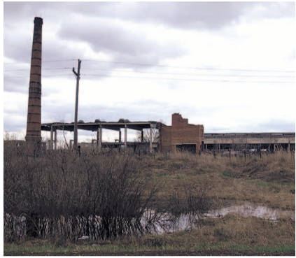
НА ФОТО: КОМУ-ТО ВЫГОДНЕЕ РАЗВАЛИТЬ ПРЕДПРИЯТИЕ, ЧЕМ РАБОТАТЬ...

Примерно в то же время продали еще один местный завод — торгового оборудования. Новые хозяева предприятия решили перепрофилировать его и организовали линию по розливу спиртного. Правда, выпускать реши-