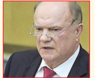
НА ФОТО: ГЕННАДИЙ ЗЮГАНОВ

18 мая был представлен состав нового кабинета министров. По просьбе СМИ своими впечатлениями от озвученных премьером кандидатур поделился лидер КПРФ Г.А. ЗЮГАНОВ .