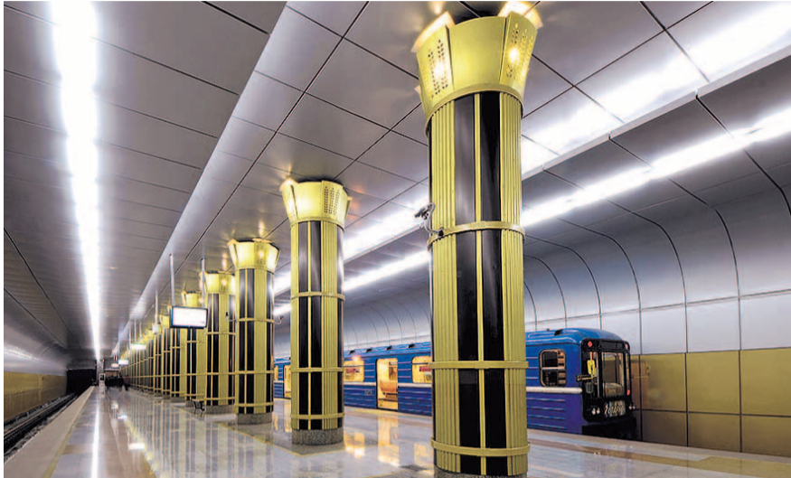
НА ФОТО: МЕТРО — ПРИОРИТЕТНЫЙ ГОРОДСКОЙ ТРАНСПОРТ

Анатолий Локоть представил проект строительства двух новых станций, эстакады и метродепо и рассказал участникам Форума, что на эти участки есть проектно-сметная документация, которая была актуализирована, и в ближайшее время проект пройдет государственную экспертизу. После этого будет готов полный комплект документации на новые станции. Согласно проекту, достаточно протяженный участок будет расположен над землей, что упрощает и строительство, и эксплуатацию сооружения.