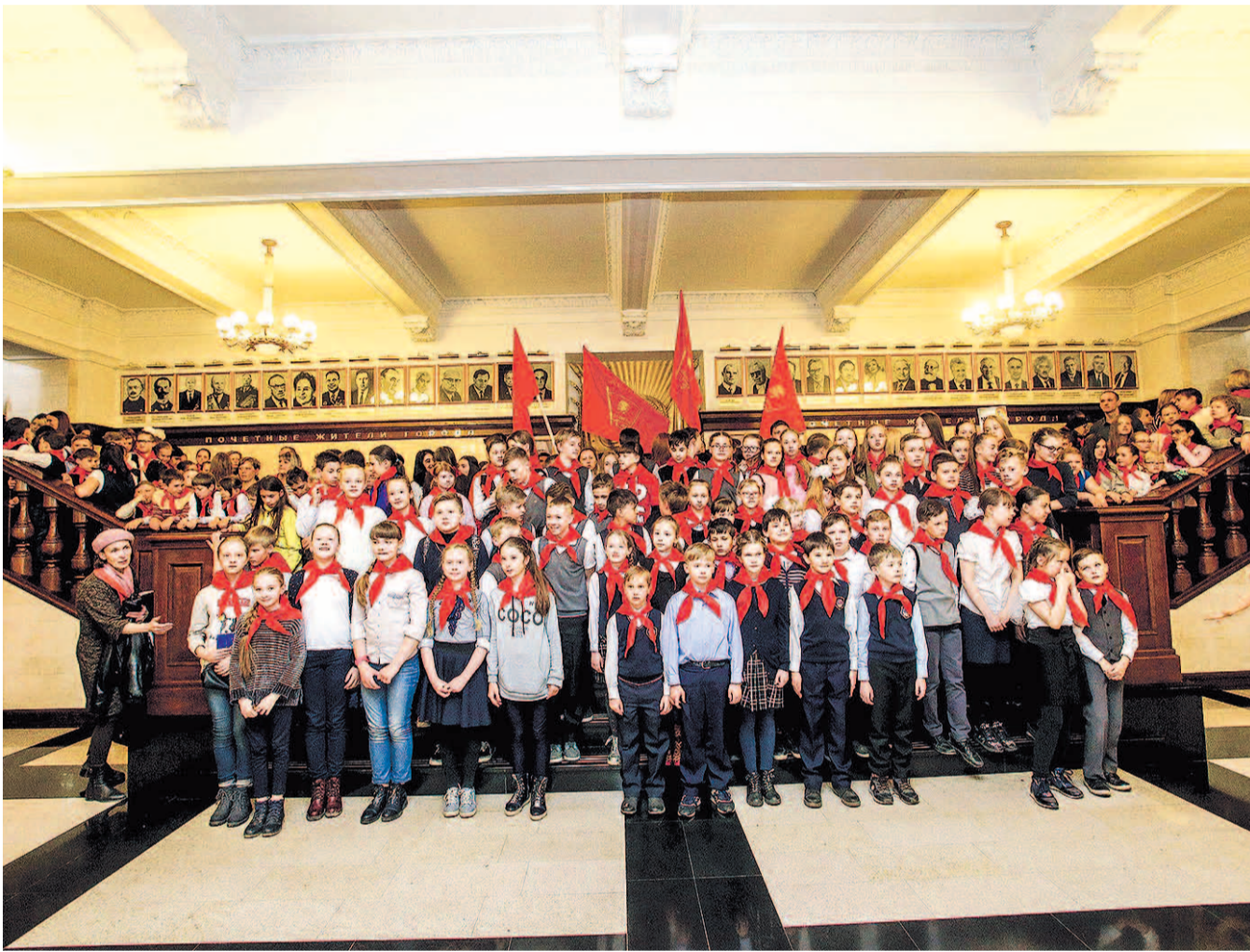
НА ФОТО: В день ПИОНЕРИИ, 19 МАЯ, КЛЯТВУ ПРИНЕСЛИ УЧЕНИКИ СРАЗУ ИЗ 12 ШКОЛ