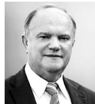
НА ФОТО: ГЕННАДИЙ ЗЮГАНОВ

18 марта, предваряя пленарное заседание Госдумы, перед журналистами выступил Председатель ЦК КПРФ Геннадий Зюганов .