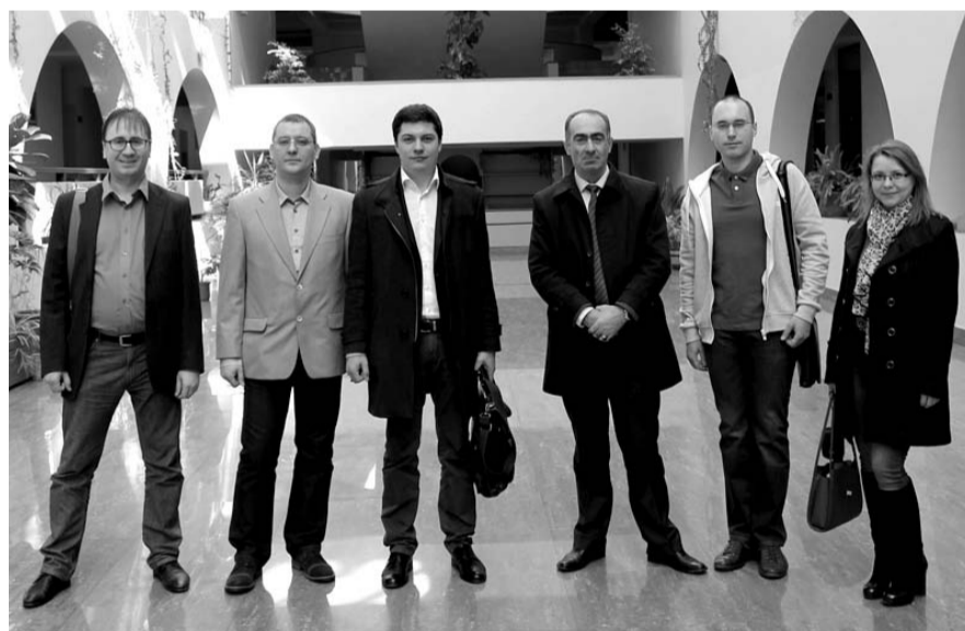
НА ФОТО: ДЕЛЕГАЦИЯ НОВОСИБИРСКИХ ЖУРНАЛИСТОВ В ЕРЕВАНЕ