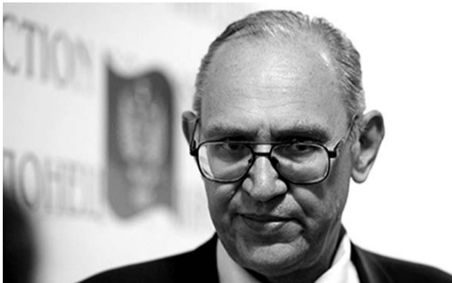
НА ФОТО: БОРИС ЛИТВИНОВ

Первый секретарь Коммунистической партии ДНР, депутат Народного Совета ДНР Б.А. ЛИТВИНОВ