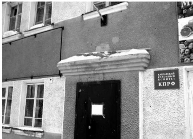
НА ФОТО: СЛОМАННОЕ ДРЕВКО ФЛАГА НАД ВХОДОМ В ПРИЕМНУЮ