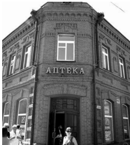
НА ФОТО: СТАРЕЙШАЯ АПТЕКА ГОРОДА

Муниципальная аптечная сеть выполняет поручение, данное мэром города, — стать инструментом социальной защиты населения. В принципе, мы готовы при изменении устава открывать пункты в районах области.