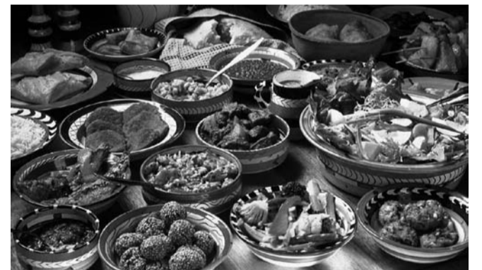
НА ФОТО: ДАЖЕ В КРИЗИС — ПИРОВАТЫ!

На сайте госзакупок появился любопытный лот: планируется выделение 3 миллионов бюджетных рублей на проведение банкетов и обедов для аппарата губернатора Новосибирской области. В лоте особо подчеркнута, что в аппарате губернатора на столах хотят видеть трюфели в кедровых орехах, кубики из языка с каперсами и виски с выдержкой не менее 18 лет.