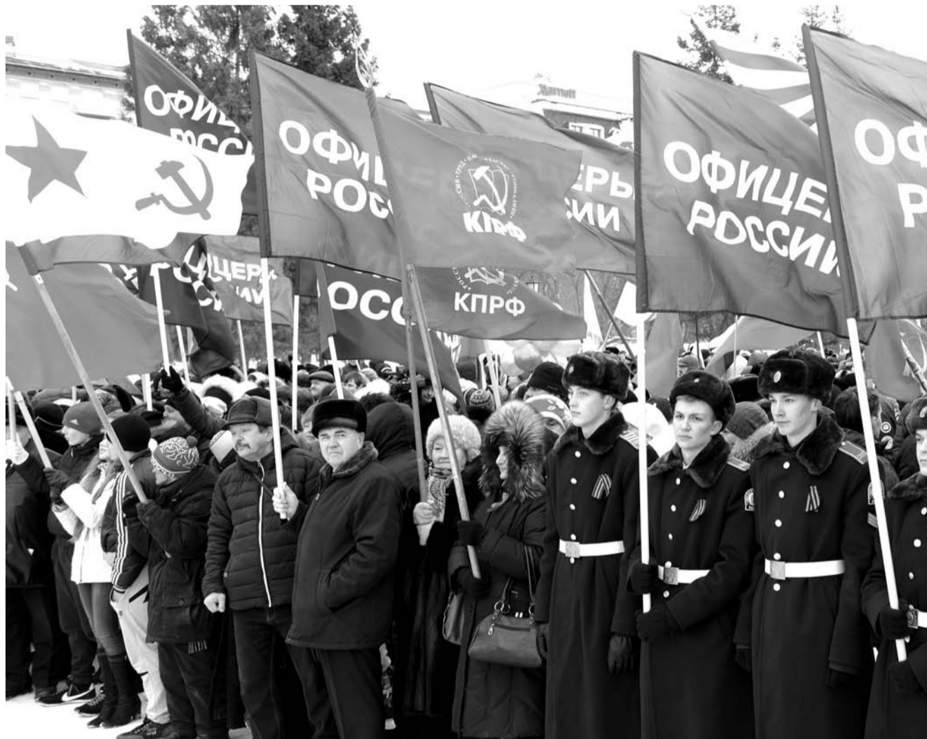
НА ФОТО: ГО