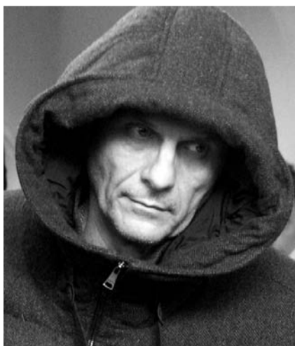
НА ФОТО: ГУБЕРНАТОР ХОРОШАВИН

Итак, что мы видим? Мы видим, что власть, все последние годы продающая необработанное сырье за рубеж и уничтожающая реальный сектор оте-