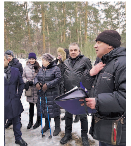
НА ФОТО: ВСТРЕЧА БЫЛА ЖАРКОЙ

Единороссам предложили пройти на место, где расположена детская площадка, вместо которой они хотят уста-