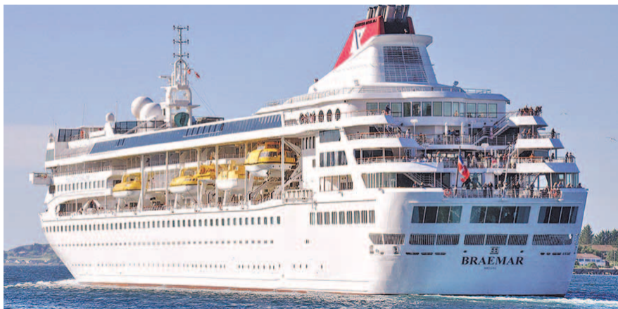
НА ФОТО: ЛАЙНЕР BRAEMAR У БЕРЕГОВ КУБЫ

На помощь в этой непростой ситуации пришла лишь Куба, более 60 лет находящаяся под американскими санкциями, но не потерявшая человеческое лицо даже на фоне мировой пандемии. Остров Свободы откликнулся на просьбу британского правительства и разрешил кораблю высадить пассажиров, а затем согласился переправить