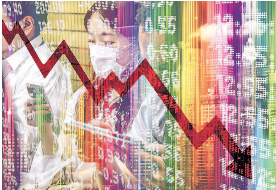
НА ФОТО: МИРОВЫЕ ФИНАНСОВЫЕ РЫНКИ РУХНУЛИ

Главная проблема заключается в том, что власти знают, как справиться с экономическим кризисом, но не знают, как справиться с вирусом. Продол-