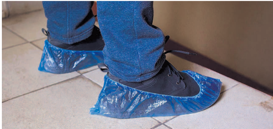
НА ФОТО: РАЗУМЕН ЛИ ПОКВАРТИРНЫЙ ОБХОД В УСЛОВИЯХ ПАНДЕМИИ?

Теперь на «общероссийское голосование» будет вынесен вопрос «Вы одобряете изменения в Конституцию Российской Федерации?», то есть жители смогут проголосовать только за или против всех поправок разом. В Кремле заявили, что поправки вступят в силу, если их поддержат более поло-