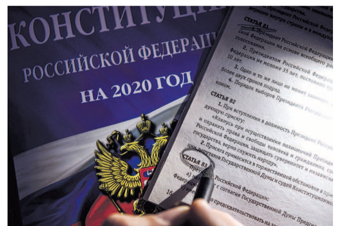
НА ФОТО: ВСЕ НА БЛАГО ВЛАСТЕЙ ПРЕДЕРЖАЩИХ

В статье он пишет, что известный «приватизатор» ЧУБАЙС в свое время, в слепой ненависти к коммунистической идеологии, сделал все, чтобы уничтожить не только идеологию, но и экономические основы страны, создав на постсоветском пространстве сырьевой придаток запада.