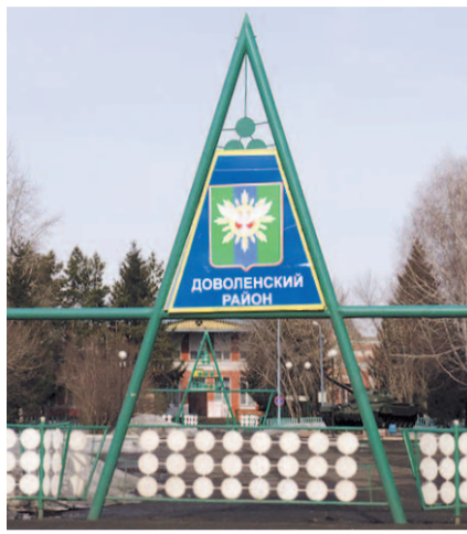
НА ФОТО: доволенцы — против обнуления!