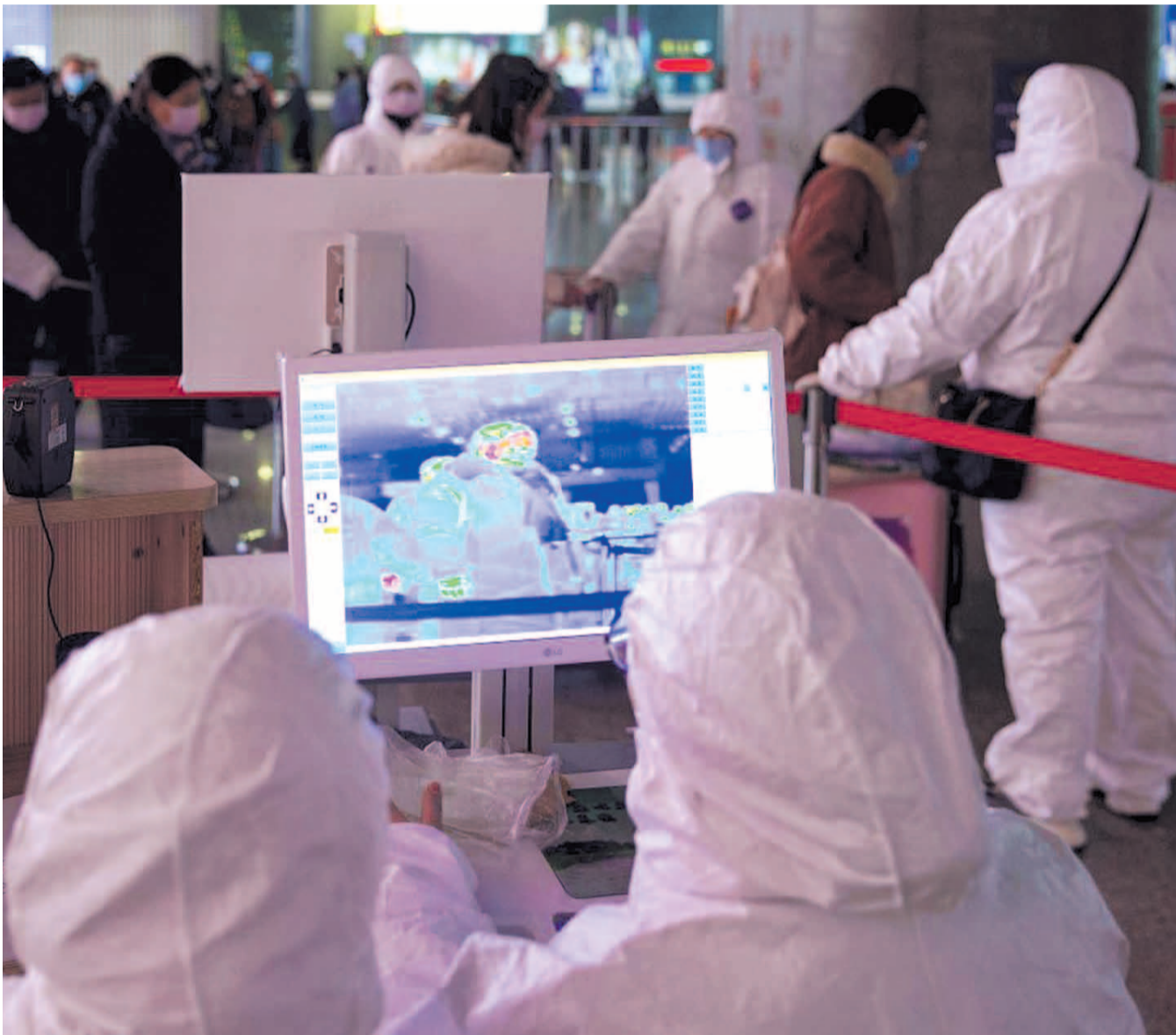
НА ФОТО: ВВЕДЕН КОНТРОЛЬ ПРИБЫВАЮЩИХ ИЗ-ЗА ГРАНИЦЫ