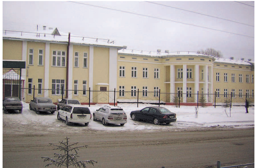
НА ФОТО: КЛИНИЧЕСКАЯ ИНФЕКЦИОННАЯ БОЛЬНИЦА №1

— В детскую больницу №3 за выходные поступило два ребенка, недавно вернувшихся в Россию, с признаками