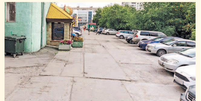
НА ФОТО: ЛАРЬКОВ ЗДЕСЬ НЕ БУДЕТ!