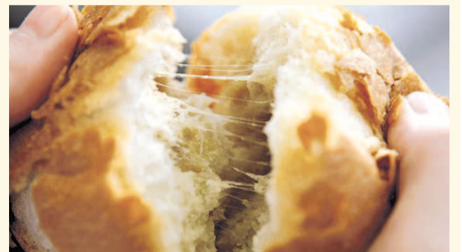
НА ФОТО: ХЛЕБ ИЗ ЗАРАЖЕННОЙ МУКИ НЕСЪЕДОБЕН