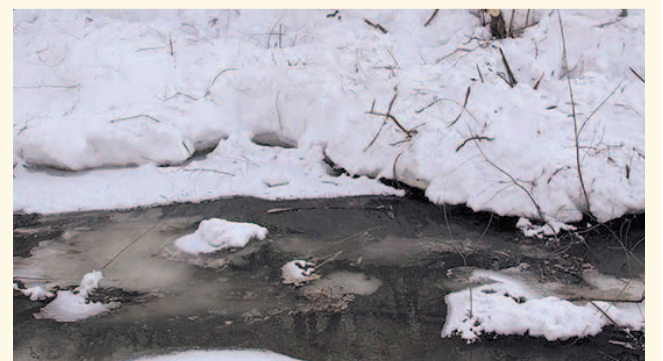
НА ФОТО: РЕКИ СКОРО РАЗОЛЮТСЯ