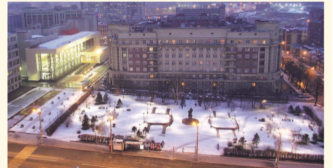
НА ФОТО: ПЛОЩАДЬ СВЕРДЛОВА