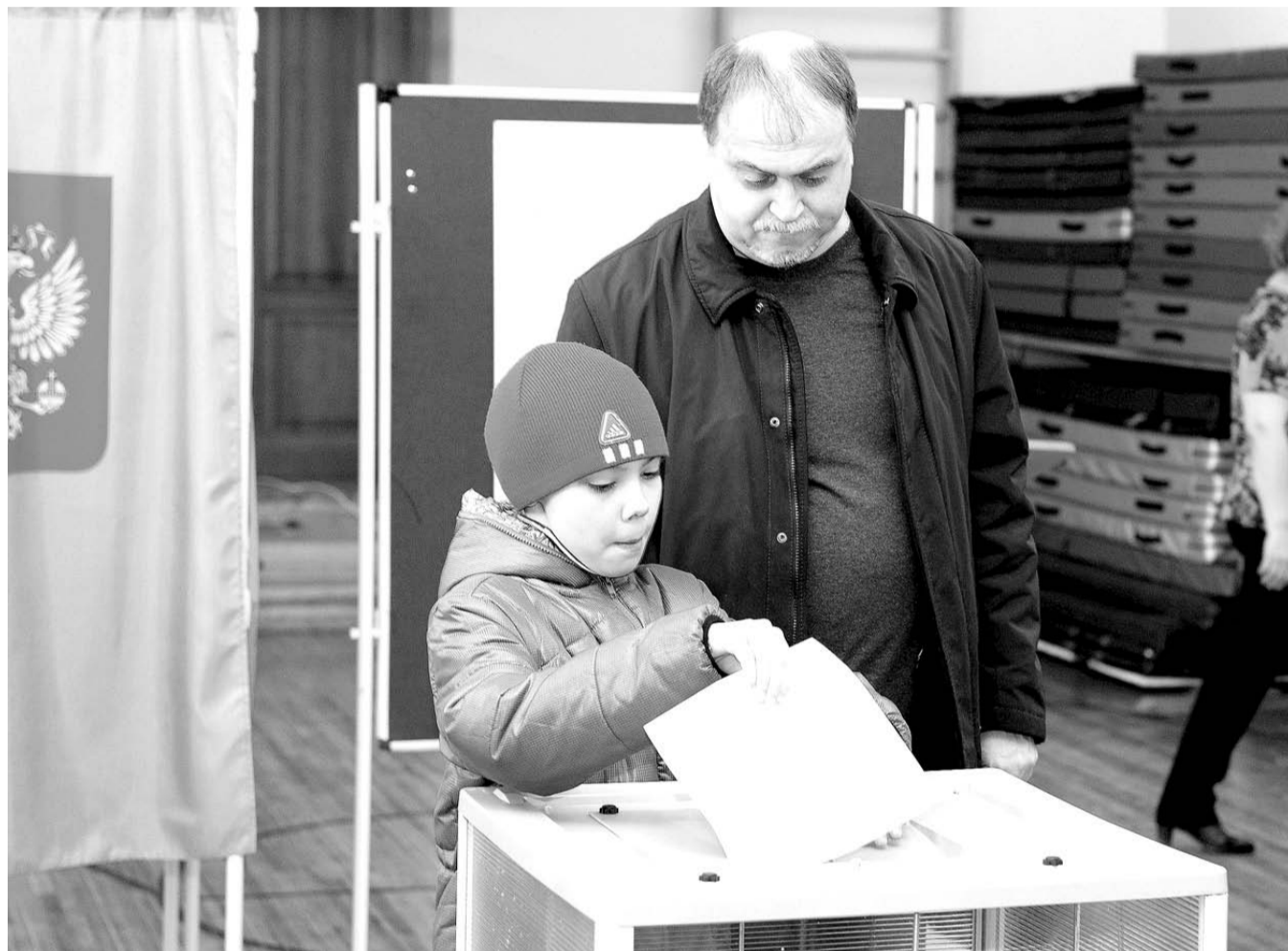
НА ФОТО: В ВОСКРЕСЕНЬЕ НОВОСИБИРЦЫ БУДУТ ВЫБИРАТЬ ДЕПУТАТОВ ГОРСОВЕТА И ЗАКСОБРАНИЯ