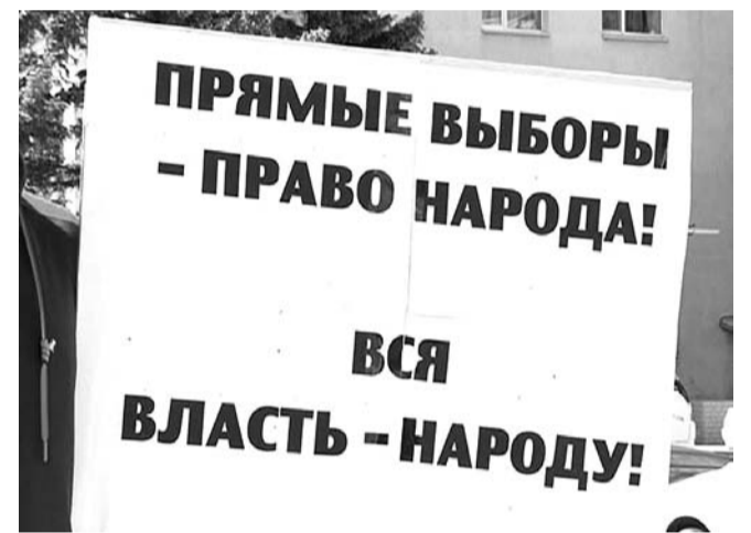
НА ФОТО: ЛЮДИ БОРЮТСЯ ЗА ПРАВО ВЫБОРА