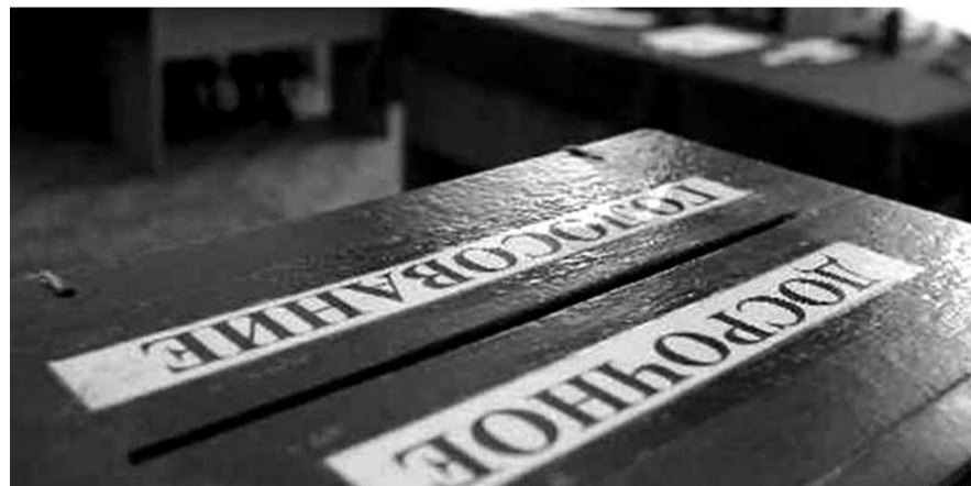
НА ФОТО: ПОДЛОГ ПРИ ДОСРОЧНОМ ГОЛОСОВАНИИ — ШАНС КАНДИДАТОВ ОТ ПАРТИИ ВЛАСТИ