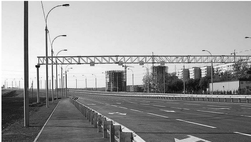
НА ФОТО: НОВАЯ ДОРОЖНАЯ РАЗВЯЗКА ЗАРАБОТАЛА

— Да, наверное, сразу все проблемы не решатся, и все пробки в городе не исчезнут, но мы продолжаем по-