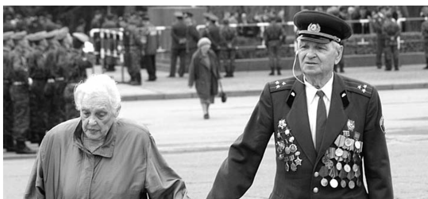
● НА ФОТО: ВОЕВАЛИ ЗА РОДИНУ И ЗА СТАЛИНА