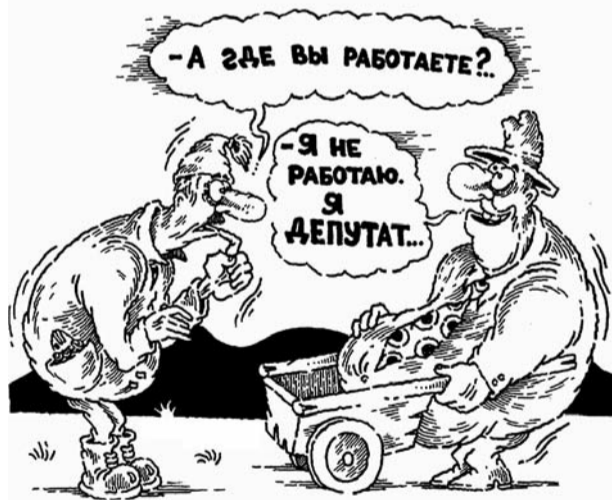
● НА РИС.: ЕДИНОРОССЫ ЗАБЫЛИ, ЧТО ДЕПУТАТ — ЭТО РАБОТА?

По мнению депутатов-коммунистов, произошедшее можно рассматривать как реакцию на то, что на сегодняшнем заседании должна была рассматриваться законодательная инициатива «О гарантиях равенства партий, представленных в Новосибирском областном Совете депутатов, при освещении их деятельности государственными и муниципальными организациями телерадиовещания, периодическими печатными изданиями», которая была выдвинута КПРФ.