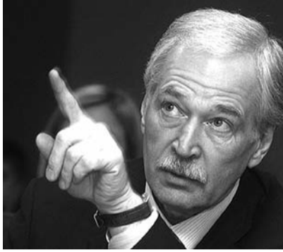
● НА ФОТО: БОРИС ГРЫЗЛОВ

Лидер «Единой России» Владимир ПУТИН на встрече в пятницу с руководством партии, в частности, предостерег «единороссов» в преддверие региональных выборов от невыполнимых обещаний. «Нельзя обещать все, всем и сразу, нельзя превращаться «в обещалкиных», которые обещают только для того, чтобы