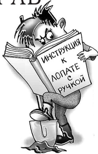
● НА РИС.: ПОРОЙ В УПРАВЛЯЮЩЕЙ КОМПАНИИ РАБОТАЮТ ТЕ ЕЩЕ «СПЕЦИАЛИСТЫ»

Не стоит поддаваться на тактику запугивания, в последнее время используемую УК, когда ее представители заявляют, что если жители не согласятся с тем тарифом, что им предлагают, будет принят тариф, установленный для муниципального жилья. Отношения между УК и собственниками жилья регулируются договором. И действовать без оглядки на собственников управляющая