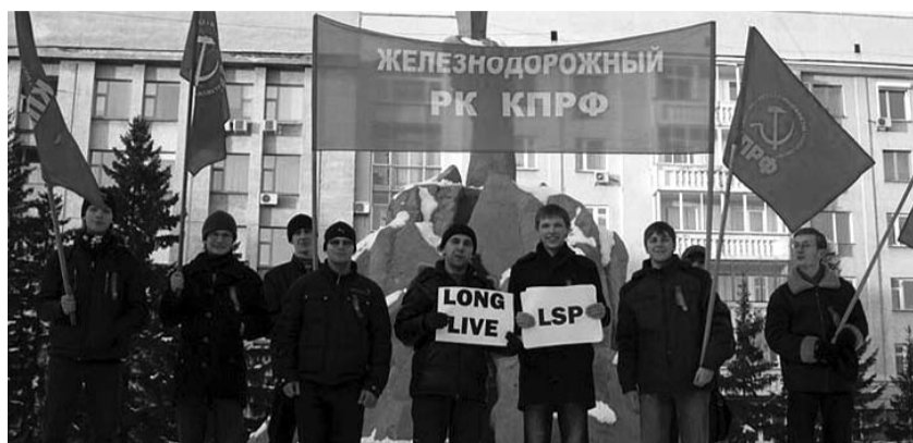
● НА ФОТО: МОЛОДЕЖНАЯ АКЦИЯ «ПРИВЕТ ИНОСТРАННЫМ КОММУНИСТАМ!»

Я не понаслышке знаю, что такое беспредел власти. Три года (2006-2008), работал в МУП «Похоронный дом