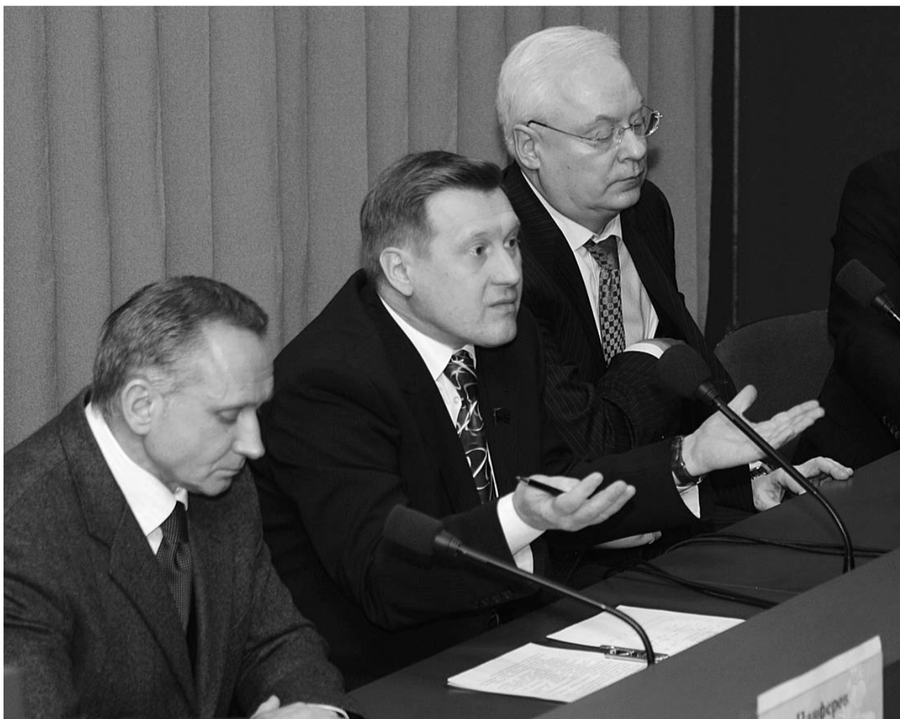
● НА ФОТО: ЛИДЕРЫ РЕГИОНАЛЬНЫХ ОТДЕЛЕНИЙ ПАРТИЙ — ПРОТИВ МОНОПОЛИИ «ЕДИНОЙ РОССИИ»