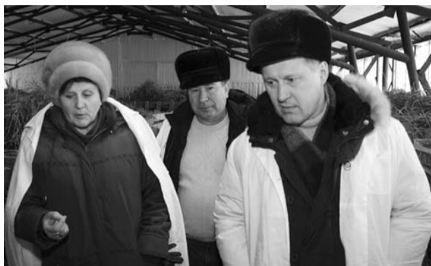
● НА ФОТО: АНАТОЛИЙ ЛОКОТЬ В ХОЗЯЙСТВЕ «ЛУКОВСКОЕ»

Первый секретарь Новосибирского обкома КПРФ, депутат Госдумы Анатолий ЛОКОТЬ на минувшей неделе посетил СПК «Луковское» в Ордынском районе Новосибирской области. Руководитель хозяйства пригласил его, чтобы рассказать о сегодняшних реалиях животноводов, о том, какие проблемы стоят перед ними и как их пытаются решать.