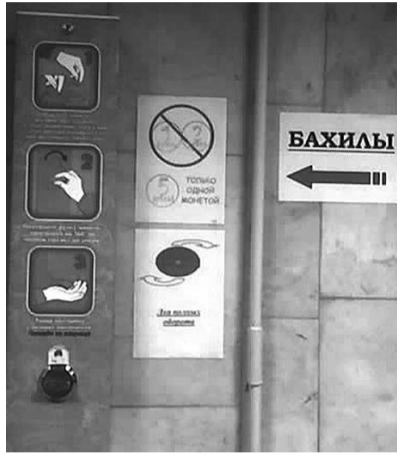
● НА ФОТО: 401-Й ЛЕГАЛЬНЫЙ СПОСОБ ОТЪЕМА ДЕНЕГ У НАСЕЛЕНИЯ

Во-вторых, даже если у вас нет с собой сменной обуви, а вам нужно пройти, ска-