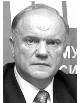
● НА ФОТО: ЛИДЕР КПРФ

Недавний массовый митинг протеста в Калининграде стал знаковым событием, свидетельствующим о перерастании экономического кризиса в политический. Пока руководство РФ делает успокоительные заверения о выходе из спада,