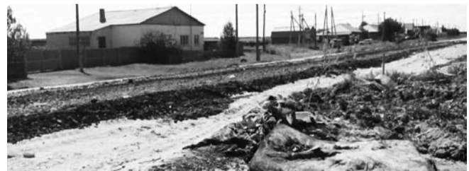
НА ФОТО: ДЕЛАЛИ ДОРОГУ, А ПОЛУЧИЛАСЬ СВАЛКА

Жители Чистоозерного района жалуются на некачественный ремонт поселковой дороги. Засыпали мусором и заровняли — так, по словам жителей райцентра Чистоозерное, летом этого года проводился «ремонт» 500 метров поселковой дороги по улице Сорокино.