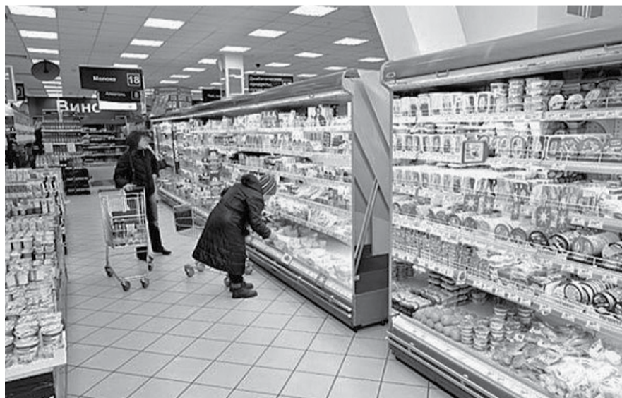
НА ФОТО: НА ПРИЛAVКАХ — ИЗОБИЛИЕ ПРОДУКТОВ, НО ИХ КАЧЕСТВО И ПРОИСХОЖДЕНИЕ ВЫЗЫВАЕТ ВОПРОСЫ

— Безусловно, надо увеличивать господдержку сельхозпроизводств,