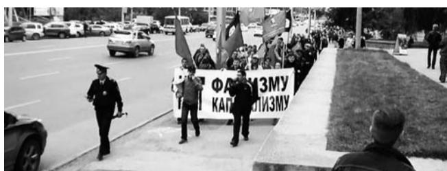
НА ФОТО: МИТИНГ ЛЕВОЙ МОЛОДЕЖИ

Активисты левых молодежных организаций провели совместное шествие, митинг и договорились о дальнейшем сотрудничестве. Комсомольцы Новосибирска приняли самое активное участие в акции.