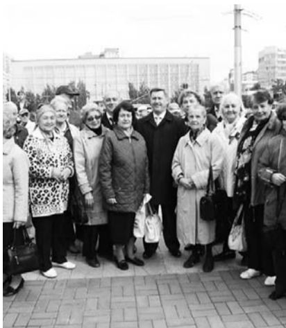
НА ФОТО: МИТИНГ ПАМЯТИ НАЧАЛА БЛОКАДЫ

— Забыть об этом мы не можем. В блокаде погибли наши родители, родственники, знакомые. Многие из нас остались без родителей, и, собирая нас по квартирам, волонтеры определяли нас в детские приюты, и с детскими приютами эвакуировали. Мы прошли через Дом ребенка. А в Новосибирске было такое положение — местным жителям брать детей-блокадников в свои семьи. Детей воспитали, вырастили. Мы жить начали с нуля. Те дети, которые прошли через детские дома и не нашли своих родителей, так никого не смогли назвать ни мамой, ни папой. И, конечно, у всех нас тяжелый осадок на душе, мы пережили очень тяжелое