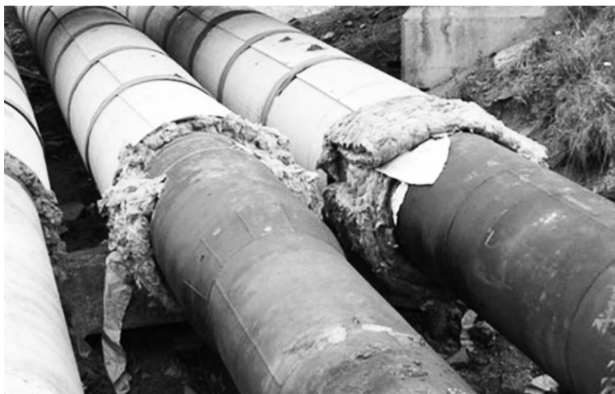
НА ФОТО: ВМЕСТО РЕМОНТА ТЕПЛОСЕТЕЙ — ЭКОНОМИЯ НА ТЕМПЕРАТУРЕ ВОДЫ

Депутат Заксобрания Вадим АГЕНКО считает, что температура горячей воды сознательно занижается. И то, что с граждан берут деньги за