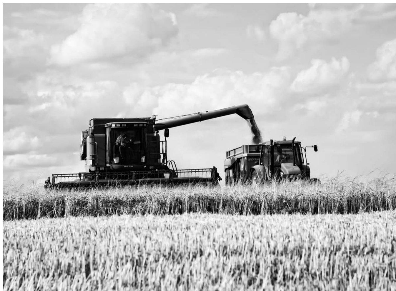
НА ФОТО: МОЩНЫЙ АГРОПРОМЫШЛЕННЫЙ КОМПЛЕКС — ОСНОВА ПРОДОВОЛЬСТВЕННОЙ БЕЗОПАСНОСТИ