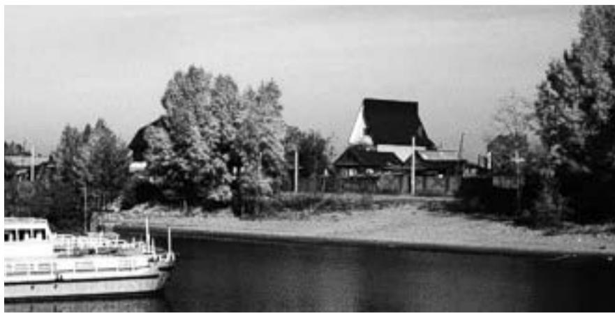
НА ФОТО: дачи в водоохранной зоне нечистоты до водозабора. Все знают, в том числе и дачники, что строить по берегам реки нельзя.

Еще в 80-е годы я писал в газеты «Вечерний Новосибирск» и «Известия» о добыче песка в черте города. Стоял земснаряд и внутри острова Малашка напротив многоэтажек по ул. Звездная и выедал остров изнутри. Удалось это остановить.