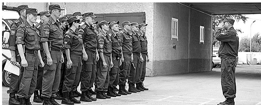
НА ФОТО: НА ПЕРИОД ПРОВЕДЕНИЯ ОЛИМПИАДЫ ПОЛИЦЕЙСКИЕ ИЗ ГОРОДА УЕДУТ