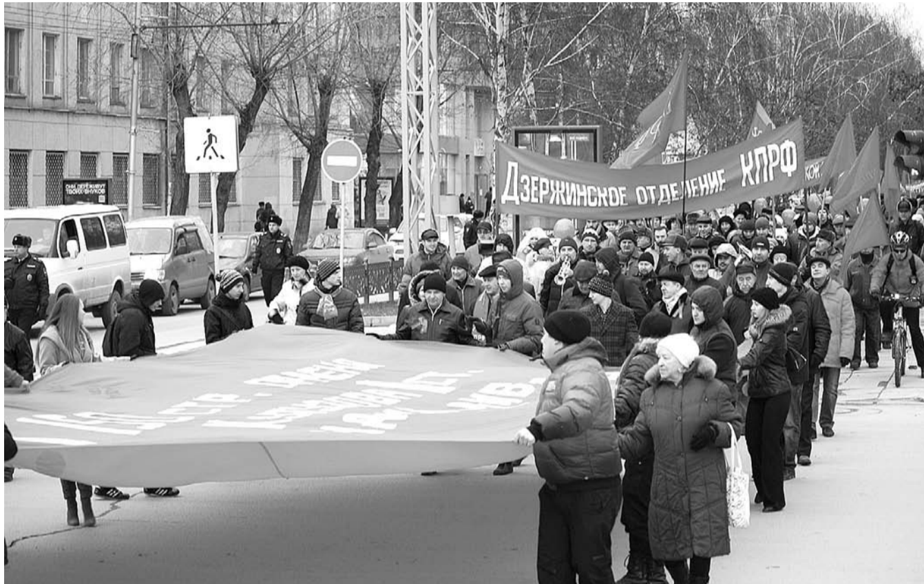
НА ФОТО: ПЕРЕД КОЛОННОЙ ДЕМОНСТРАНТОВ АКТИВИСТЫ ЛЕНИНСКОГО КОМУНИСТИЧЕСКОГО СОЮЗА МОЛОДЕЖИ НЕСЛИ ЗНАМЯ ПОБЕДЫ