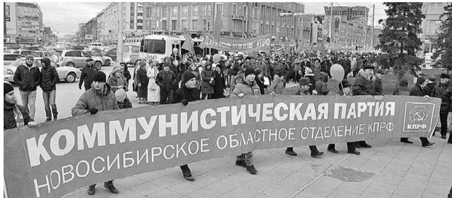
НА ФОТО: ДЕМОНСТРАЦИЯ ЗАВЕРШИЛАСЬ МИТИНГОМ НА ПЛОЩАДИ ЛЕНИНА

стям, — шли защищать сердце нашей Родины, нашу великую державу — Советский Союз. И сегодня мы идем в одной колонне, плечом к плечу, под красным знаменем Ленина, чтобы вновь, как и тогда, отстоять нашу Родину.