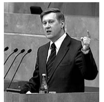
НА ФОТО: АНАТОЛИЙ ЛОКОТЬ В ГОСУДАРСТВЕННОЙ ДУМЕ

Депутаты-коммунисты внесли на рассмотрение Госдумы проект обращения в связи с 20-й годовщиной событий сентября-октября 1993 года в Москве. В проекте обращения содержалась просьба к президенту РФ Владимиру ПУТИНУ поручить