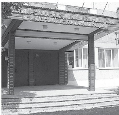
НА ФОТО: НЕЭФФЕКТИВНЫЙ ВУЗ