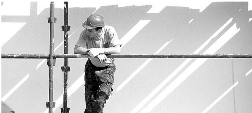
НА ФОТО: НОВОСИБИРСКАЯ ОБЛАСТЬ МОЖЕТ ЛИШИТЬСЯ ФЕДЕРАЛЬНОЙ ПОДДЕРЖКИ

без ошибок. Это признает сам губернатор Новосибирской области Василий ЮРЧЕНКО . На встрече с фракцией я передавал ему обращение на 10 страницах, и он признал, что правительство поспешило. Но приостановить вопрос и исправить ошибки, увы, власть не хочет, — говорит парламентарий.