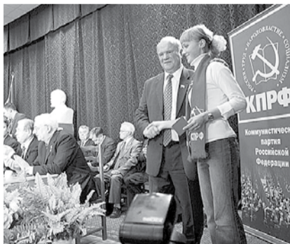
НА ФОТО: ВЗНОСЫ БУДУТ КОНТРОЛИРОВАТЬ

Правительство РФ одобрило законопроект об ограничении размеров членских и вступительного взносов партий и решило внести его в Госдуму.