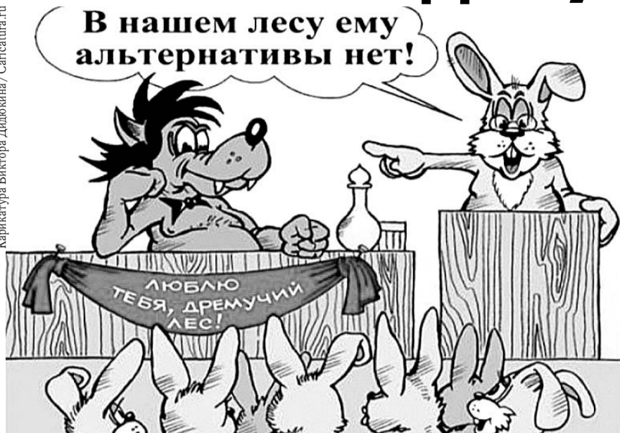
НА РИС.: ВЛАСТЬ ДОБРОВОЛЬНО НЕ УЙДЕТ

Азии на декларируемые ПУТИНЫМ 25 млн. рабочих мест имеет целью воспрепятствовать возрождению способного к самоорганизации рабочего класса в России.