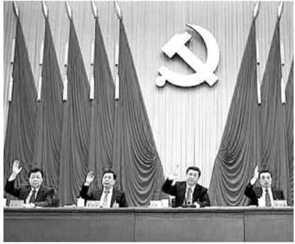
НА ФОТО: ПРЕЗИДИУМ ПЛЕНУМА ЦК КПК

В Пекине завершился 3-й пленум ЦК КПК 18-го созыва, на котором было рассмотрено и принято Постановление ЦК КПК по важным вопросам о всестороннем углублении реформ, выработана четкая «дорожная карта» будущего Китая, а также утверждены новые вехи для нового пути реформ.