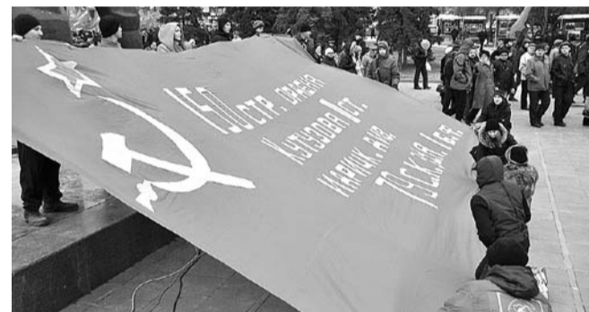
НА ФОТО: МНОГОМЕТРОВАЯ КОПИЯ ЗНАМЕНИ ПОБЕДЫ