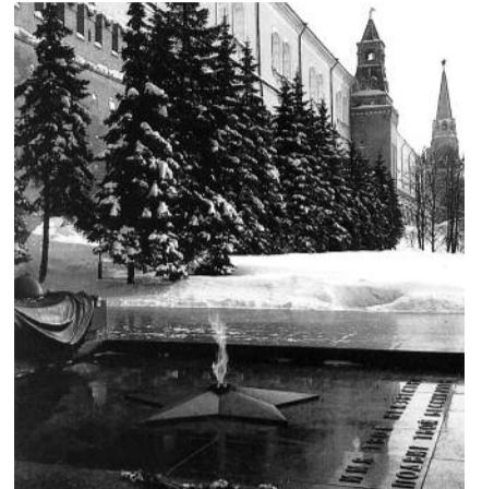
● НА ФОТО: СПИ, НЕИЗВЕСТНЫЙ СОЛДАТ

3 декабря 1966 года Родина сказала материнское слово над прахом всех сынов и дочерей, погибших в безвестных окопах, у незнакомых поселков и на безымянных высотах, раскинувшихся от канала Москва-Волга до Эльбы и Шпрее.