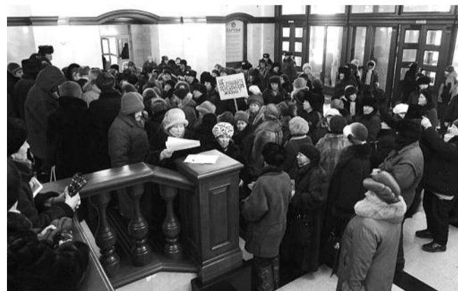
■ НА ФОТО: ПОЧТИ ГОД НАЗАД, 22 ДЕКАБРЯ 2010 ГОДА ПЕРВАЯ МАССОВАЯ АКЦИЯ ПРОТЕСТА ЗА СОХРАНЕНИЕ БЕЗЛИМИТНОГО ЛЬГОТНОГО ПРОЕЗДА ЗАКОНЧИЛАСЬ ШТУРМОМ МЭРИИ НОВОСИБИРСКА

КПРФ не намерена отступать и продолжит борьбу за полный возврат безлимитного льготного проезда!