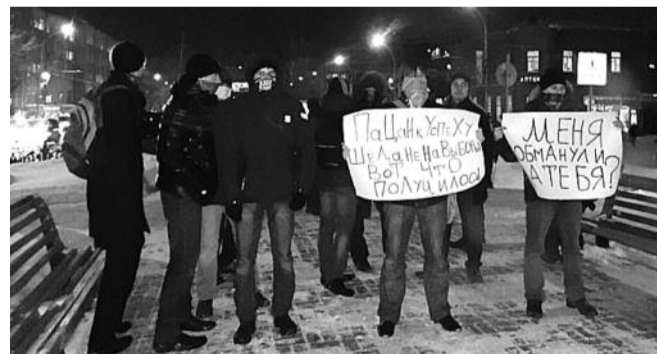
■ НА ФОТО: УЧАСТНИКОВ АКЦИИ ЗАДЕРЖАЛИ ОЧЕНЬ БЫСТРО