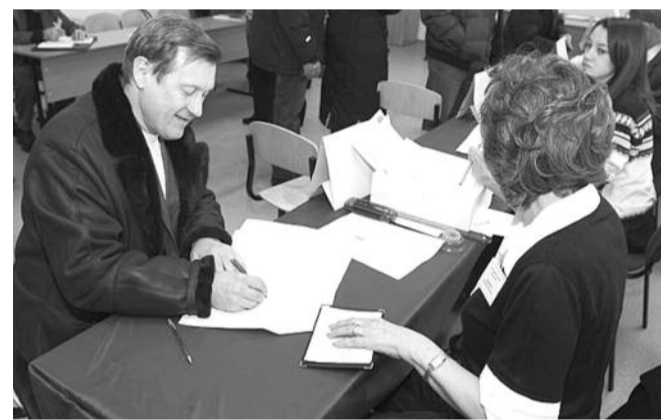
● НА ФОТО: АНАТОЛИЙ ЛОКОТЬ ПОЛУЧАЕТ СВОЙ БЮЛЛЕТЕНЬ

Анатолий ЛОКОТЬ, первый секретарь Новосибирского обкома КПРФ, депутат Государственной думы