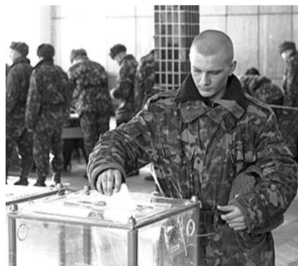
■ НА ФОТО: ГОЛОСОВАНИЕ ПО ПРИКАЗУ?

— На центральных телеканалах показано 23 видеосюжета позитивного содержания о голосовании военнослужащих, — отмечает министр. — Видеосюжетов негативного содержания показано не было.