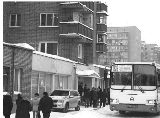
■ НА ФОТО: НЕЗАКОННЫЙ ПОДВОЗ ИЗБИРАТЕЛЕЙ НА УЧАСТОК

К избирателю, который оставил заявку для домашнего голосования, так и не пришли. Когда он позвонил в комиссию, ему ответили очень грубо, сославшись на то, что к нему приходили, но никого дома не было. Такой метод был использован очень широко — на «горячую линию» обкома