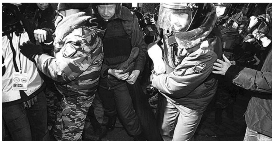
■ НА ФОТО: ЗАДЕРЖАНИЕ ОППОЗИЦИОНЕРОВ НА ТРИУМФАЛЬНОЙ ПЛОЩАДИ 6 ДЕКАБРЯ

Николай ИВАНОВ по материалам NEWSRU.COM, «Ведомости» и Заголовки.ру