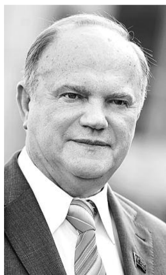
■ НА ФОТО: ЛИДЕР КПРФ

— Мы считаем, что «Единая Россия» потерпела не просто поражение, а сокрушительное поражение. И оно выражается не в количестве голосов, а в отсутствии у партии власти интеллектуальных способностей и конкретных предложений.