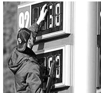
НА ФОТО: ПОВЫШЕНИЯ ЦЕН НЕ ИЗБЕЖАТЬ?

В государственных нефтяных компаниях — «Роснефти» и «Газпромнефти» вопросы газете о перспективе снижения цен оставили без ответа. Однако, по словам экспер-