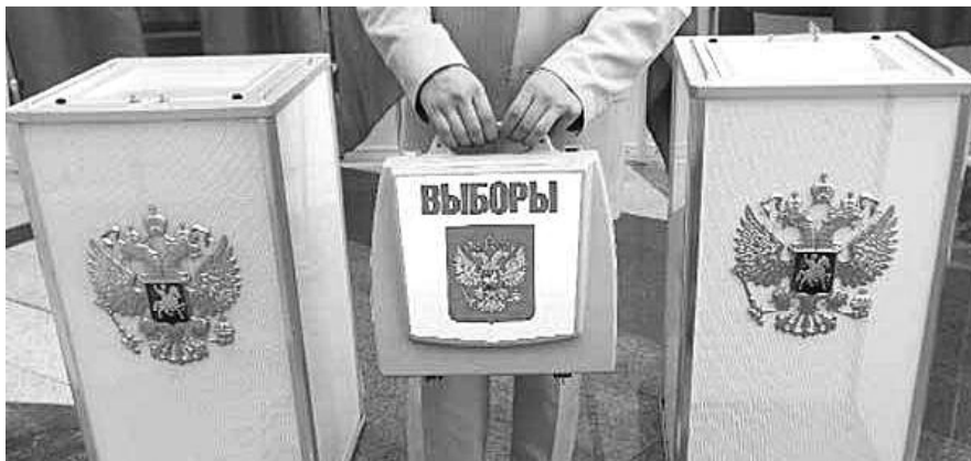
НА ФОТО: УГАДАЙТЕ, В КАКОЙ УРНЕ ВАШ ГОЛОС ЗА ПАРТИЮ «ЕДИНАЯ РОССИЯ»?