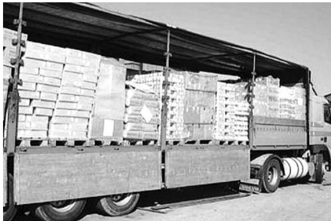
НА ФОТО: ГУМАНИТАРНАЯ ПОМОЩЬ ДЛЯ КОСОВСКИХ СЕРБОВ

МЧС России направило гуманитарную помощь косовским сербам, оказавшимся в центре вновь обострившегося конфликта с албанцами на севере самопровозглашенного государства. Автомобильная колонна с грузом в среду утром отправилась в Косово из подмосковного Ногинска, сообщил РИА «Новости» представитель управления информации МЧС.