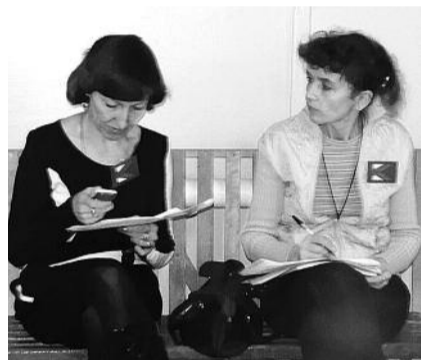
■ НА ФОТО: НА ВХОДЕ В ИЗБИРАТЕЛЬНЫЙ УЧАСТОК №1751 РАБОТНИКОВ ЗАВОДА ИМ. КУЗМИНА ПРОВЕРЯЛИ ПО СПИСКАМ