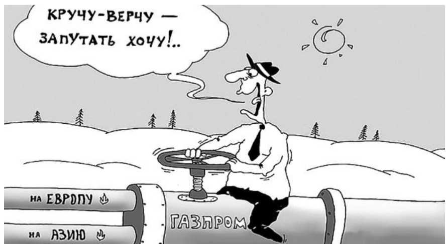
■ НА РИСУ: «СВОИМ-ЧУЖИМ, СВОИМ-ЧУЖИМ... ГЛАВНОЕ — НЕ ЗАПУТАТЬСЯ!»