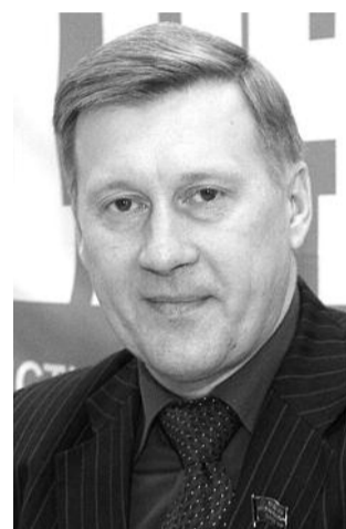
● НА ФОТО: АНАТОЛИЙ ЛОКОТЬ

— Мы благодарим тех, кто пришел на выборы 4 декабря поддержать КПРФ в этой непростой ситуации, всех тех, кто помогал в борьбе. Впервые в Новосибирской области жители столь консолидированно отказали в доверии «партии власти».