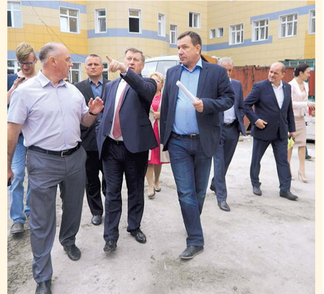
НА ФОТО: АНАТОЛИЙ ЛОКОТЬ ЛИЧНО ПОСЕТИЛ СТРОЙПЛОЩАДКУ

В настоящее время продолжаются ремонтно-строительные работы в здании школы-интерната для детей с дефектами слуха на улице Прибрежной, которая должна открыть двери для учеников в 2018 году. Сегодня в рамках выездного совещания глава города Анатолий ЛОКОТЬ вместе со специалистами мэрии проверил ход работ.