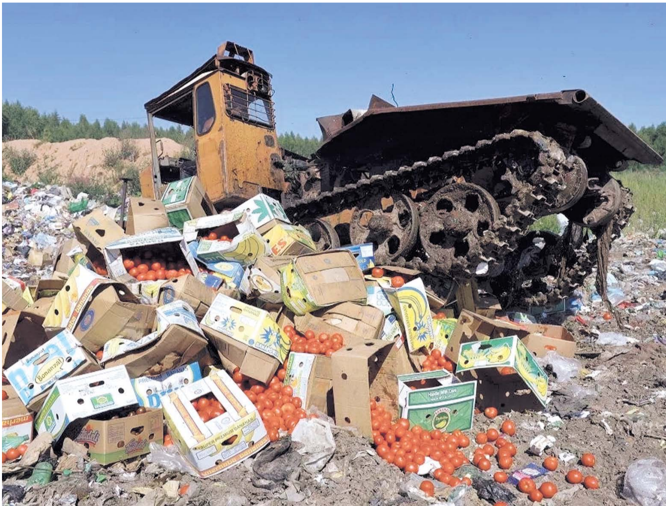
НА ФОТО: ИМПОРТОЗАМЕЩЕНИЕ ОБЕРНУЛОСЬ РОСТОМ ЦЕН, А НЕ РАЗВИТИЕМ РОССИЙСКОГО СЕЛЬСКОГО ХОЗЯЙСТВА