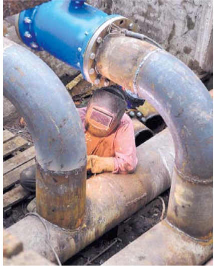
НА ФОТО: НОВОСИБИРСК ГОТОВ К ЗИМЕ