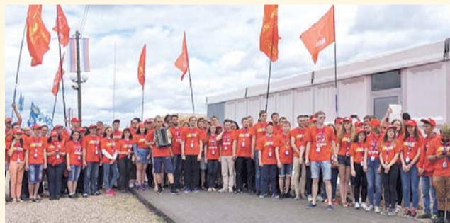
НА ФОТО: МОЛОДЫЕ КОММУНИСТЫ НА «ТЕРРИТОРИИ СМЫСЛОВ»