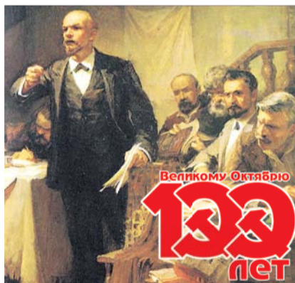
НА ФОТО: II СЪЕЗД РСДРП

Кроме книг и брошюр, они печатали статьи и другие материалы в газете «Искра» и листовках, которые распространялись по заводам и фабрикам, в деревнях, армии и флоте. На самом съезде развернулась отчаянная борьба за основные принципы политической партии нового типа, т.е. за сплоченную, марксистскую организацию, которая бы повела рабочий класс на революционную борьбу за власть против самодержавия и капитализма, в отличие от партий Второго Интернационала, которые отошли от марксизма идейно и практически, ослабляли рабочее движение, ограничивая его только экономическими требованиями. Они считали, что о борьбе за власть можно говорить только как о далеком будущем, когда рабочий класс будет составлять большинство нации! Хотя активность его борьбы в России росла год от года. Уже тогда забастовки рабочих одновременно охватывали от 50 до 500 предприятий. Ни царь, ни правительство во главе с С.Ю. ВИТТЕ , который восклицал: «Рабочие города несут!», ни репрессии и провокации С.В. ЗУБАТОВА с целью увести рабочих от политической борьбы, не могли остановить надвигающуюся волну первой