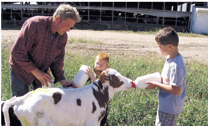
НА ФОТО: МОЛОЧНОЕ ЖИВОТНОВОДСТВО В ОБЛАСТИ НАХОДИТСЯ В УПАДКЕ

— Наштамповали несколько небольших заводиков, в том числе в