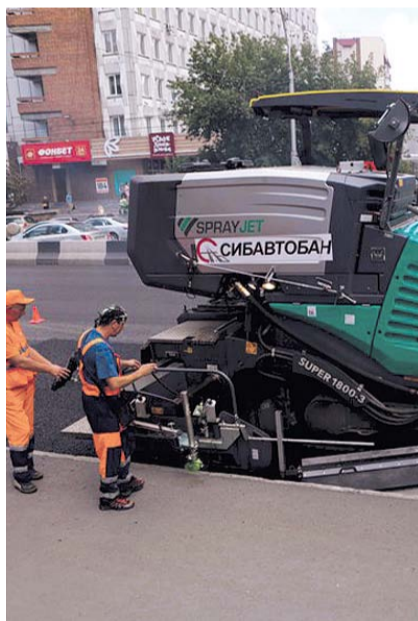
НА ФОТО: КАЧЕСТВО АСФАЛЬТА УЛУЧШИТСЯ

Напомним, развитие дорожно-транспортной инфраструктуры выделено мэром Анатолием ЛОКТЕМ , как один из основных приоритетов развития Новосибирска на ближайшие годы. Реализация этого направления стала возможным после попадания Ново-