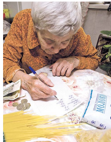
НА ФОТО: ПЕНСИОНЕРЫ ВЫНУЖДЕНЫ СЧИТАТЬ КАЖДУЮ КОПЕЙКУ

Ученые отмечают, что сегодня настроения пенсионеров относительно своего экономического будущего во многом схожи с настроениями, харак-