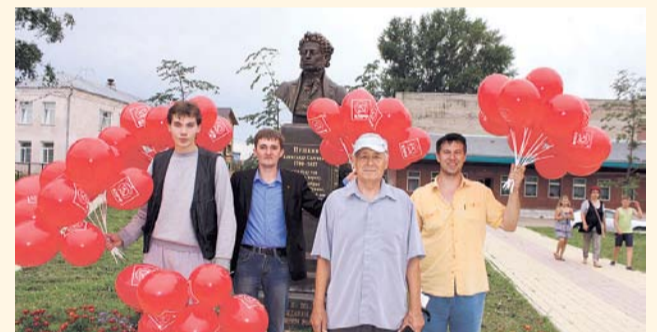
НА ФОТО: КОММУНИСТЫ ПОЗДРАВИЛИ БОЛОТНОЕ С ПРАЗДНИКОМ