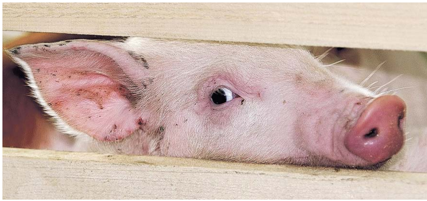
НА ФОТО: ОПАСНЫЙ ВИРУС МОЖЕТ ПОПАСТЬ К НАМ ИЗ ОМСКОЙ ОБЛАСТИ