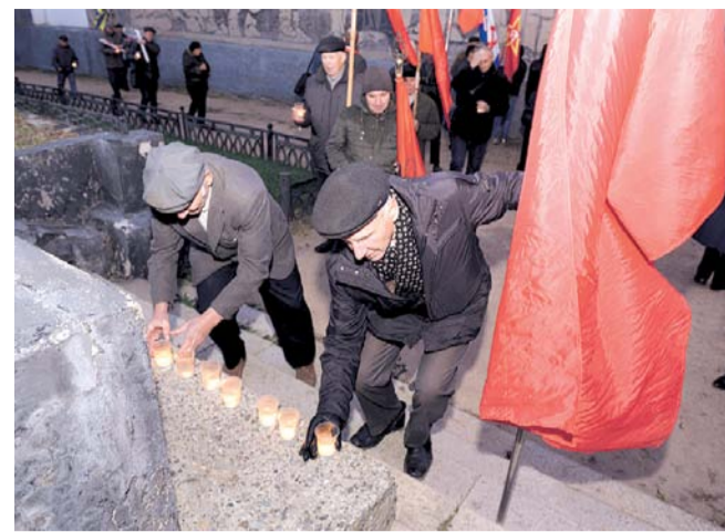
НА ФОТО: СВЕЧИ В ПАМЯТЬ О ЗАЩИТНИКАХ СОВЕТОВ