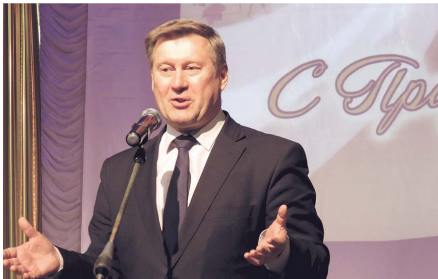
НА ФОТО: МЭР НОВОСИБИРСКА ПОЗДРАВИЛ СОБРАВШИХСЯ