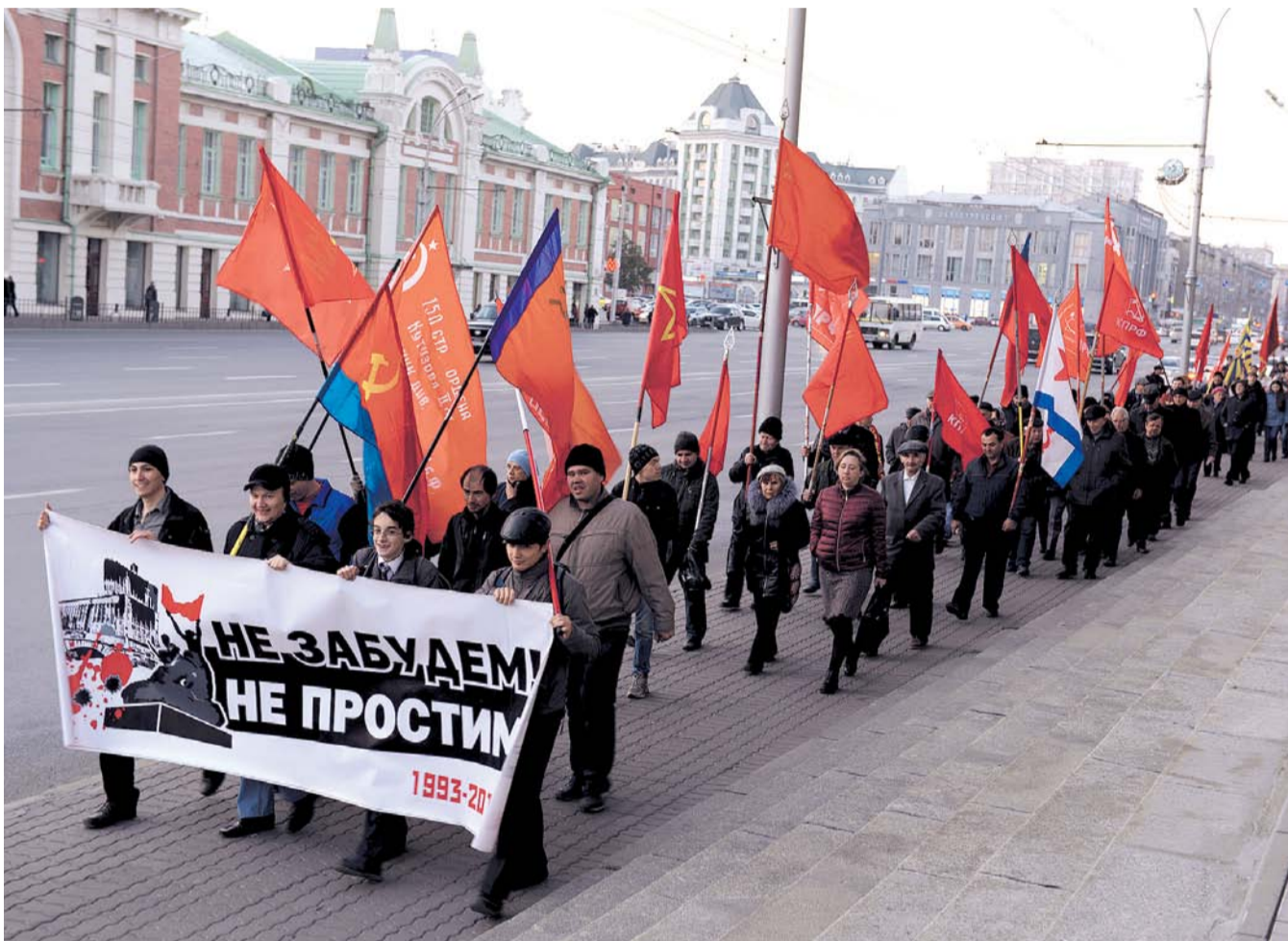
НА ФОТО: ПОЧИТИТЬ ПАМЯТЬ ЗАЩИТНИКОВ СОВЕТОВ ПРИШЛИ СОТНИ НОВОСИБИРЦЕВ