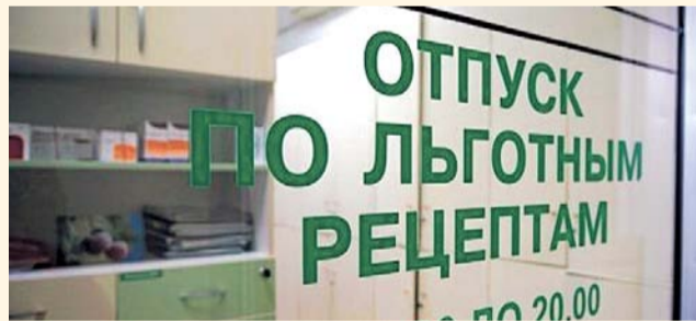
НА ФОТО: РЕЦЕПТЫ ЕСТЬ, ЛЕКАРСТВ НЕТ

Пенсионеры и ветераны обращаются во все инстанции — необходимые лекарства приходят в поликлиники с большим опозданием.