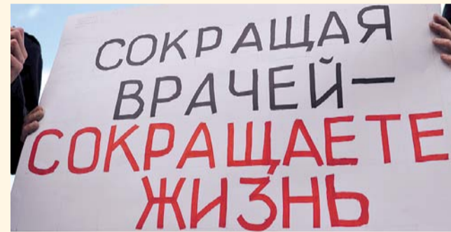
НА ФОТО: НА СЕЛЕ КАЧЕСТВЕННАЯ МЕДПОМОЩЬ В ДЕФИЦИТЕ