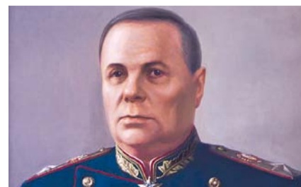
НА ФОТО: КИРИЛЛ МЕРЕЦКОВ

Авторы книг о знаменитых полководцах нередко уверяют, что их герои уже с детства мечтали о боевых походах и победных баталиях. А вот Кириллу МЕРЕЦКОВУ, внуку крепостного и сыну бедного крестьянина, и не мерещились военные лавры. В самых смелых детских мечтах он видел себя народным учителем. Не думал он, впервые надевая шинель в свои 20 лет, что в его походной сумке лежит «маршальский жезл».