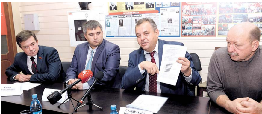
НА ФОТО: КАНДИДАТЫ ОТ КПРФ ПОДВЕЛИ ИТОГИ ВЫБОРОВ

Третьим фактором стало радикальное реформирование партийного пространства. В бюллетене партий было 14 — против 7 в 2011. «Единой России» такое количество карликовых партий выгодно — во-первых, все голоса партий, не прошедших в Госдуму, передаются ей (по так называемому «методу империяле»), а во-вторых, появилась легальная возможность борьбы с конкурентами путем создания партий-спойлеров. Самый известный пример — «Коммунисты России», на «раскрутку» которых были выделены огромные средства. Еще больше средств получила ЛДПР. Владимир ЖИРИНОВСКИЙ еще с 1999 года доказал свою лояльность Кремлю, а его популистские выступления