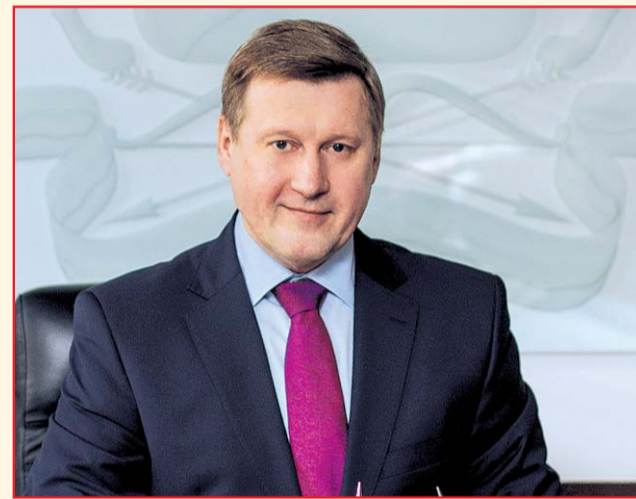
НА ФОТО: АНАТОЛИЙ ЛОКОТЬ

Уважаемые педагоги Новосибирска и ветераны образования!