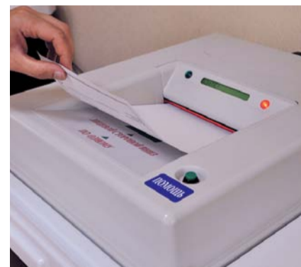
НА ФОТО: ХИТРЫЕ УСТРОЙСТВА НЕ МЕШАЮТ МУХЛЕВАТЬ

Говорю: надо гасить чистые бюллетени, а члены комиссии все тянут. Проверили содержимое в переносных урнах, высыпали бюллетени из КОИБов, не проверяя их, естественно, сложили стопочкой. Нам объяснили — пересчиты-