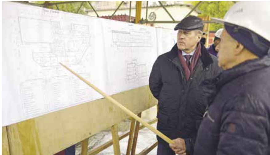
НА ФОТО: МЭР НОВОСИБИРСКА АНАТОЛИЙ ЛОКОТЬ НА ОСМОТРЕ СТРОИТЕЛЬНОЙ ПЛОЩАДКИ

Мэр Новосибирска Анатолий ЛОКОТЬ посетил площадку, где должно появиться новое здание 54-й школы. Сейчас идут работы по подготовке будущего фундамента четырехэтажного здания — выкопан котлован, идет заливка бетона и установка арматуры.