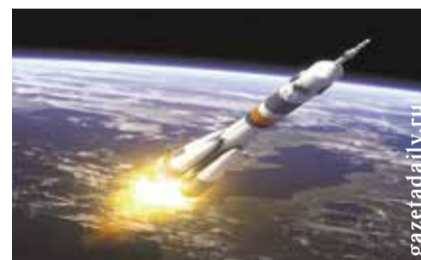
НА ФОТО: ОГРОМНЫЕ ДЕНЬГИ ВЫБРОШЕНЫ В КОСМОС

Специалисты отмечают, к запуску на этот раз готовились не профессиональные космонавты, знающие, на что они идут, и прошедшие предварительный строгий отбор, а люди, к космосу