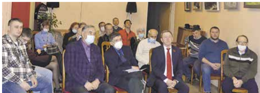
НА ФОТО: УЧАСТНИКИ ПЛЕНУМА СОВЕТСКОГО МЕСТНОГО ОТДЕЛЕНИЯ

— Мы недоработали на выборах, хотя шансы победить были.