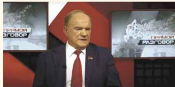
НА ФОТО: ГЕННАДИЙ ЗЮГАНОВ В ЭФИРЕ ТЕЛЕКАНАЛА «КРАСНАЯ ЛИНИЯ»

Председатель ЦК КПРФ Геннадий ЗЮГАНОВ в эфире канала «Красная линия» поблагодарил мэра Новосибирска Анатолия ЛОКТЯ за хороший результат, который показали коммунисты на выборах в Госдуму в НСО.