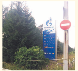
НА ФОТО: НИ АЗС, НИ ТОПЛИВА