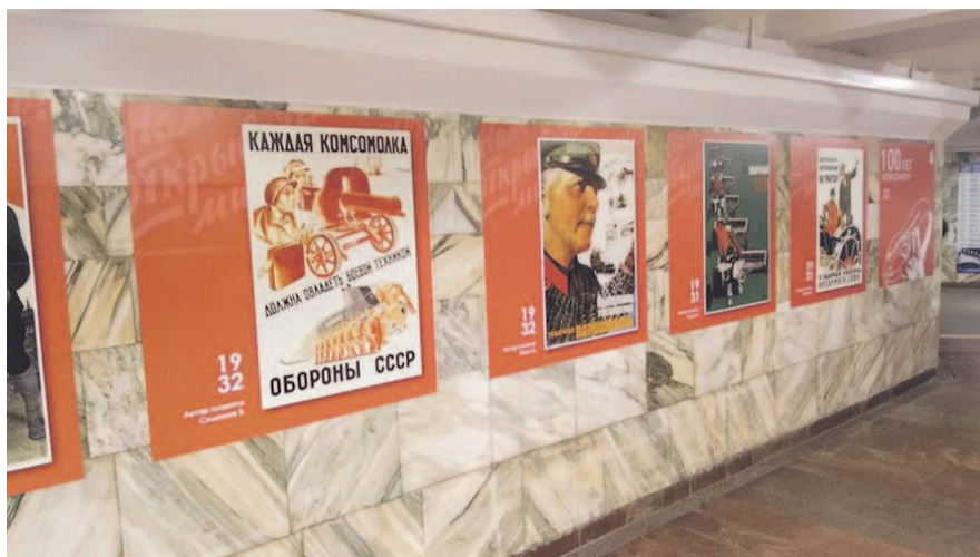
НА ФОТО: ГОРОД ОТМЕЧАЕТ СТОЛЕТИЕ КОМСОМОЛА

В честь юбилея ВЛКСМ в городе уже прошел городской праздник «Имена, опаленные войной», который был посвящен деятельности комсомольцев во времена Великой Отечественной войны. Также в Новосибирске открыли выставку «Комсомольская юность моя», рассказывающую об армейских достижениях молодежи в советское время, экспозиции «Пять букв юности» об истории молодежных свершений в науке, спорте, стройках, КВН и