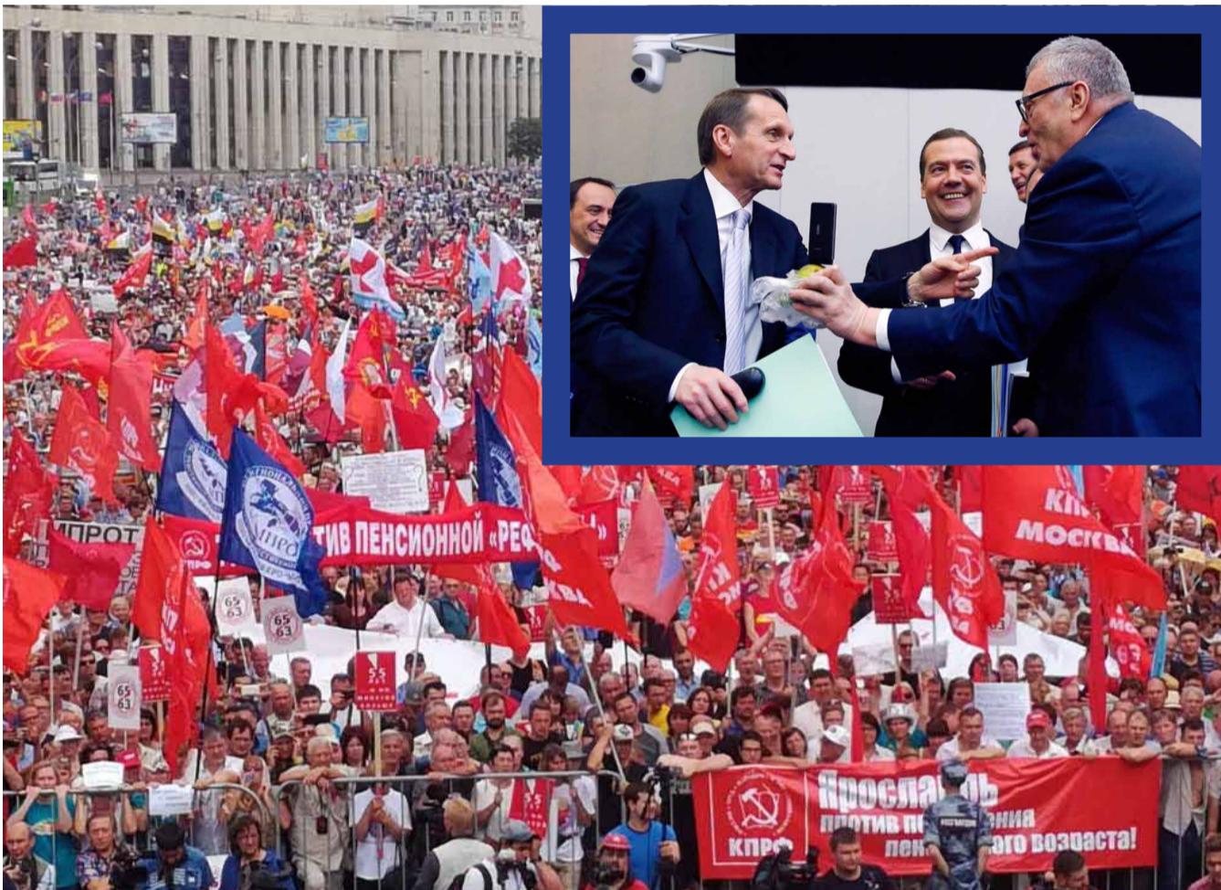
НА ФОТО: ПОКА ОДНИ ЗАИГРЫВАЮТ С ВЛАСТЬЮ, ДРУГИЕ — ПРОТЕСТУЮТ ВМЕСТЕ С НАРОДОМ!