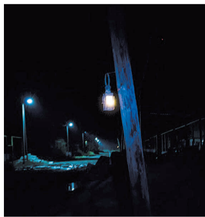
НА ФОТО: «МАШИНА ВРЕМЕНИ» ПО-ЧАНОВСКИ

— Ранее на месте другой такой же ямы, уже по улице Чехова, тоже, кстати, по жалобам жителей, что ни пройти, ни проехать, мы с нашими ре-