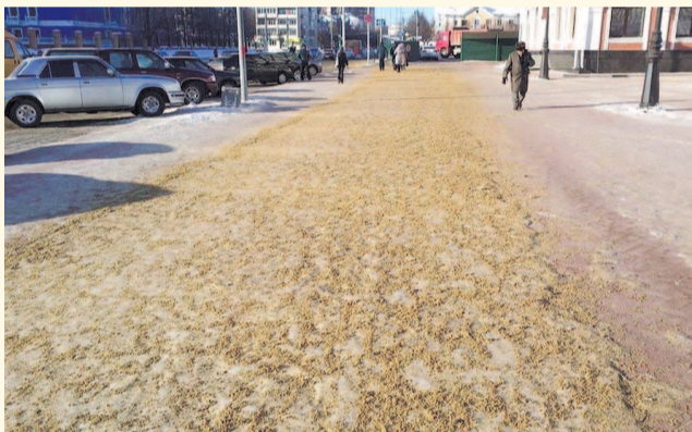
НА ФОТО: ТЕПЕРЬ НА УЛИЦАХ БУДЕТ ЧИЩЕ