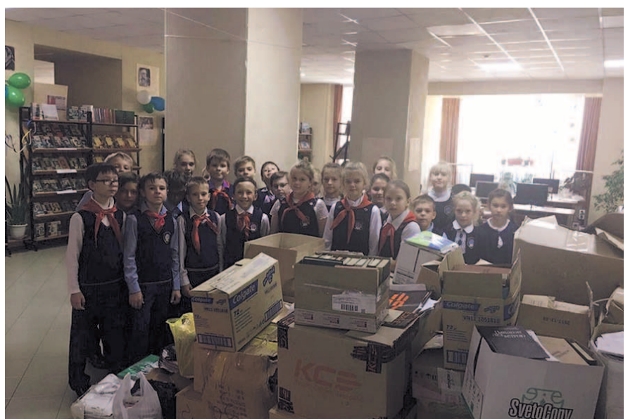
НА ФОТО: ПИОНЕРЫ СОБРАЛИ МАКУЛАТУРУ