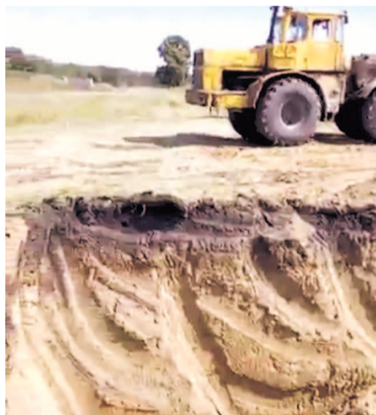
НА ФОТО: ЯМЫ БРОСАЮТ БЕЗ РЕКУЛЬТИВАЦИИ, ОНИ ЗАРАСТАЮТ, ЗАПОЛНЯЮТСЯ МУСОРОМ И ВОДОЙ

После широкой огласки в СМИ на проблему наконец-то обратили внимание, была проведена выездная проверка, в ходе которой было обнаружено четыре нелегальных карьера. Вот только виновных установили лишь в одном случае: нарушителей удалось поймать, что называется, на месте преступления, застав работающую технику и