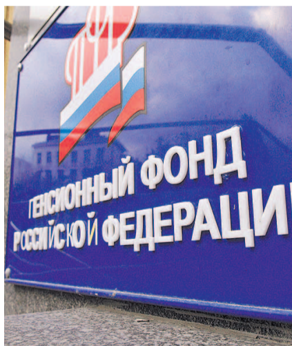
НА ФОТО: А ТУТ ВСЕ О НАРОДЕ ДУМАЮТ...

В свою очередь, министр финансов и первый вице-премьер Антон СИЛУАНОВ уточнил, что его ведомство будет увеличивать трансферты Пенси-