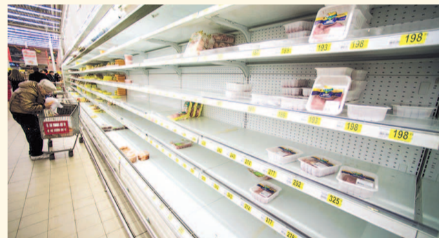
НА ФОТО: ВЕРНЕМСЯ ВО ВРЕМЕНА ДЕФИЦИТА?