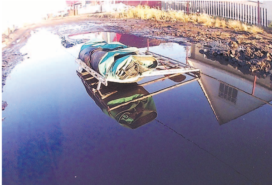
НА ФОТО: В ЭТОЙ ЛУЖЕ ЗАПРОСТО УТОНЕТ ЛЕГКОВОШКА

— Еще и фонарь убрали с перекрестка, — отмечает местная жительница Ольга ТИМОФЕЕВА , — переулочек темный. А ведь на этом участке улицы