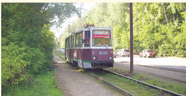
НА ФОТО: ЭКОЛОГИЧНЫЙ И ЭКОНОМИЧНЫЙ ТРАНСПОРТ