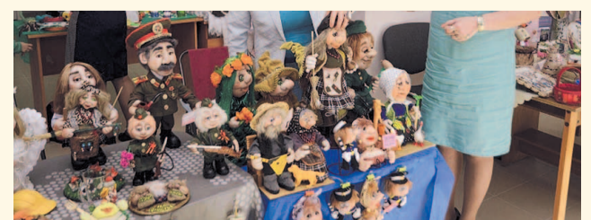
НА ФОТО: РУКОДЕЛЬНЫЕ КУКЛЫ