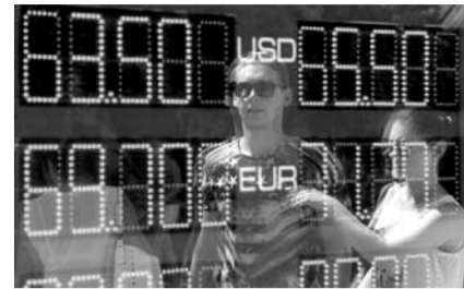
НА ФОТО: «ПЛАВАЮЩИЙ» КУРС

Если Китай притормозит сильнее, чем это ожидается по прогнозам Все-