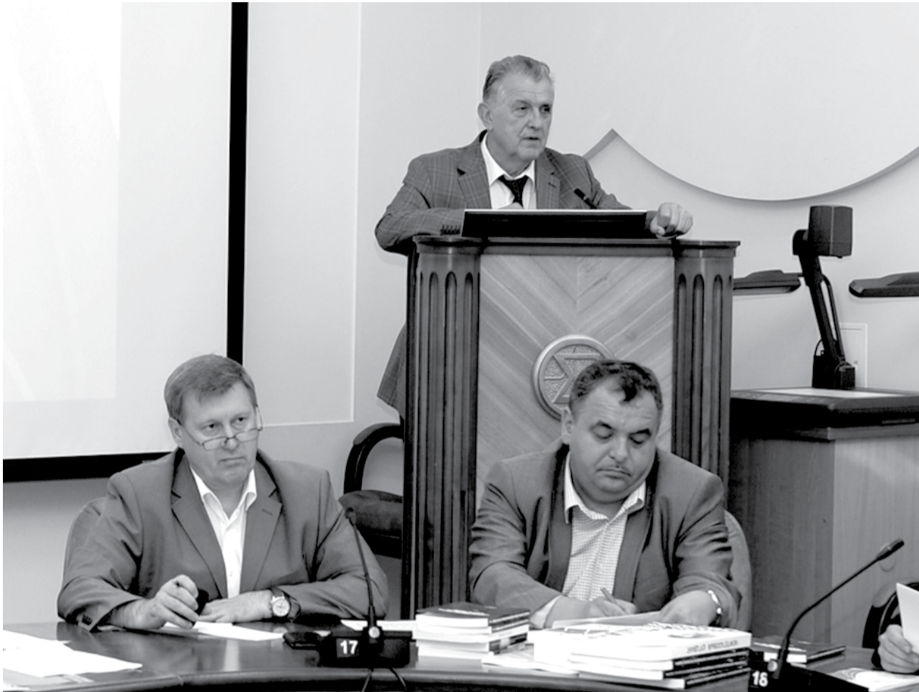
НА ФОТО: ВЫСТУПАЕТ ЗАМЕСТИТЕЛЬ ПРЕДСЕДАТЕЛЯ СО РАН, АКАДЕМИК НИКОЛАЙ ДИКАНСКИЙ