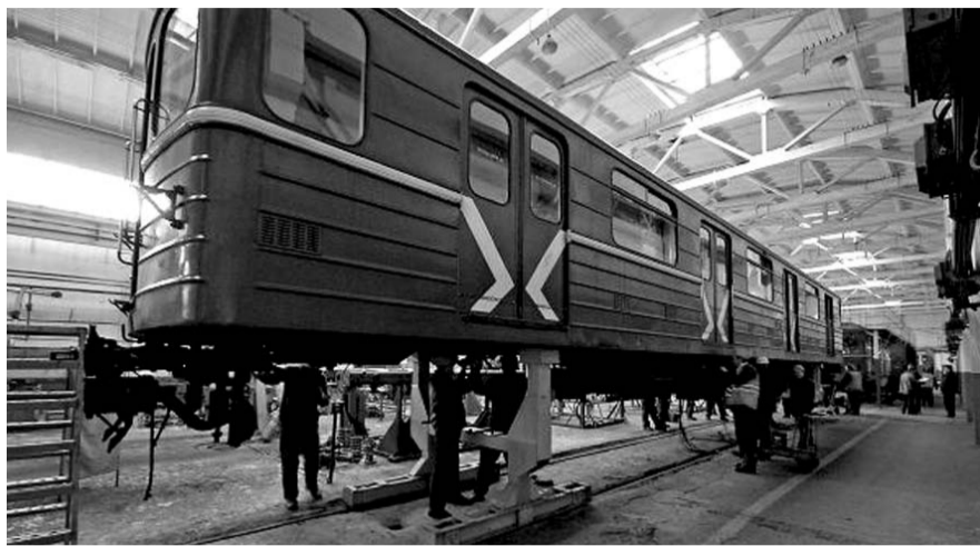
НА ФОТО: НОВОСИБИРСКИЙ МЕТРОПОЛИТЕН РАЗВИВАЕТСЯ

— Главная тема сегодня — это предстоящие 13 сентября выборы в Горсовет и Законодательное собрание региона. Мы постоянно встречаемся с