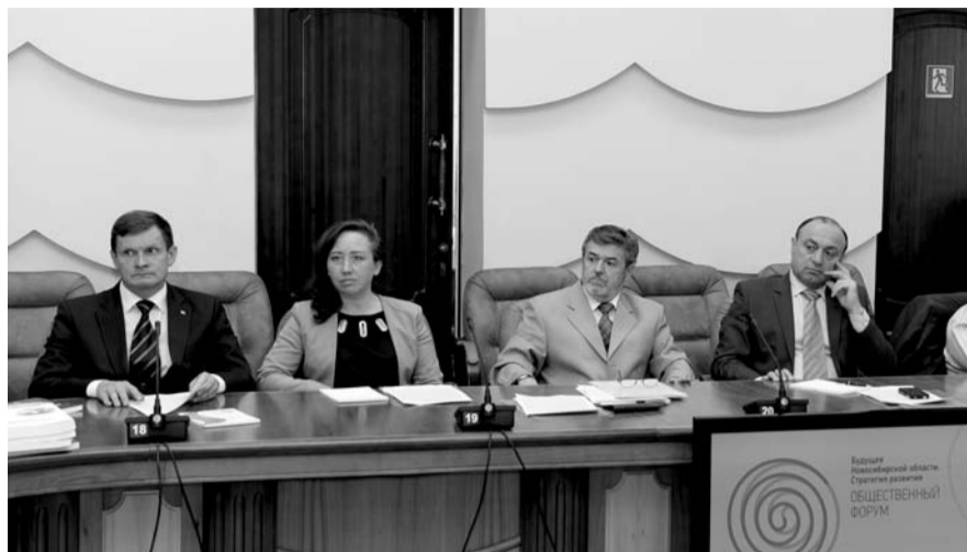
НА ФОТО: НА ФОРУМЕ

— Все эти годы доля обрабатывающих производств в общем объеме народного хозяйства падала — с 16,6% в 2004 году до 14%. Но в прошлом году мы создали совет про промышленности, на базе которого провели несколько совещаний по импортозамещению. Были определены точки роста для производства, прежде всего — оборонно-промышленный комплекс. В Новосибирске формируется приборостроительный кластер, сейчас работаем над развитием электронно-компонентной отрасли, ведь ежегодно только для отечественной космической промышленности закупается иностранная электроника на сумму 2 миллиарда долларов. В рамках наших муниципальных программ мы помогаем и гражданским производствам, у нас много интересных предприятий. Дальнейшие перспективы могут быть