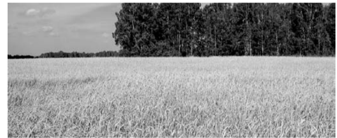
НА ФОТО: КАКОЙ УРОЖАЙ СОБЕРУТ НОВОСИБИРСКИЕ АГРАРИИ?