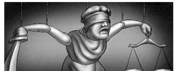
НА ФОТО: КОМУ НА РУКУ СЛЕПАЯ ФЕМИДА?