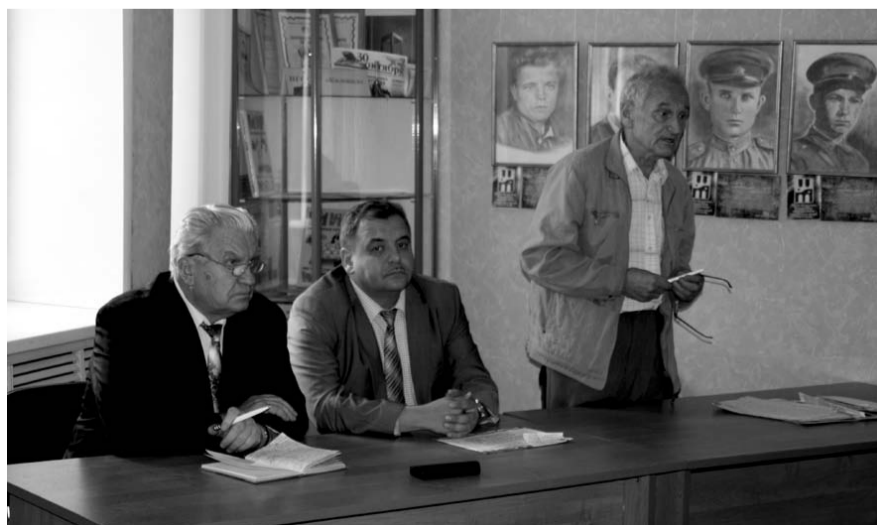
НА ФОТО: ИМЕЕМ ПРАВО ВЫБИРАТЬ!