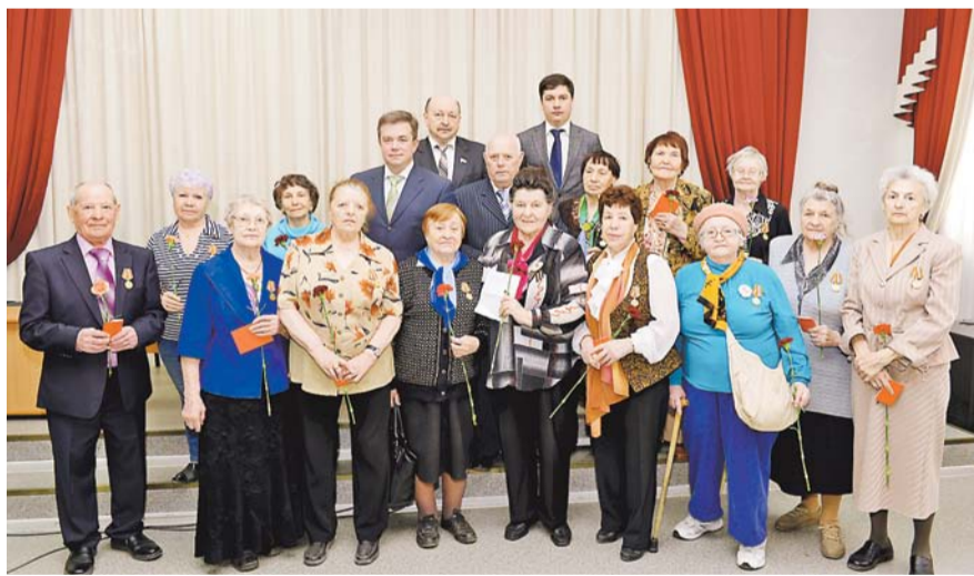
НА ФОТО: ДЕПУТАТЫ КПРФ НА ВСТРЕЧЕ С «ДЕТЬМИ ВОЙНЫ»

26 апреля в зале Дома офицеров было многолюдно — здесь состоялось торжественное собрание областной общественной организации детей погибших участников Великой Отечественной войны «Эхо», посвященное предстоящей 71-й годовщине Великой Победы.