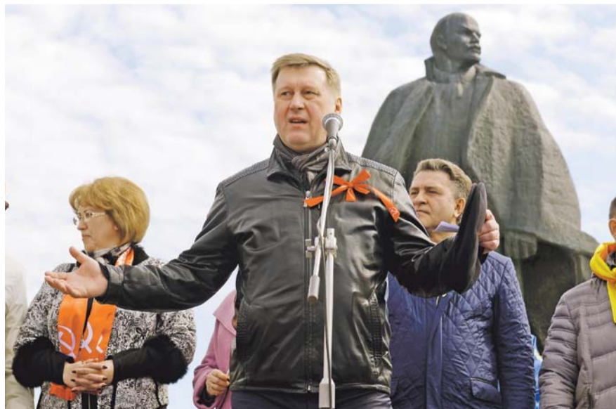
НА ФОТО: АНАТОЛИЙ ЛОКОТЬ ПОЗДРАВИЛ НОВОСИБИРЦЕВ С ПЕРВОМАЕМ

— Пора уже от слов переходить к делу, помнить всем, что Россия — социальное государство. Пока рост цен и тарифов значительно опережает рост зарплат и пенсий.