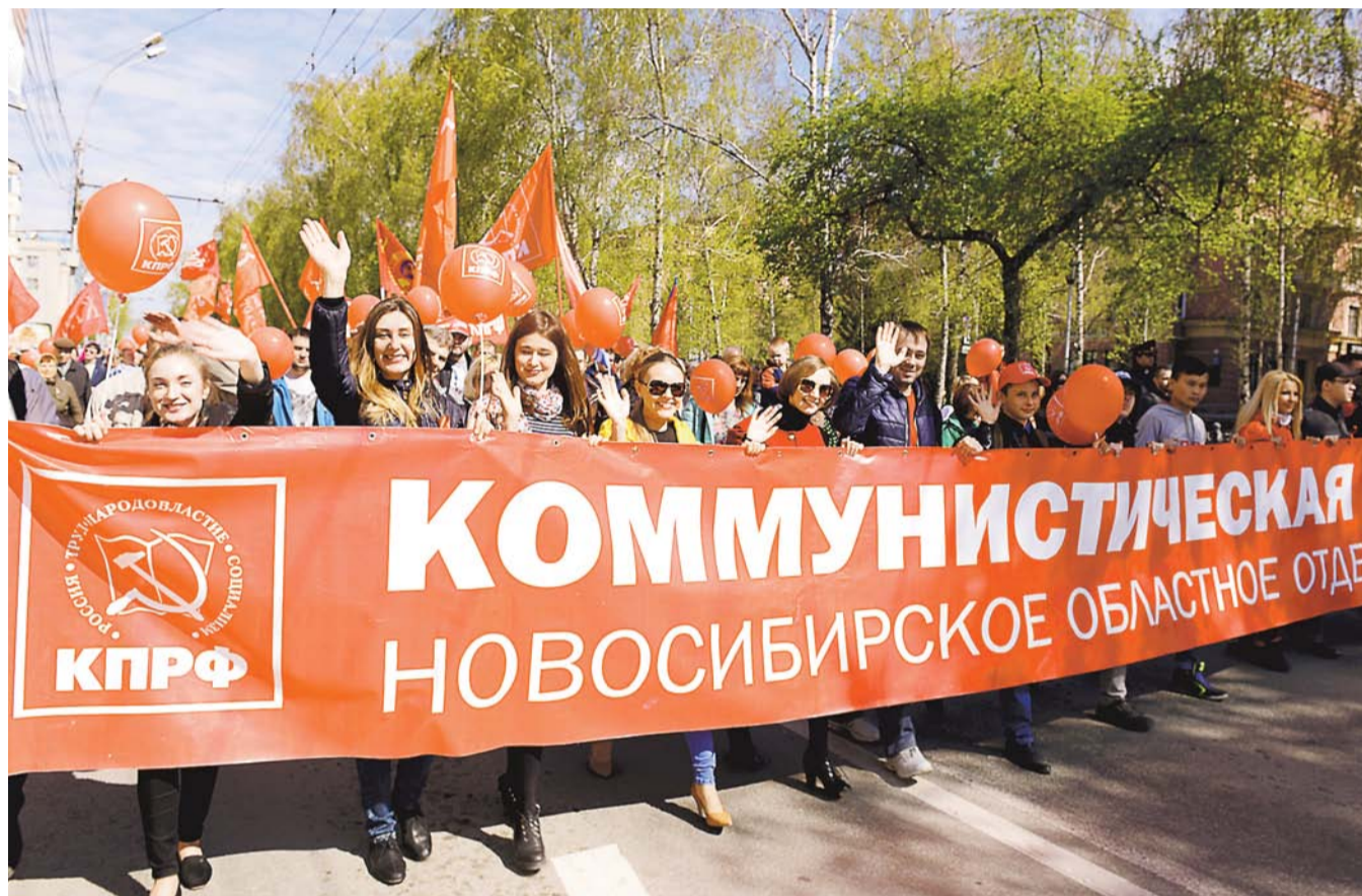
НА ФОТО: БОЛЕЕ ДВУХ ТЫСЯЧ ЖИТЕЛЕЙ ПРОШЛИ В РЯДАХ ПЕРВОМАЙСКОЙ ДЕМОСТРАЦИИ ПО КРАСНОМУ ПРОСПЕКТУ