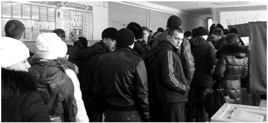
● НА ФОТО: НА УЧАСТКАХ В ШКОЛЕ №91 ВЫСТРОИЛАСЯ ОЧЕРЕДЬ ДЛЯ ГОЛОСОВАНИЯ