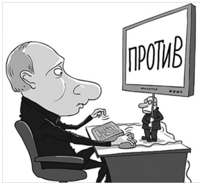
карикатура Сергея ЕЛКИНА / РОИЦ.РУ