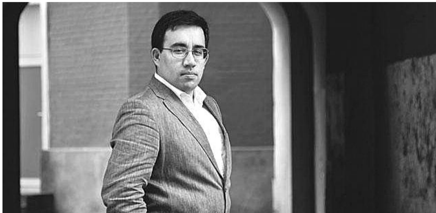
■ НА ФОТО: АЛЕКСАНДР ДЮКОВ ТЕПЕРЬ ПЕРСОНА НОН ГРАТА В ЛАТВИИ

Русские историки Латвии считают, что правительство республики использует любые средства, чтобы замолчать исторические факты, которые развенчивают пропагандируемую им мифологию.