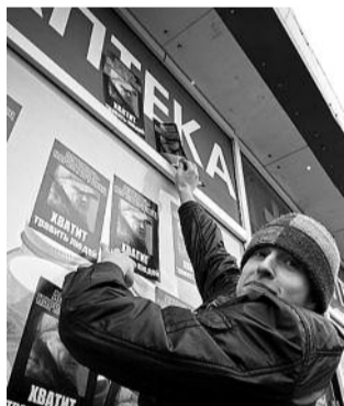
■ НА ФОТО: В БЫСТРОВКЕ ЗАКРЫЛИ ЕДИНСТВЕННУЮ АПТЕКУ НА ПЯТЬ ДЕРЕВЕНЬ

Есть в Искитимском районе село Быстровка, расположена в 60 км от г. Искитима. Обычная деревня. В советские времена процветала — была работа, был достаток. Сейчас деревня дышит на ладан.