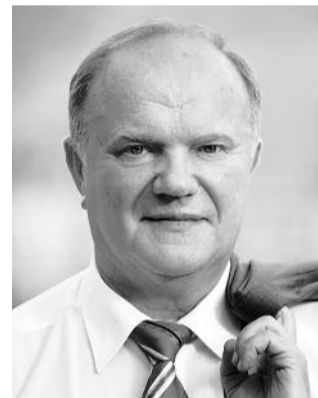
● НА ФОТО: ЛИДЕР КПРФ

Но заверяю вас, править по-старому они не смогут. Потому что править вместе с СЕРДЮКОВЫМ, ФУРСЕНКО и ЧУБАЙСОМ не получится. Уже в феврале на половине предприятий Российской Федерации начались задержки с выплатой заработной платы.