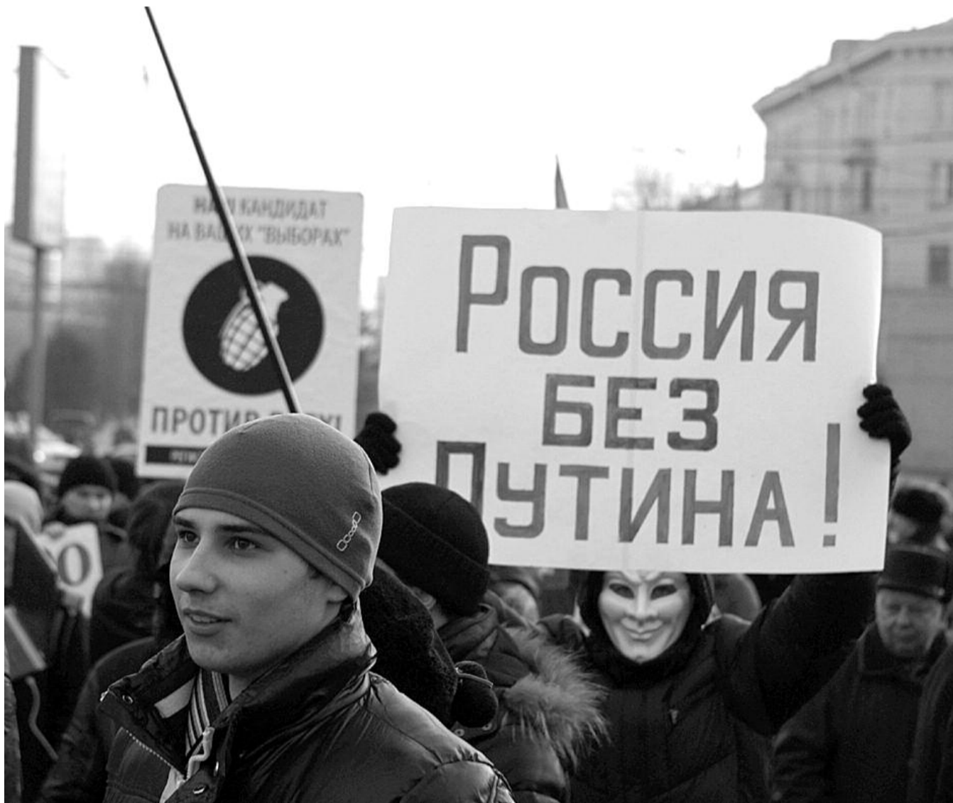
● НА ФОТО: СОБРАВШИЕСЯ НА МИТИНГ 5 МАРТА БЫЛИ КАТЕГОРИЧНЫ