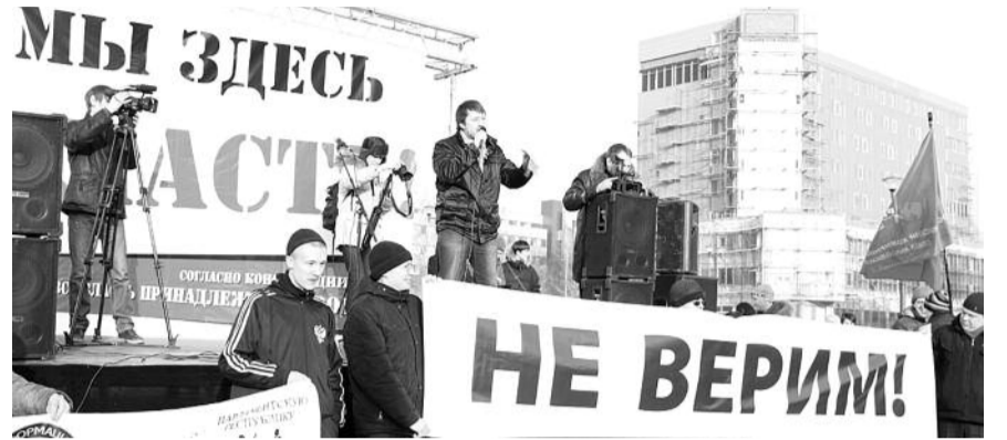
● НА ФОТО: НОВОСИБИРЦЫ НЕ ПОВЕРИЛИ В «ЧИСТУЮ» ПОБЕДУ ПУТИНА

Митинг «За честные выборы! За гражданские и конституционные права!» собрал на площади Пименова представителей политических партий, гражданских активистов и просто неравнодушных жителей Новосибирска. Власти делали все, чтобы не допустить появления людей на протестных митингах. Уговаривать пытались даже через территориальные избирательные комиссии. Для полиции оппозиционеры стали «мишенью». По нашей информации, новосибирские ОМОНовцы проводили учения по усмирению толпы, и пятого марта новосибирские полицейские с коллегами из других городов усмиряли несогласных в Москве. Но проблем для властей хватало и в Новосибирске — сибиряки усомнились в итогах выборов, не поверив в сказки центральных телеканалов о том, что ролики о фальсификациях на избирательных участках снимаются в студиях и выкладываются на американских серверах.