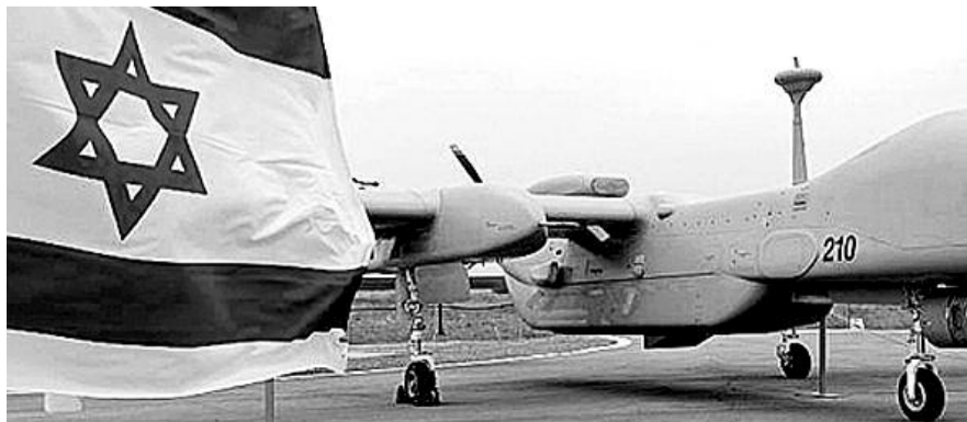
● НА ФОТО: ПОЛУЧИТ ЛИ ИЗРАИЛЬСКАЯ АВИАЦИЯ КОМАНДУ «НА ВЗЛЕТ»?