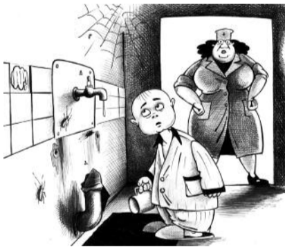
■ НА РИС.: В БОЛЬНИЦУ ЛУЧШЕ НЕ ПОПАДАТЬ

ний, больной при желании может пользоваться своим постельным бельем и посудой.