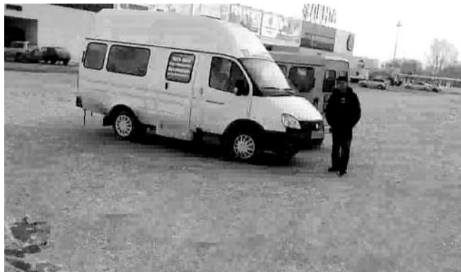
■ НА ФОТО: ЗАФИКСИРОВАННЫЙ «ПОДВОЗ» НА УЧАСТКЕ №1709

Во все времена среди народа были шрейкбрехеры или, по-простому, — предатели. Но такого наплыва этого отребья, как в день выборов 4 марта, я еще не видел!