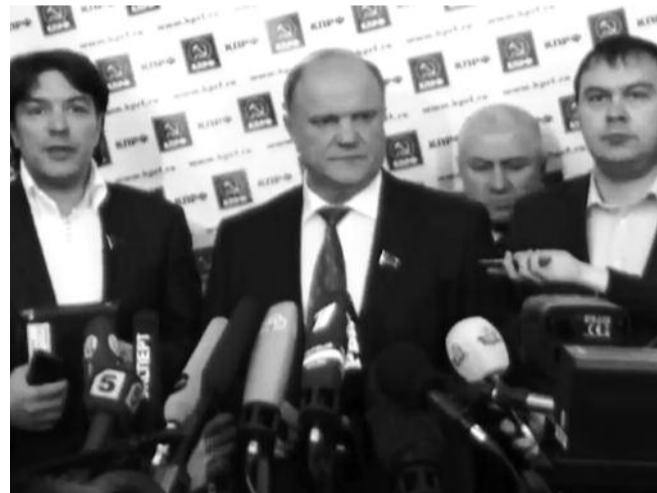
● НА ФОТО: БРИФИНГ КАНДИДАТА ЗЮГАНОВА В НОЧЬ ВЫБОРОВ

Я считаю, что в обществе наступает новая эпоха. Проводить прежнюю политику со старой потрепанной ельцинской командой и отрывками с ельцинского стола он не сможет. Придется думать о новой кадровой политике. А продолжать курс, связанный с поддержкой олигархии и вороватого чиновничества, — это значит загнать нашу промышленность в очень и очень глубокую яму.