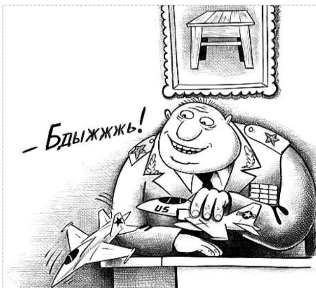
карикатура Сергея КОРСУНА с сайта CARICATURA.RU