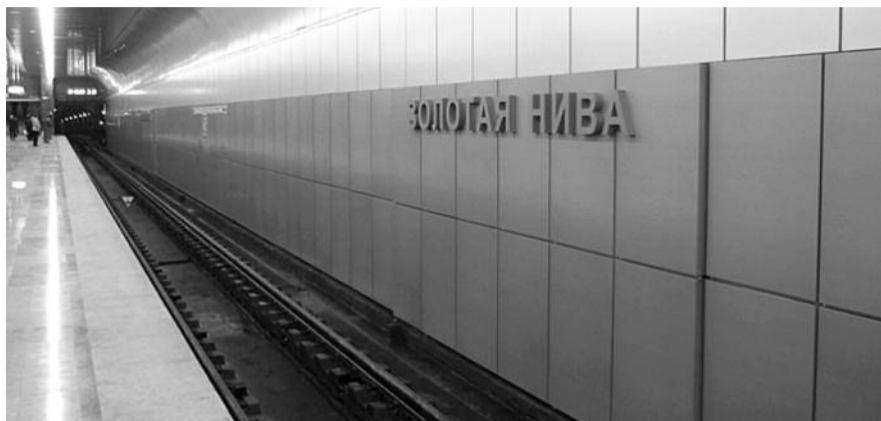
● НА ФОТО: ПРИ СТРОИТЕЛЬСТВЕ СТАНЦИИ «ПОТЕРЯЛИСЬ» 578 МИЛЛИОНОВ РУБЛЕЙ

открытие «Золотой Нивы» в октябре 2010 года было предвыборным шоу, хотя на деле строительство станции — самая грандиозная афера последних лет в Новосибирске: