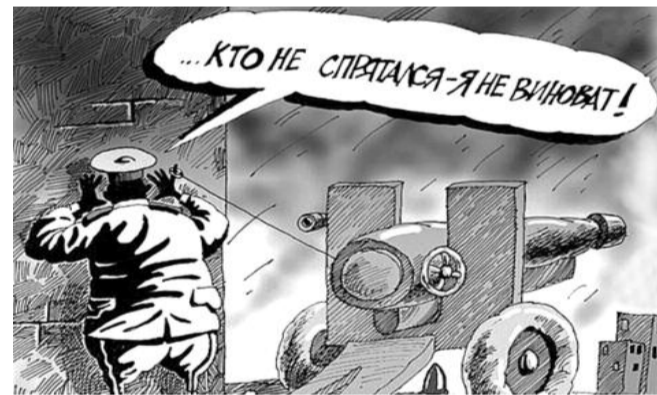
● НА РИС.: СЕРДЮКОВСКИЕ РЕФОРМЫ ДО ДОБРА НЕ ДОВЕДУТ