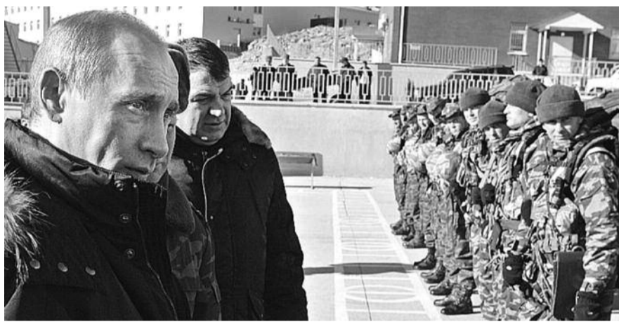
● НА ФОТО: ПРЕМЬЕР ПУТИН «ПРИКРЫЛ» МИНИСТРА СЕРДЮКОВА

Премьер-министр Владимир ПУТИН , вмешавшись в ситуацию со срывом размещения гособоронконтракта, фактически спас министра обороны, обещавшего президенту МЕДВЕДЕВУ 12 июля разобраться в десятидневный срок, — премьер разрешил продлить обещания еще на месяц. Одни эксперты отмечают, что срок был нереальный, другие — что Путин этим продемонстрировал, что у Медведева не осталось тем, которые он мог бы считать своими.