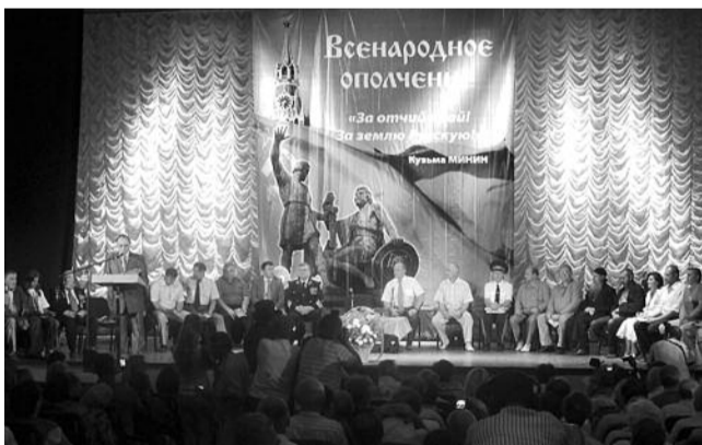
● НА ФОТО: СОБРАНИЕ «ВСЕНАРОДНОГО ОПОЛЧЕНИЯ»

нять перед ними обязательства и реальную программу, — говорит лидер российских коммунистов. — Две недели назад на пленуме КПРФ с участием талантливых ученых, предпринимателей, промышленников, финансистов мы приняли программу безопасности страны из 10 конкретных пунктов, которые мы обязуемся выполнить перед своими гражданами.