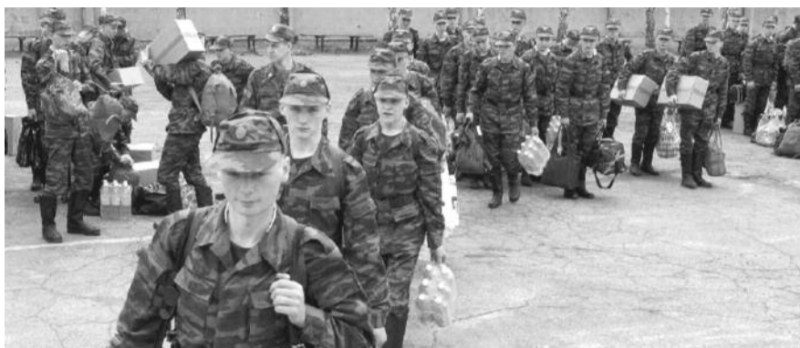
● НА ФОТО: ВОЕНКОМАТЫ ВЫНУЖДЕНЫ СНИЖАТЬ ТРЕБОВАНИЯ К ПРИЗЫВНИКАМ