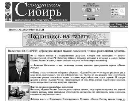
● НА ФОТО: ИНТЕРВЬЮ МОЖНО ПРОЧИТАТЬ И НА САЙТЕ ГАЗЕТЫ «СОВЕТСКАЯ СИБИРЬ»

сегодняшний день нет достаточно квалифицированных кадров». На другие примитивизмы мысли, вроде: «Большая часть активистов нынешней КПРФ — работники идеологических подразделений КПСС, поэтому им не нужна власть», даже отвечать неприлично. Как понимать все это? Как демонстрацию только удивительной неосведомленности? Поясним. В последней программе КПРФ, принятой VIII (внеочередным) Съездом КПРФ 19 января 2002 г., в разделе «Наши цели и задачи» записано: «участие в политической жизни общества посредством влияния на формирование политической воли граждан в целях завоевания политической власти (выделено мною — прим. автора) и обеспечения подлинного народолюбия в РФ». Что же касается программы действия коммунистов, она подробно изложена в упомянутой программе КПРФ. Более того, в последующих документах применительно к сложившимся обстоятельствам в государстве даются конкретные предложения по улучшению положения в стране. В частности, известная антикризисная программа КПРФ была доложена президенту РФ. Действительно, наши программы действий никогда не расходились и не будут расходиться с идеологическими постулатами, поскольку исходят и будут исходить прежде всего из интересов людей труда. Именно исходя из этих интересов, в своей