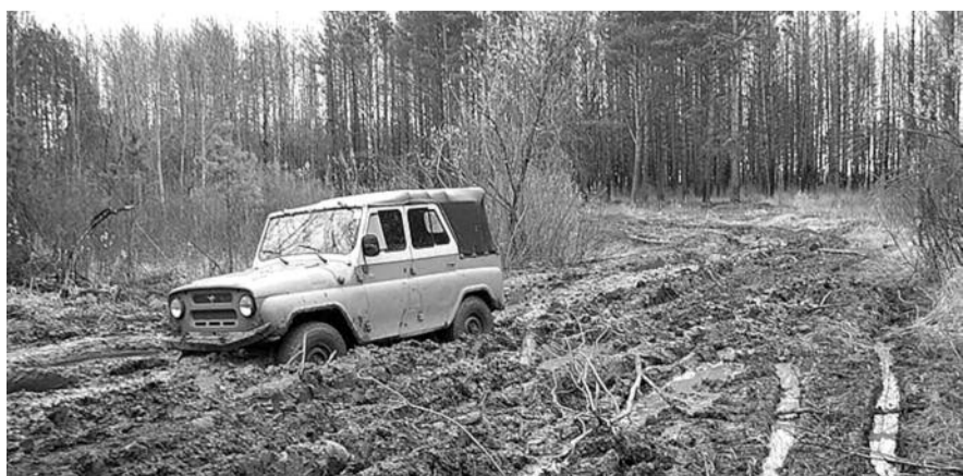
● НА ФОТО: ПРОБЛЕМУ ДОРОГ ОПРОШЕННЫЕ НАЗЫВАЮТ ОСНОВНОЙ