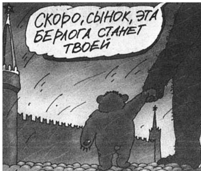
● НА РИС: «МЕДВЕДИ» ПРИВОДЯТ ВО ВЛАСТЬ СВОИХ, ПРИКОРМЛЕННЫХ

Планируется, что первым в списке новосибирских единороссов станет известный спортсмен Александр КАРЕЛИН . На прошлых выборах из-за противоречий с прежним руководством области он отказался баллотироваться в нашем регионе и прошел в Госдуму от Ставропольского края. Теперь у руля в области другие люди, а с ними и другие взаимоотношения. Александр Александрович стал появляться в области, «светиться» на партийных мероприятиях. Новосибирский филиал партии власти получает известного человека в свой список одновременно с надеждой хоть на какую-то поддержку населения, а Карелин получает мандат.