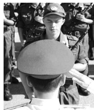
● НА ФОТО: СНИЖЕНИЕ ПРЕСТУПНОСТИ — ФАЛЬСИФИКАЦИЯ?

Последние несколько лет отчеты МВД РФ свидетельствовали, что преступность в стране резко снижается. В конце прошлого года министерство отrapортвало, что раскрываемость преступлений достигла 97 процентов! Согласно отчетам, в 2001 году в стране было зарегистрировано 34 200 убийств, а в 2009 году — 18 200.