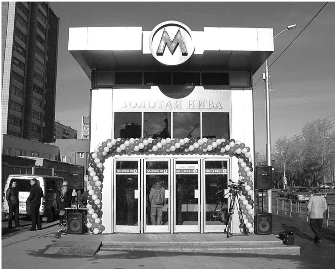
● НА ФОТО: ТРИНАДЦАТУЮ СТАНЦИЮ НОВОСИБИРСКОГО МЕТРО БУДУТ РЕГУЛЯРНО ОТКРЫВАТЬ ПЕРЕД ВЫБОРАМИ?