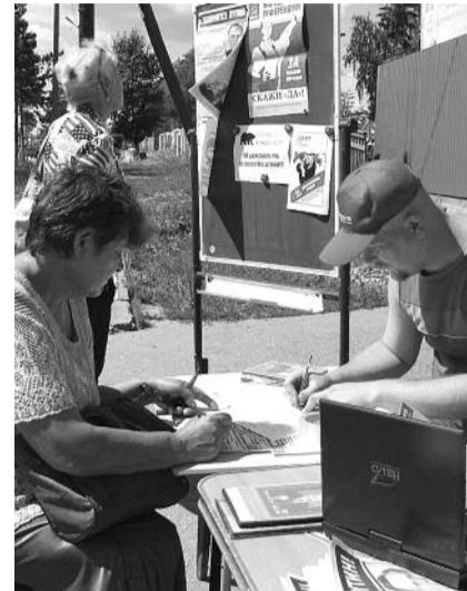
■ НА ФОТО: ИДЕТ ГОЛОСОВАНИЕ

С отстающими организациями по линии орготдела были составлены беседы с секретарями. Критике были подвергнуты районные организации на местных конференциях и на областной партийной конференции. Подавляющее большинство руководителей организаций сделали выводы и активизируют работу: