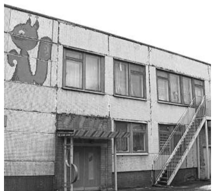
● НА ФОТО: К ПЕРВОМУ СЕНТЯБРЯ НЕ УДАСТСЯ ОБОРУДОВАТЬ ОБЕЩАННЫЕ МЕСТА

Предвыборный пиар «Единой России» начинает переходить в свой традиционный предвыборный формат. Появилась информация, что на развитие сети детских садов Новосибирская область из федерального бюджета получит «целых» 32 миллиона рублей. Средства будут выделяться в виде субсидий из федерального бюджета и пойдут на оснащение вновь вводимых мест в детсадах необходимым оборудованием.