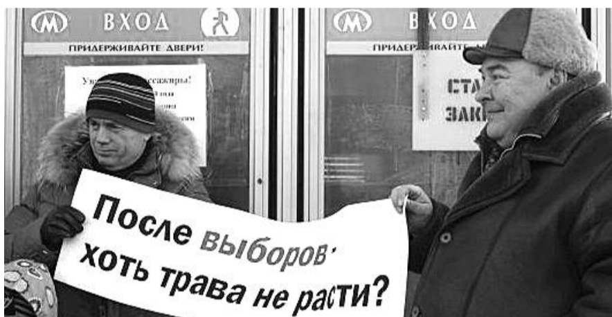
● НА ФОТО: ОТ НАРОДА ПРАВДУ НЕ СКРОЕШЬ. ПИКЕТ У ЗАКРЫТОЙ СТАНЦИИ 28 НОЯБРЯ 2010 ГОДА