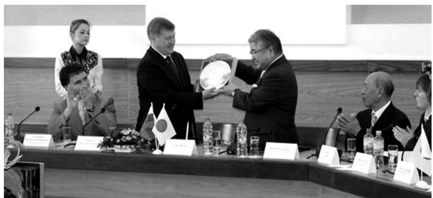
НА ФОТО: ЯПОНСКАЯ ДЕЛЕГАЦИЯ В МЭРИИ НОВОСИБИРСКА