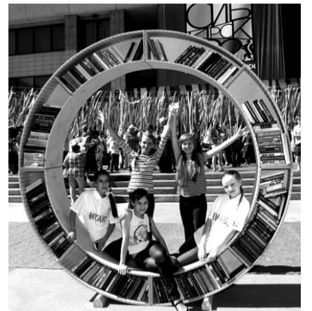
НА ФОТО: ПРАЗДНИК УДАЛСЯ!

Анатолий Локоть встретился с делегациями городов-побратимов. А в сквере у НГАТОиБ открылась уличная фотовыставка «История и современность» и праздничный концерт с участием мастеров искусств Новосибирской государственной филармонии. На пл. Ленина в 10-00 началась утренняя зарядка с олимпийскими чемпионами, а в 12-00 состоялось торжественное открытие Дня города, после чего началась праздничная программа с уча-