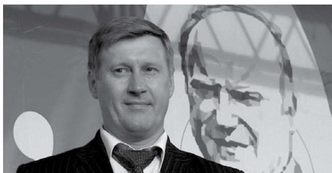
НА ФОТО: АНАТОЛИЙ ЛОКОТЬ