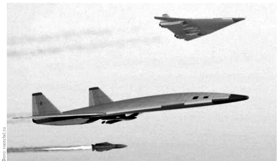
НА ФОТО: НОВОЕ ВЫСОКОТОЧНОЕ СВЕРХБЫСТРОЕ ОТЕЧЕСТВЕННОЕ ОРУЖИЕ

Стоит отметить, что даже оставшие генералы РВСН предпочитают воздерживаться от комментариев по