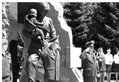
НА ФОТО: ОТКРЫТИЕ ПАМЯТНИКА

В сквере на Красном проспекте был торжественно открыт памятник пожарным и спасателям. На церемонии были вручены награды наиболее отличившимся пожарным и спасателям.