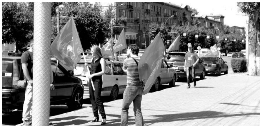
НА ФОТО: КОЛОННА ФИНИШИРОВАЛА В НОВОСИБИРСКЕ У МОНУМЕНТА СЛАВЫ