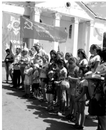
НА ФОТО: МИТИНГ В Р.П. МОШКОВО