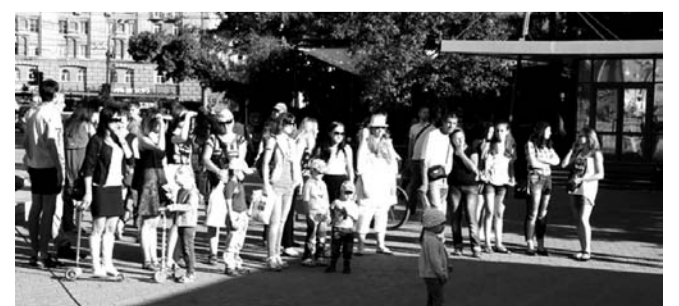
НА ФОТО: ФЕСТИВАЛЬ СОБРАЛ РАЗНООБРАЗНУЮ АУДИТОРИЮ