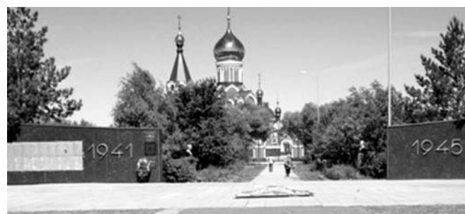
НА ФОТО: ГЕРОЯМ — ЛИШЬ ОДИН ВЕНОК ОТ «ПРАВИЛЬНЫХ» ЛЮДЕЙ

Антон СЕНОПАЛЬНИКОВ для сайта KPRFNSK.RU