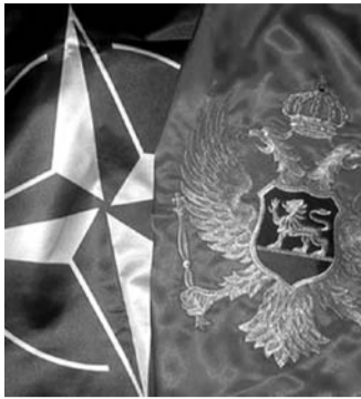
НА ФОТО: НАТО ИДЕТ НА ВОСТОК

В Госдуме предложили принять радикальные меры в ответ на приглашение Черногории в НАТО. В качестве ответных мер на активизацию НАТО, в частности, на приглашение Черногории в члены альянса, Россия могла бы перестать сотрудничать с США в сфере поставок титана и выйти из договора о стратегических наступательных вооружениях (СНВ), заявил «Интерфаксу» первый замглавы думского комитета по международным делам Леонид КАЛАШНИКОВ .