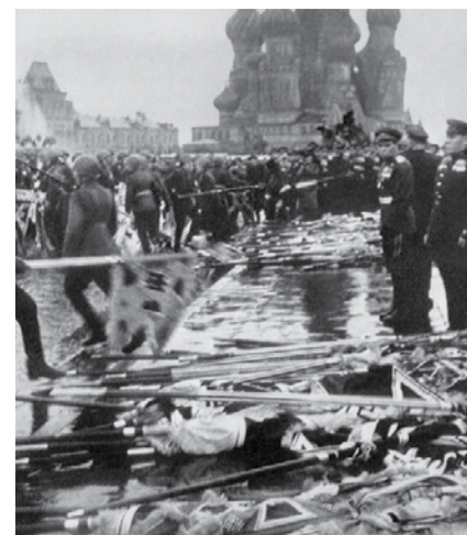
НА ФОТО: ПАРАД ПОБЕДЫ 1945 ГОДА

С речью о присутствующим обратился по поручению Правительства В.М.МОЛОТОВ — Заместитель Председателя Государственного Комитета Обороны. Он поздравил воинов Красной Армии, которые под руководством Верховного Главнокомандующего И.В.Сталина одержали великую победу над гитлеровским фашизмом. Затем приветствия прозвучали в честь командующих фронтами и армиями,