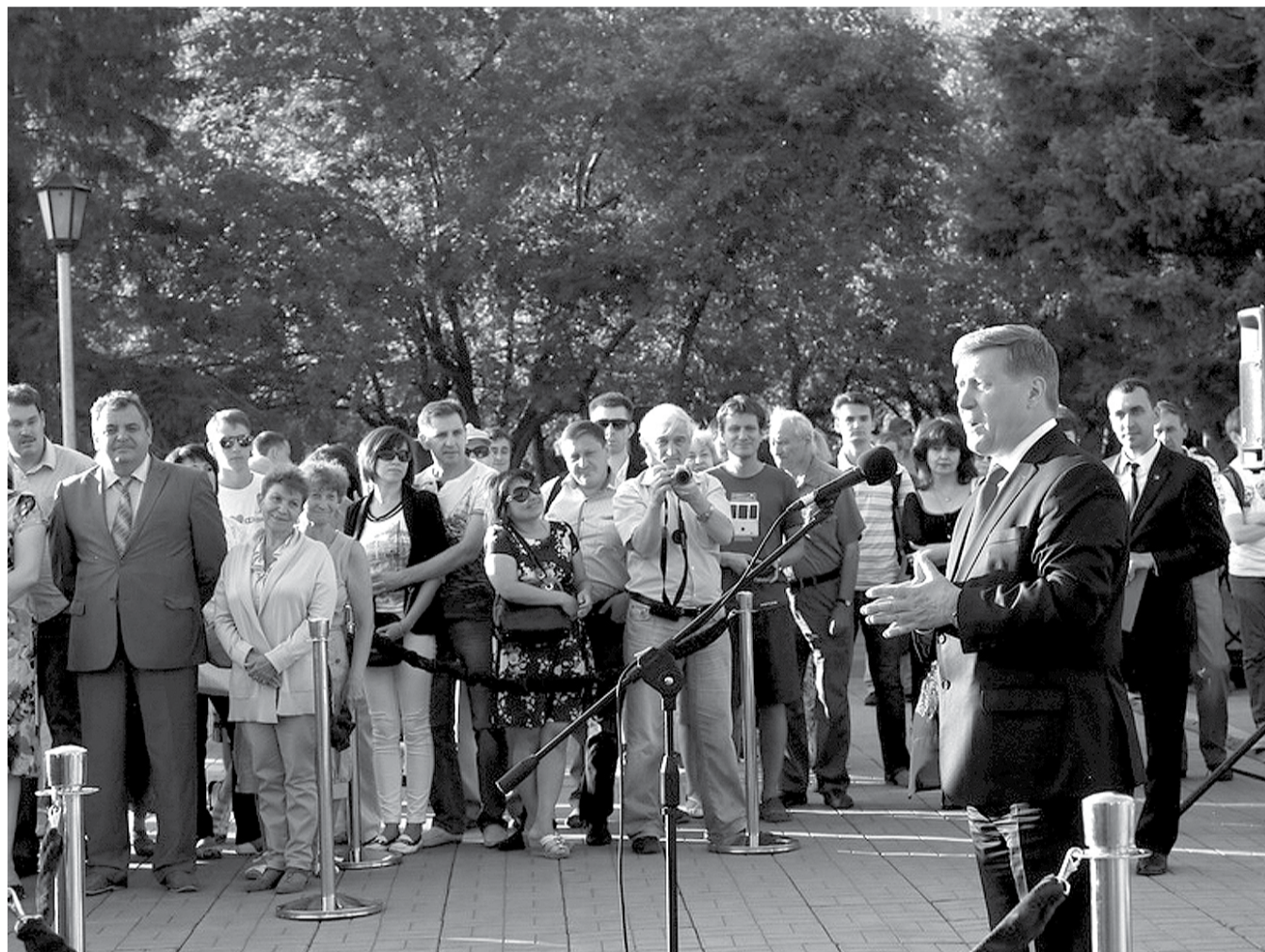
НА ФОТО: МЭР НОВОСИБИРСКА АНАТОЛИЙ ЛОКОТЬ ПОЗДРАВИЛ ГОРОЖАН С ДНЕМ ГОРОДА