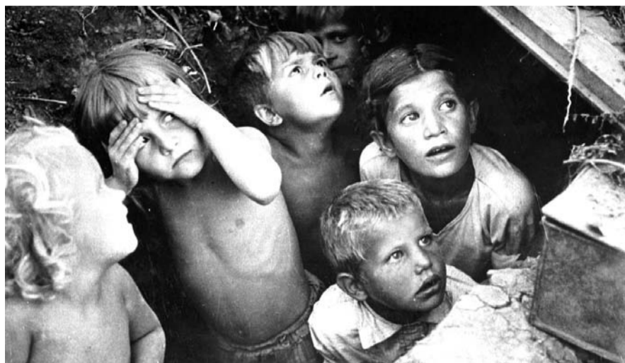
НА ФОТО: ТОГДА У ДЕТЕЙ БЫЛА НАДЕЖДА. ЕСТЬ ЛИ ОНА СЕЙЧАС?

Я родился 7 февраля 1925 года. Физически, юридически и «практически» отношусь к «детям войны». Испытал все не-