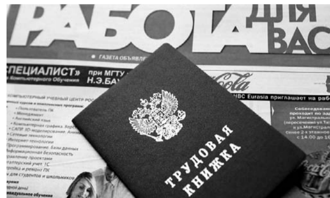
НА ФОТО: РАСТЕТ РИСК ПОТЕРЯТЬ РАБОТУ