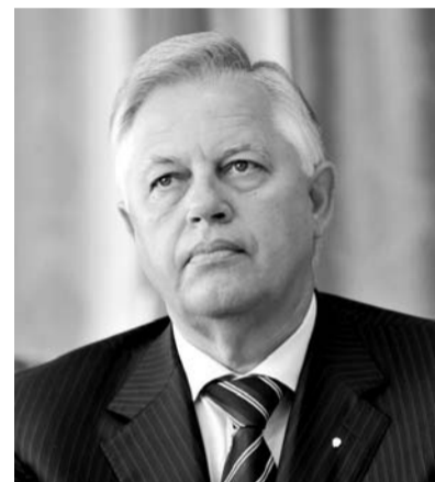
НА ФОТО: ПЕТР СИМОНЕНКО

Законы, принятые 9 апреля Верховной Радой восьмого созыва, в том числе №2558 «Об осуждении коммунистического и национал-социалистического тоталитарных режимов в Украине и запрете пропаганды их символики», грубо нарушают Конституцию Украины и приведут к эскалации напряженности в украинском обществе. Об этом в комментарии корреспонденту «ГолосUA» заявил лидер Коммунистической партии Украины Петр СИМОНЕНКО .