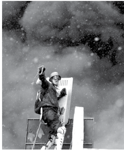
НА ФОТО: ПЕРЕМИРИЕ ЗАКОНЧИЛОСЬ

Единственно, не понятно, на что рассчитывают власти Украины. Ведь предыдущие попытки решить проблему с помощью оружия заканчивались военными поражениями. Сейчас экономика страны еще слабее, а желание украинских граждан участвовать в гражданской войне еще меньше. Да и по сравнению с предыдущими перио-