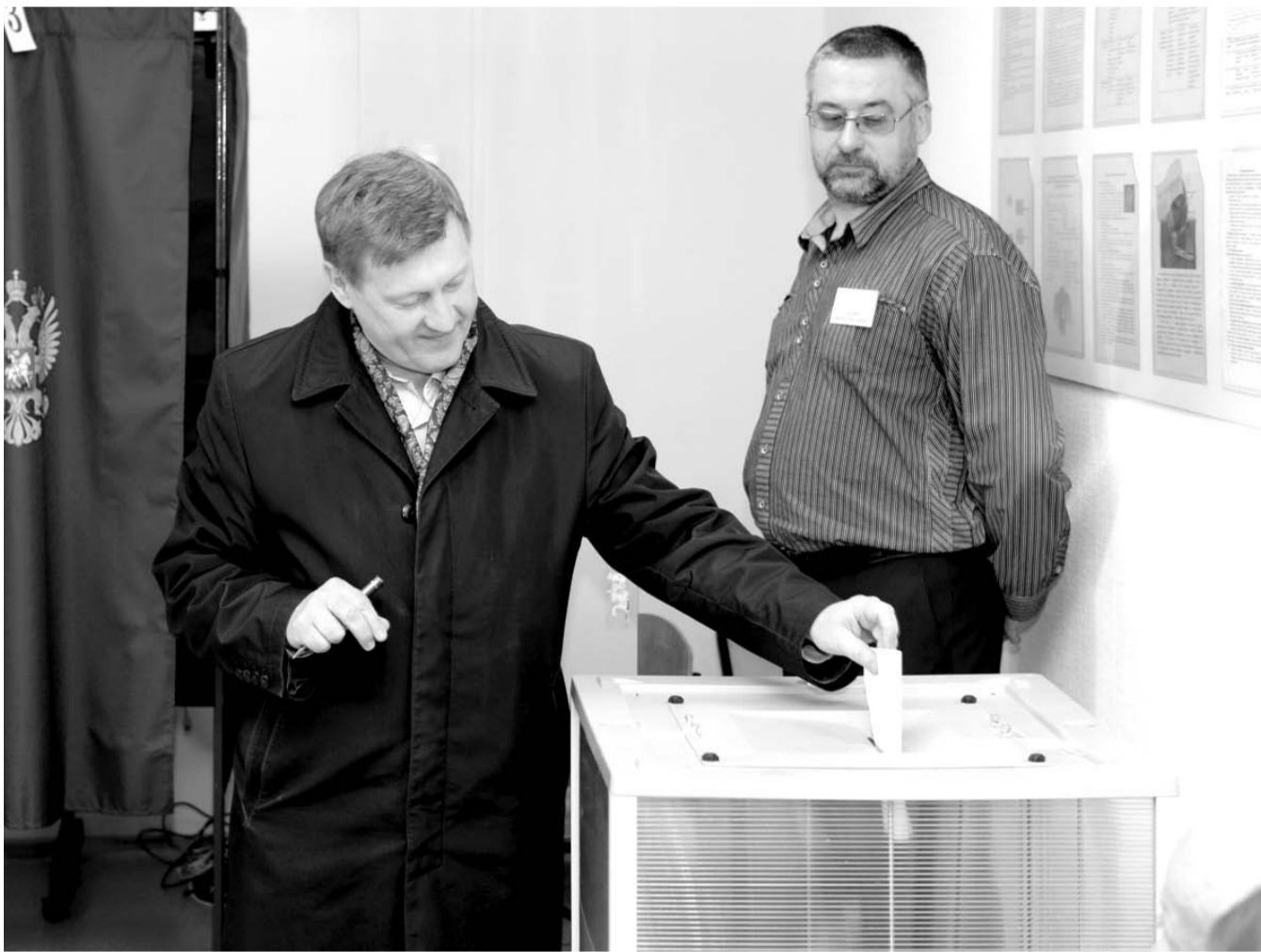
НА ФОТО: ПРЯМЫЕ ВЫБОРЫ МЭРА НОВОСИБИРСКА СОХРАНЯТСЯ. УДАСТСЯ ЛИ ОТСТОЯТЬ ДРУГИЕ МУНИЦИПАЛИТЕТЫ ОБЛАСТИ?