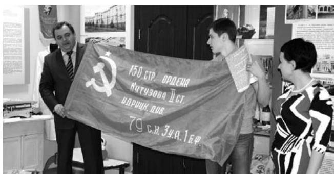
НА ФОТО: ДЕПУТАТ ВРУЧАЕТ КОПИЮ ЗНАМЕНИ ПОБЕДЫ