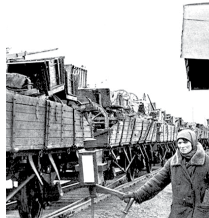
НА ФОТО: ЭШЕЛОН НА ВОСТОК

В восточные районы страны были вывезены многие научные и культурные учреждения, ценнейшие экспона-