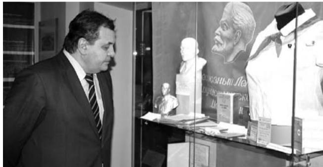
НА ФОТО: РЕНАТ СУЛЕЙМАНОВ НА ОТКРЫТИИ ВЫСТАВКИ

В музее Центрального района Новосибирска открылась экспозиция, посвященная культурным и промышленным предприятиям, расположенным в Центральном районе. Открытие выставки посетил вице-спикер Совета депутатов города Новосибирска Ренат СУЛЕЙМАНОВ , чья жизнь неразрывно связана с Центральным районом нашего города.