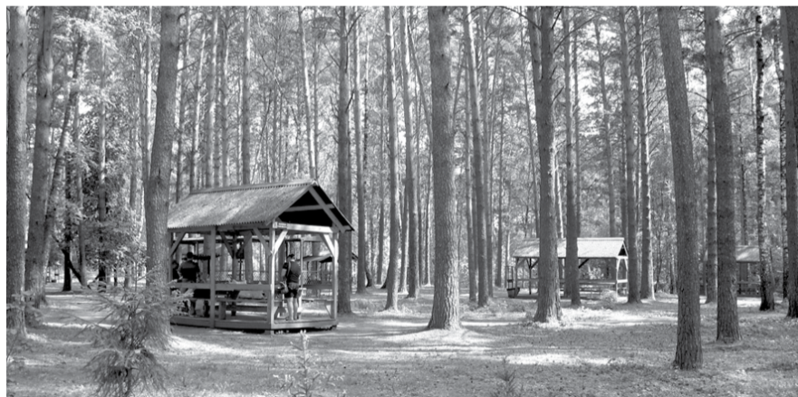
НА ФОТО: ЗАЕЛЬЦОВСКИЙ БОР - ЛЮБИМЫЙ ПАРК НОВОСИБИРЦЕВ

— Разумеется, мы будем проводить общественные слушания, чтобы понять, как новосибирцы видят будущее парковых зон. Это будет проводиться в связке с бизнесом, под постоянным контролем. Только за счет бюджета нельзя произвести масштабные изменения в развитии парковых зон, — считает Анатолий Локоть. — На первом месте